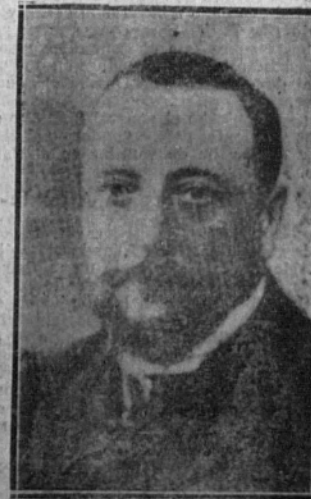
Sr. Fernández Prada, ministro de la Gobernación