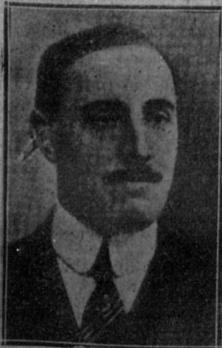
D. Pablo Garnica, ministro de Gracia y Justicia