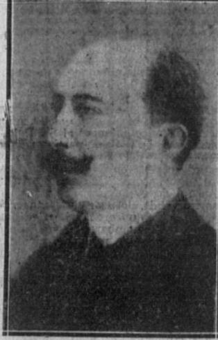
Sr. Marques de Lema, ministro de Estado