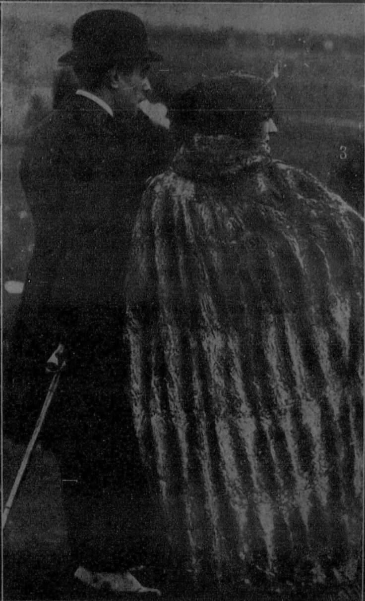
1. Llegada a París del primer aeroplano con números de EL FIGARO.—2. El gran actor de "cine,, Antonio Moreno es, durante sus ocios, un gran jugador de "tennis,,.—3. La moda en las carreras. Un suntuoso abrigo de pieles.