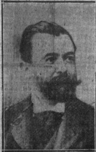
Sr. Conde de Bugallal, ministro de Hacienda