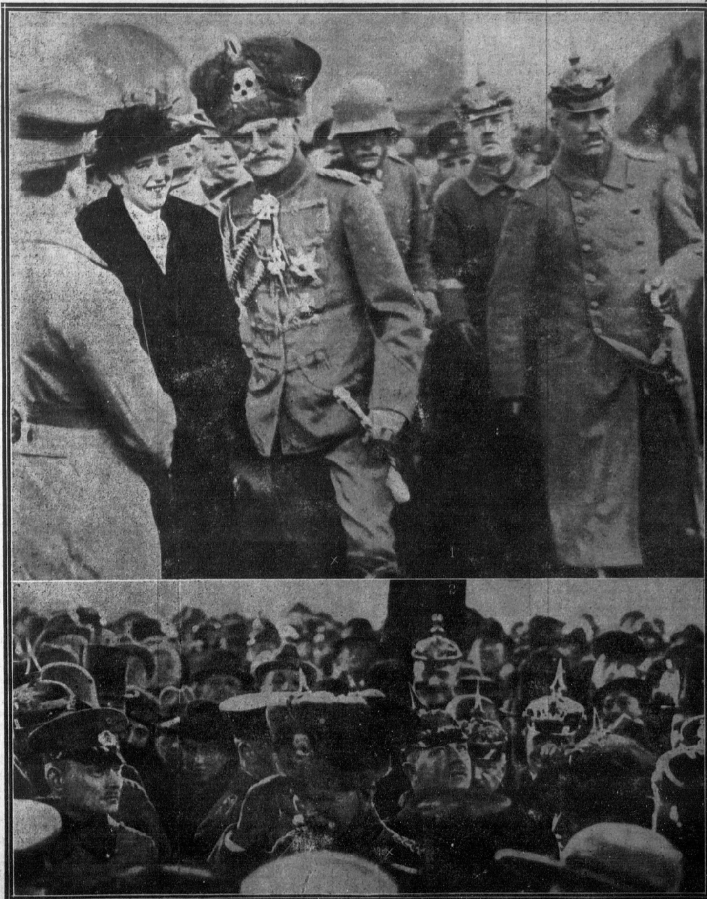
1 y 2.—Gran número de personas acudieron a la estación de Auhalt para aclamar al feldmariscal Makensen, que ha sido autorizado por los aliados para regresar a Alemania. Nuestras fotografías lo representan rodeado de sus compañeros de armas.