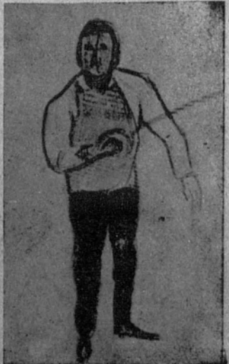
Otra actitud del maestro.