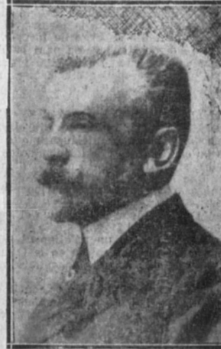
D. Amalio Gimeno, ministro de Fomento

prestó juramento ante el Rey y de los incidentes culminantes desarrollados en torno a la crisis durante las últimas veinticuatro horas.