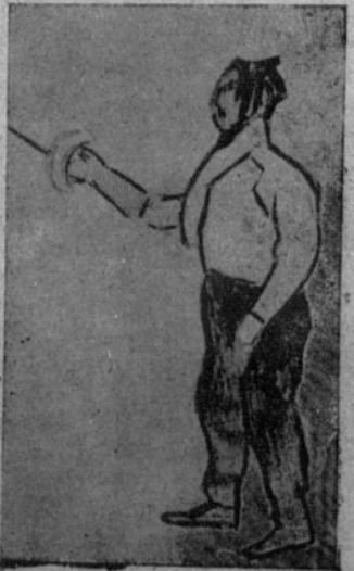
Una actitud del maestro Carbonell dando lección.