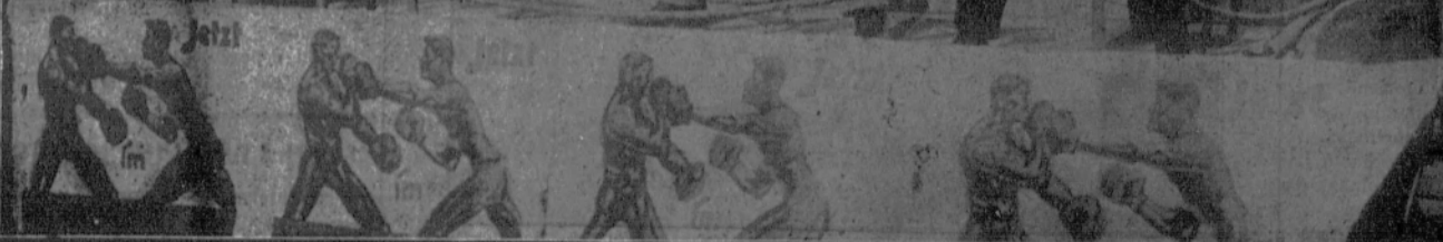
En la capital del antiguo Imperio alemán reina como una fiebre de divertimento, y los empresarios buscan la manera de anunciar atractivamente los espectáculos. (1) Anuncio original de un cinematógrafo. (2) Una parodia de «match» de «boxe» para anunciar un «match» real.