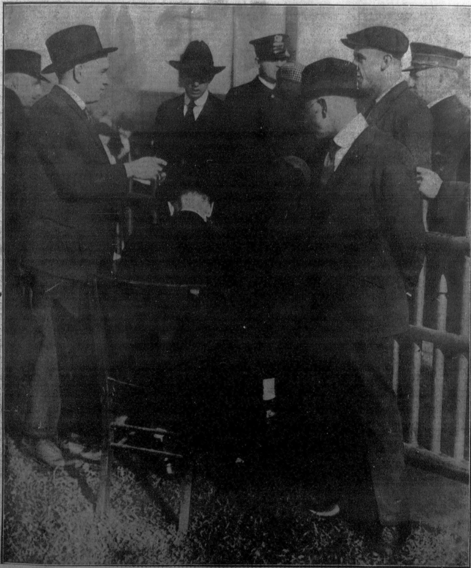
EN CHICAGO.—Los jefes de una Empresa pagando a sus obreros, que acaban de abandonar el trabajo. Un agente de policía presencia la operación.