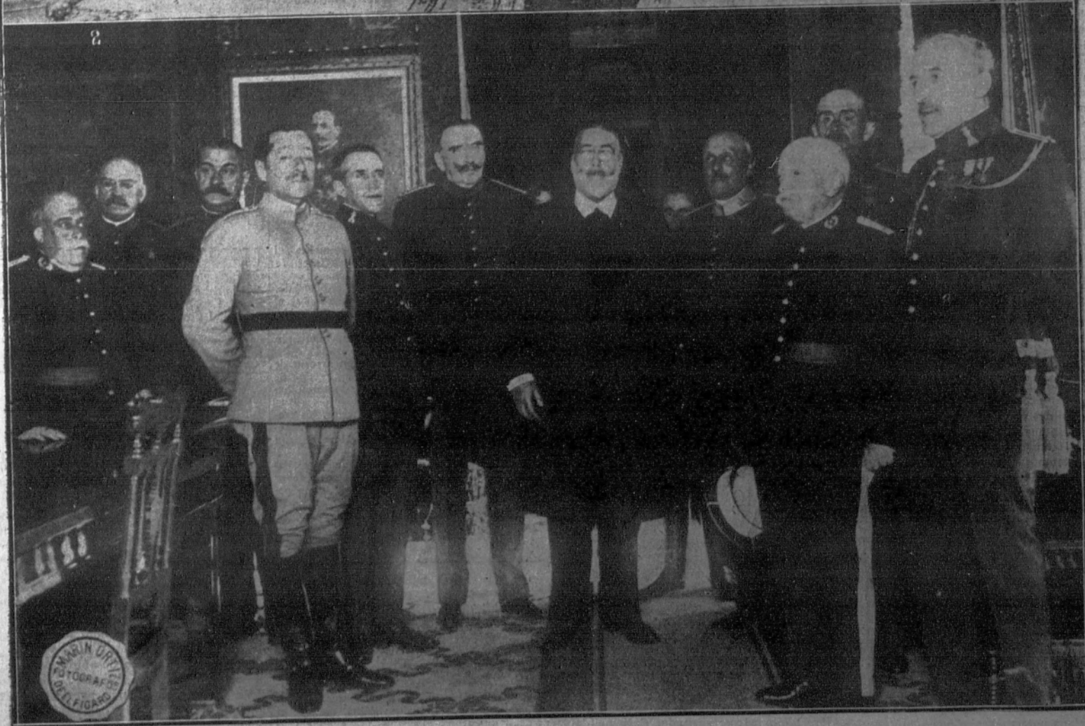
1. Banquete ofrecido por D. Natalio Rivas, ministro de Instrucción pública, a los miembros de la Sociedad granadina La Oración de la Tarde.—2. El presidente del Consejo de ministros, Sr. Allendesalazar, al tomar posesión interina del ministerio de la Guerra.