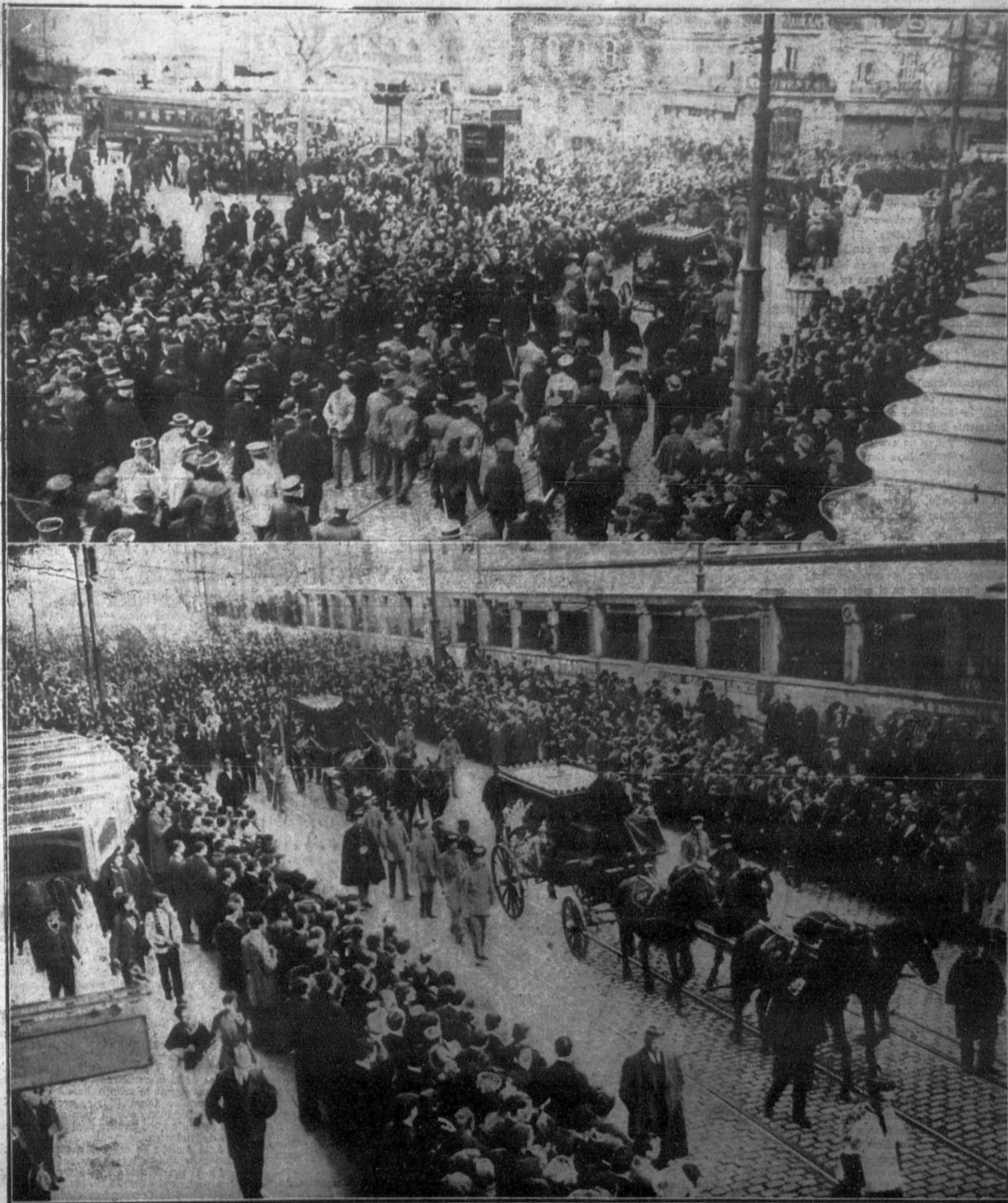
1. La presidencia del duelo al entrar en las Ramblas.—2. La comitiva fúnebre a su paso por la calle de Pelayo.