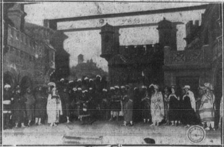
Una escena de "Los leones de Castilla"

¿Cómo negarle una suprema habilidad y una inspiración enorme al maestro Serrano?