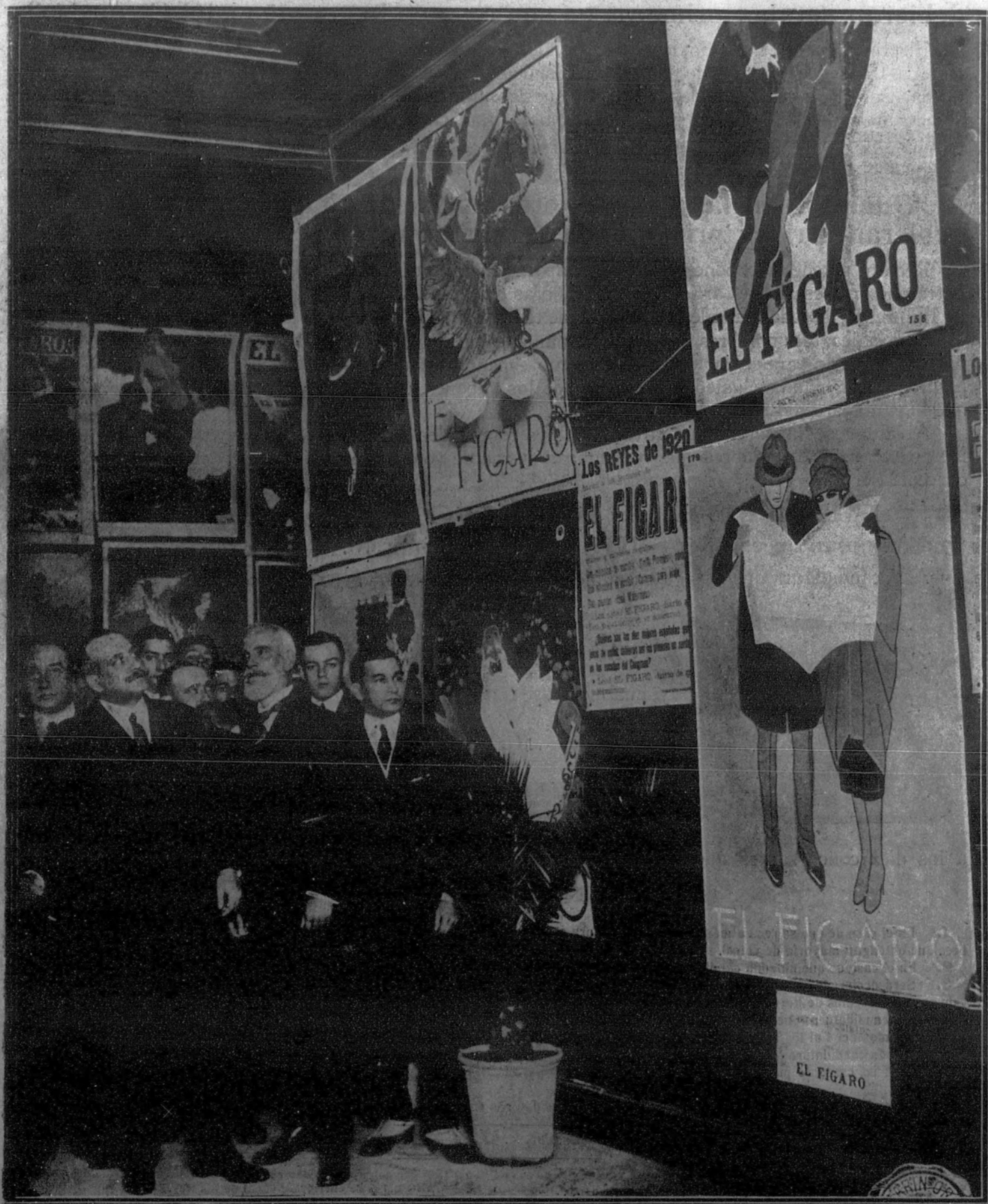
Después quedó clausurada la Exposición de carteles de EL FIGARO. Con este motivo, nuestros salones se vieron honrados con la visita del ministro de Instrucción pública,

EL MINISTRO DE INSTRUCCION PUBLICA EN LA CASA DE "EL FIGARO"