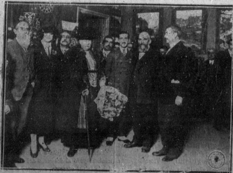
S. A. R. la Infanta Isabel en la Exposición de Cerámica, que se celebra en el Salón de Bellas Artes

Le Comité de secours aux familles des mobilisés français de Madrid, désirant rendre compte de son mandat, prie les membres de la colonie française de cette ville de vouloir bien assister à la réunion qui aura lieu dimanche prochain, 21 décembre, à seize heures et demie, au Cercle de l'Union Française, calle del Príncipe, número 17.