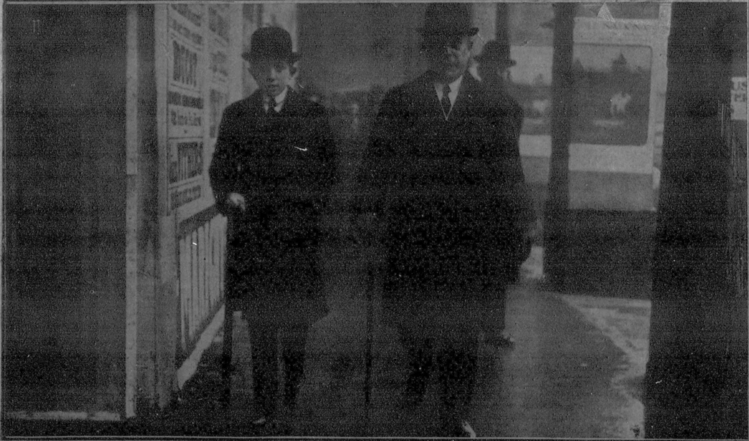
1. Su Majestad la Reina doña Victoria acompañada de Mme. Poincaré, a la salida de la Opera, después del estreno de «Goyescas».—2. El Infante D. Jaime sorprendido por el objetivo, durante uno de sus paseos por París.