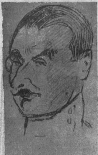
EL CONDE DE ASMIR