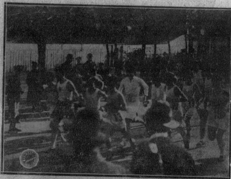
Salida de los corredores, en el paseo de Rosales.