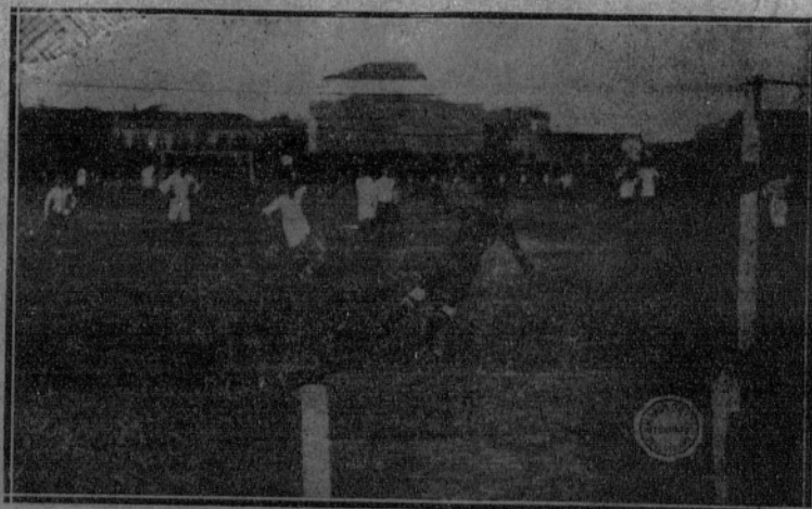
Una fase del partido jugado ayer entre los primeros equipos del Athletic Club y del Madrid F. C.