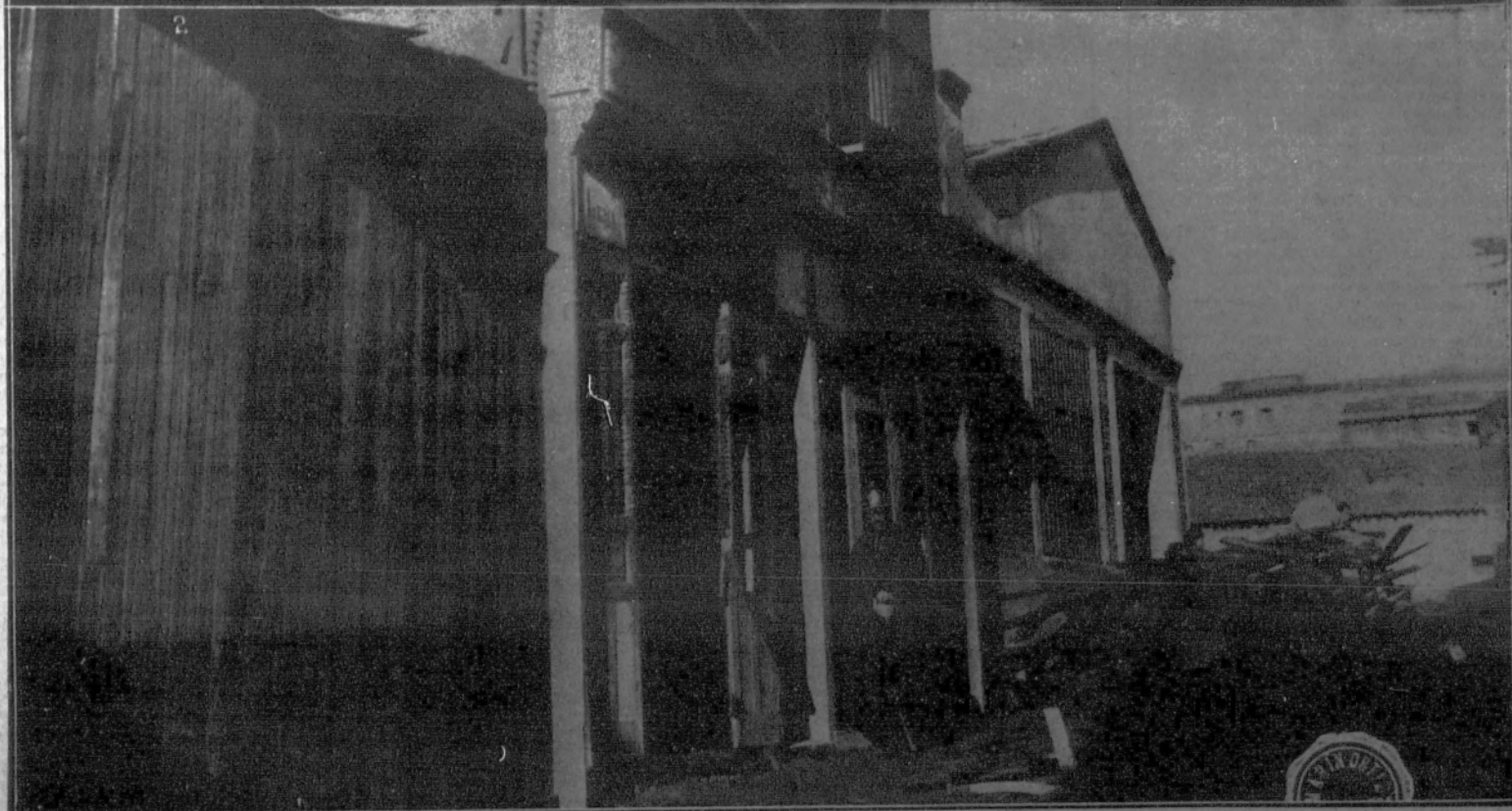
1. Ceremonia del reparto de premios en el Centro Instructivo de Ciegos.—2. El último incendio: La fachada de la carpintería de la calle del Acuerdo, después de haber sido sofocado el fuego por los bomberos.