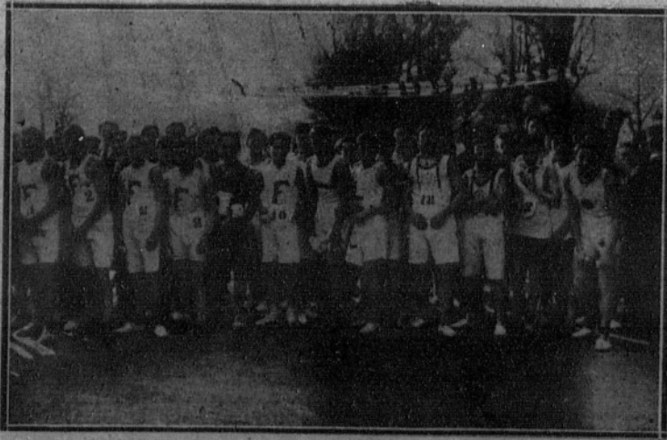
Salida de los corredores, en prueba organizada por el Club Fortuna.