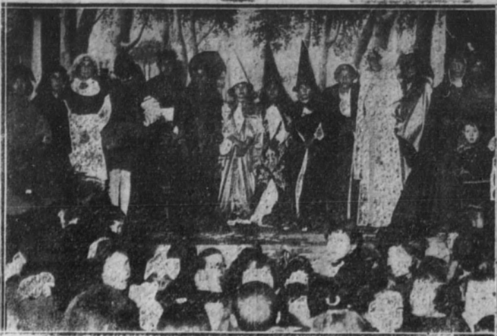
Las niñas que han representado "El príncipe que todo lo aprendió en los libros", de Benavente, con motivo de la fiesta de la Mutualidad Escolar

La muerte ha ocurrido repentinamente, a consecuencia de un ataque de disnea, y produjo general sentimiento por las múltiples simpatías de que disfrutaba entre la bue-