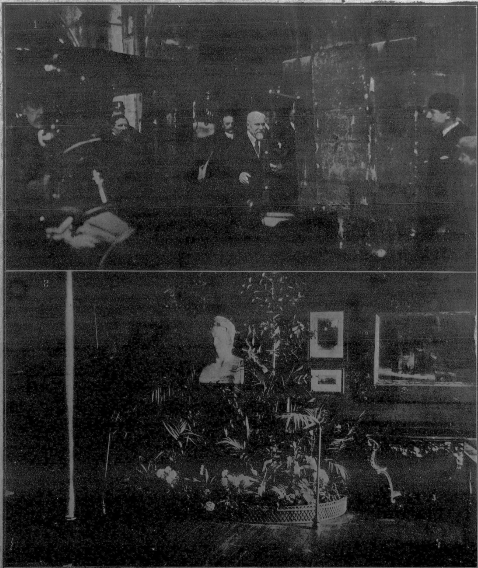
1. El presidente de la República, M. Poincaré, asiste a la reapertura. 2. Una de las salas de la casa de Victor Hugo. En el centro, el busto del poeta, cuando joven.

REAPERTURA DE LA CASA DE VICTOR HUGO, EN PARIS