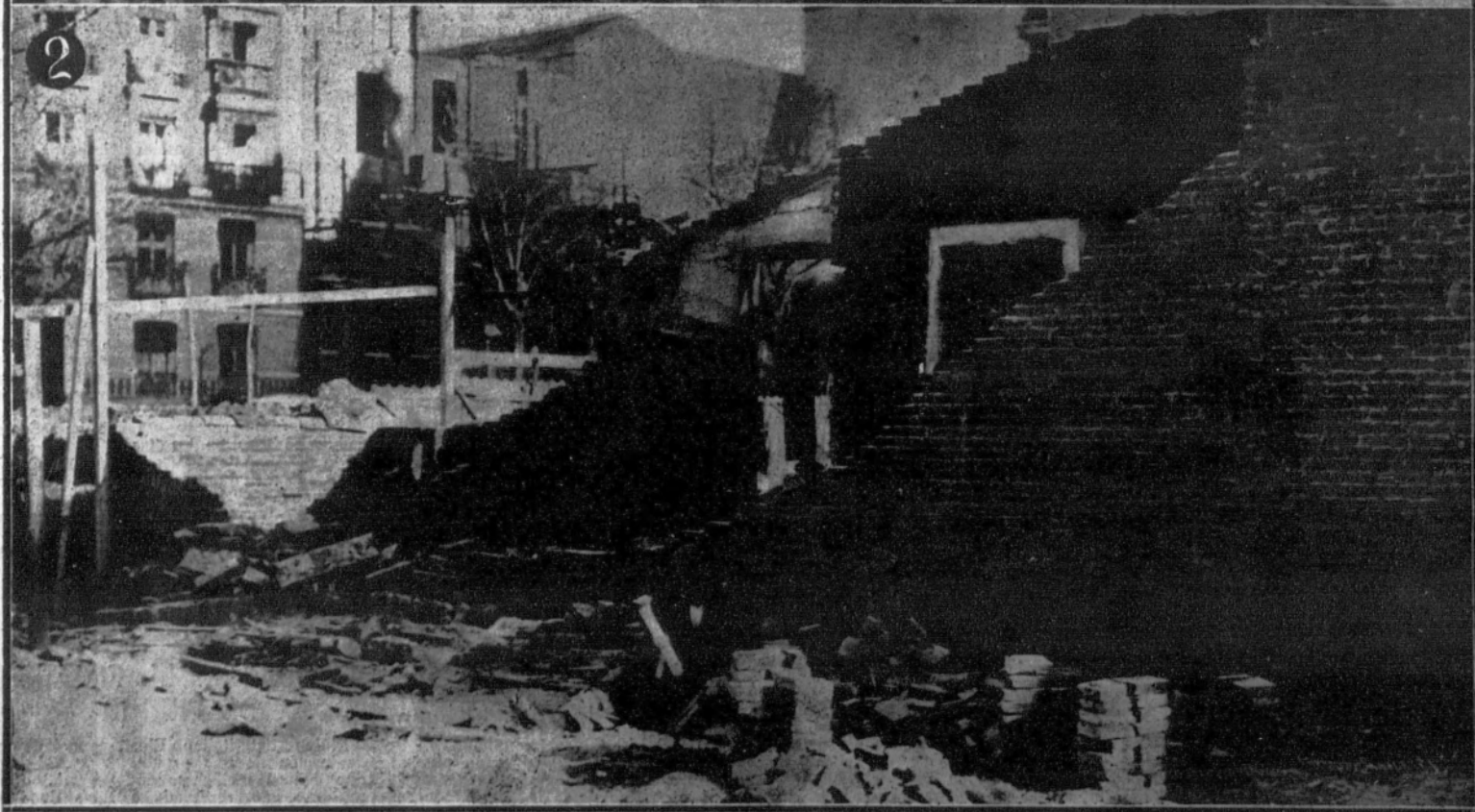
1. Valla derribada por el vendaval en la calle de Goya.—2. Muro destruido por idéntica causa en la misma calle.