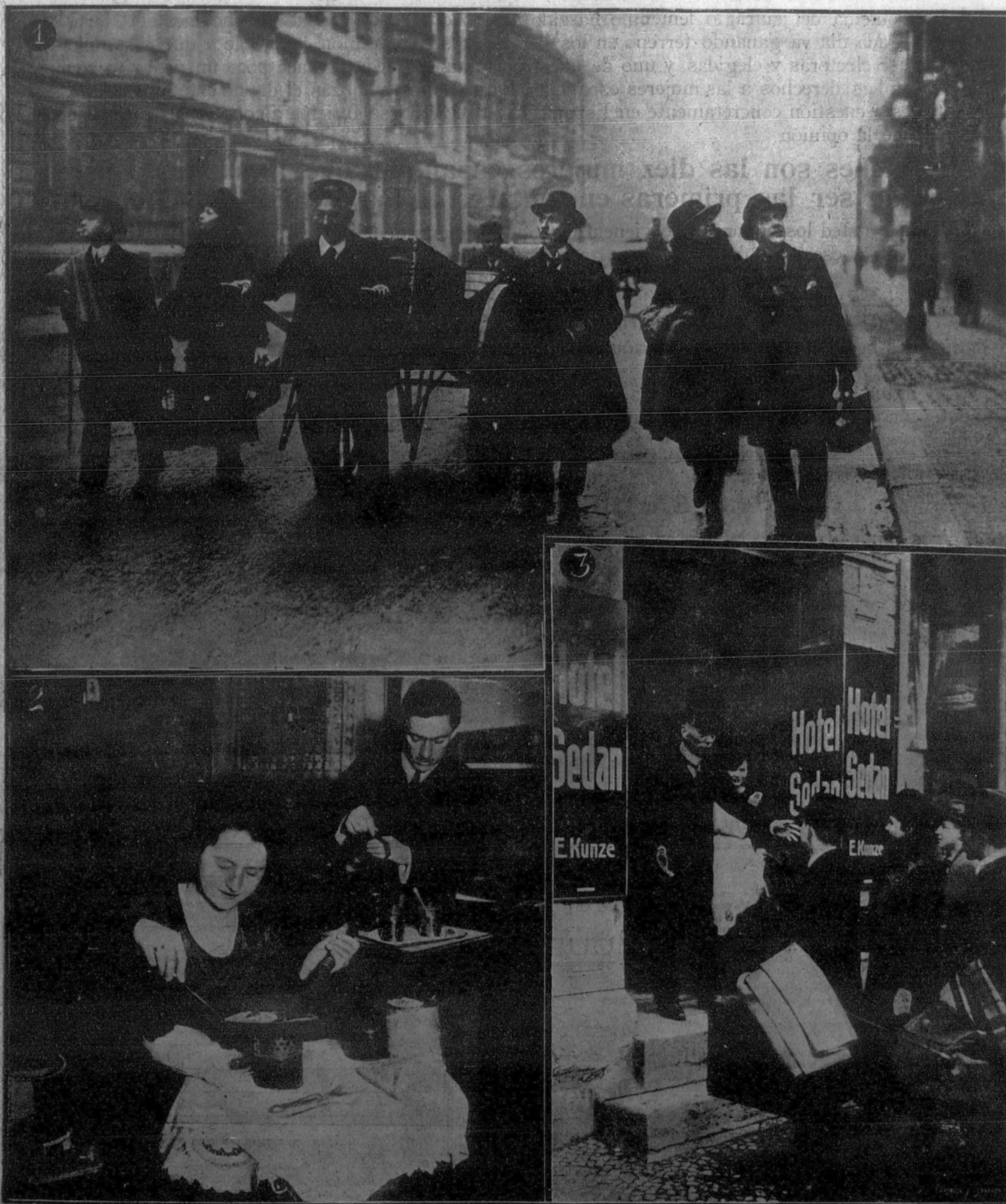
1. Viajeros por las calles de Berlín buscando hotel.—2. Huelga de fondistas y propietarios de hoteles en Berlín. Nuestra fotografía representa a unos viajeros que se hacen la comida en su cuarto.—3. Pasajeros delante de un hotel, a los cuales no se les permite la entrada, por estar ocupadas todas las habitaciones.