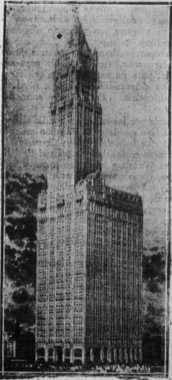
El rascacielos de 58 pisos

Desde lo alto, desde la torre que corona sus cincuenta y ocho pisos, a los cuales se sube por velocísimos ascensores, se domina toda la ciudad de Nueva York, cubriendo por completo la isla de Manhattan y desbordándose al otro lado de los ríos Hudson y Este, a Nueva Jersey y Brooklyn. Al Sur se abre el puerto, sin igual por su grandeza natural y por su tráfico. Nueva York da la impresión de ser la capital de todo este hemisferio de Occidente, rival ya de Londres y París como centro de curiosidad universal y de afanes comerciales. Pero todavía es una ciudad triste; dijérase que sus habitantes han sacrificado su personalidad—el amor a los fines ideales y sensuales de la existencia—para crear este terrible emporio. El rascacielos es como una primera fuga espiritual de la