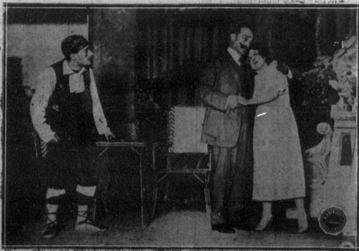
Una escena de la obra "Por jugar con el amor", estrenada anoche en el teatro Fuencarral, Ayuntamiento de Madrid