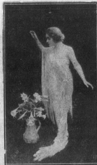
GLADYS BROCKWELL En una de sus mejores creaciones.