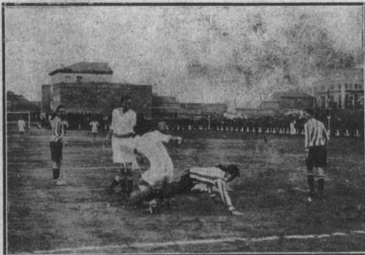
Un momento interesante del partido jugado ayer tarde.

Sin siquiera saber que había tal partido, pues no se nos envió comunicación alguna, y sin que por ello en nuestro número de ayer lo anunciáramos, al no notificárenos la menor cosa por el Club organizador, celebró ayer tarde un partido amistoso entre los primeros equipos de Madrid y del Athletic Club.