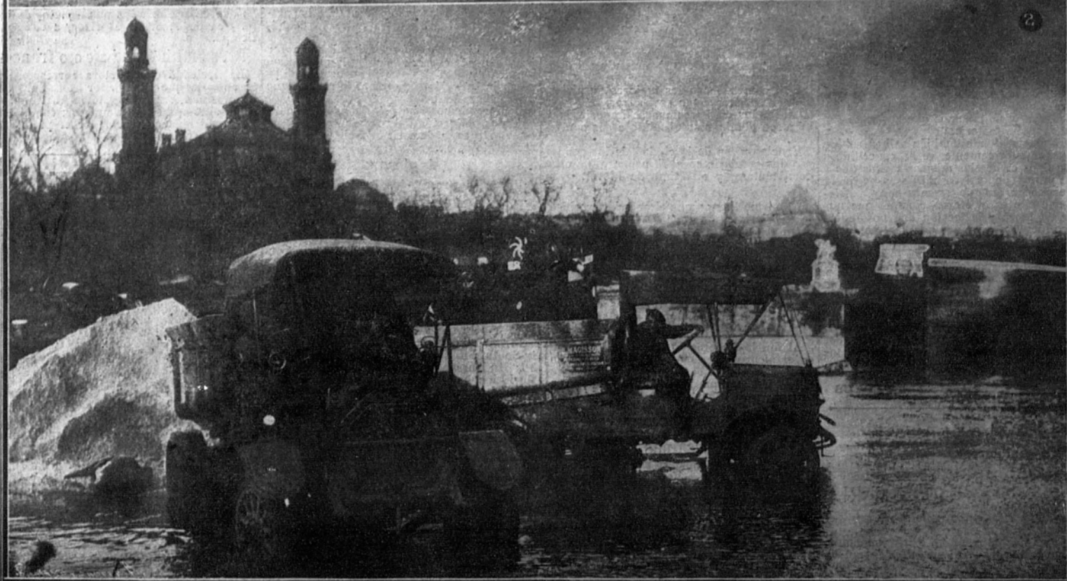
Otra vez está la capital de Francia amenazada de inundación.—1. La esclusa del barrio de la Moneda, sumergida.—2. Camiones automóviles empleados en retirar las mercancías depositadas en los muelles.