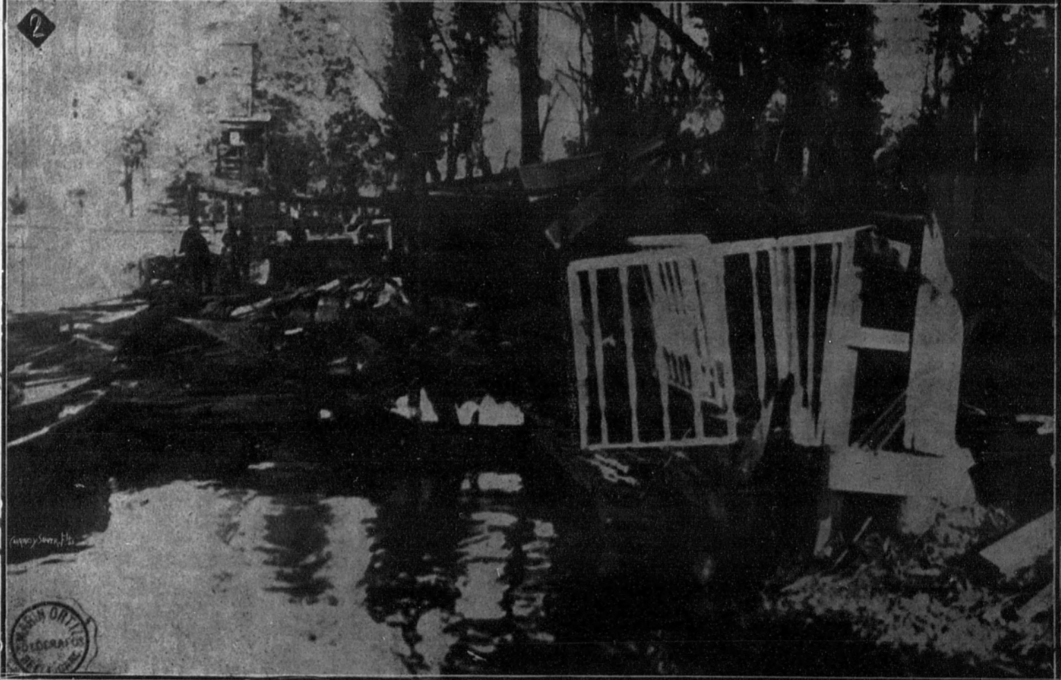
1. Banquete ofrecido por la condesa de San Rafael a los operarios del Bazar Obrero.—2. Estado en que quedaron los talleres de reparación y construcción de barcas del estanque del Retiro, después del incendio.