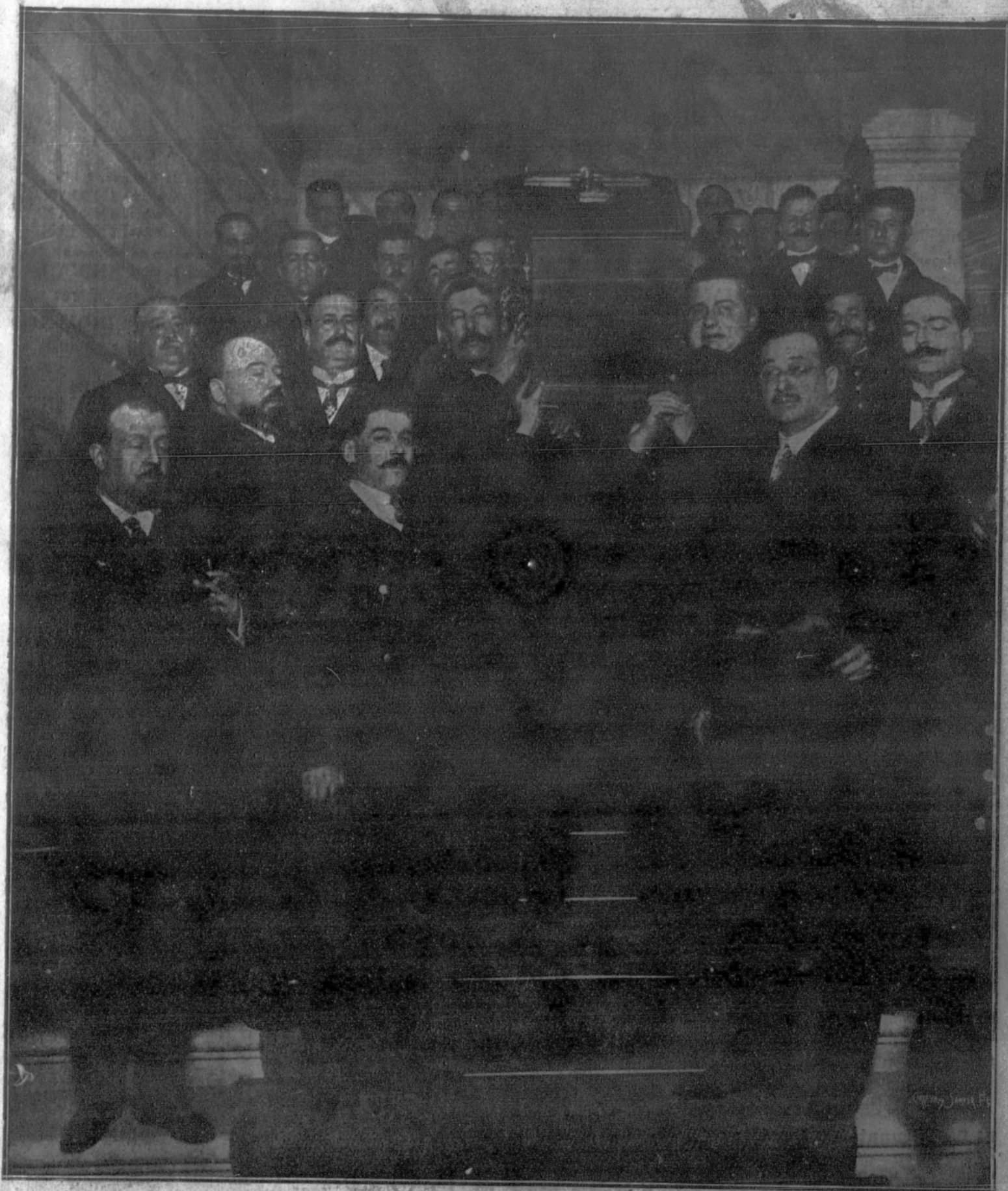
El féretro al ser sacado del Ayuntamiento en hombros por los amigos del maestro.