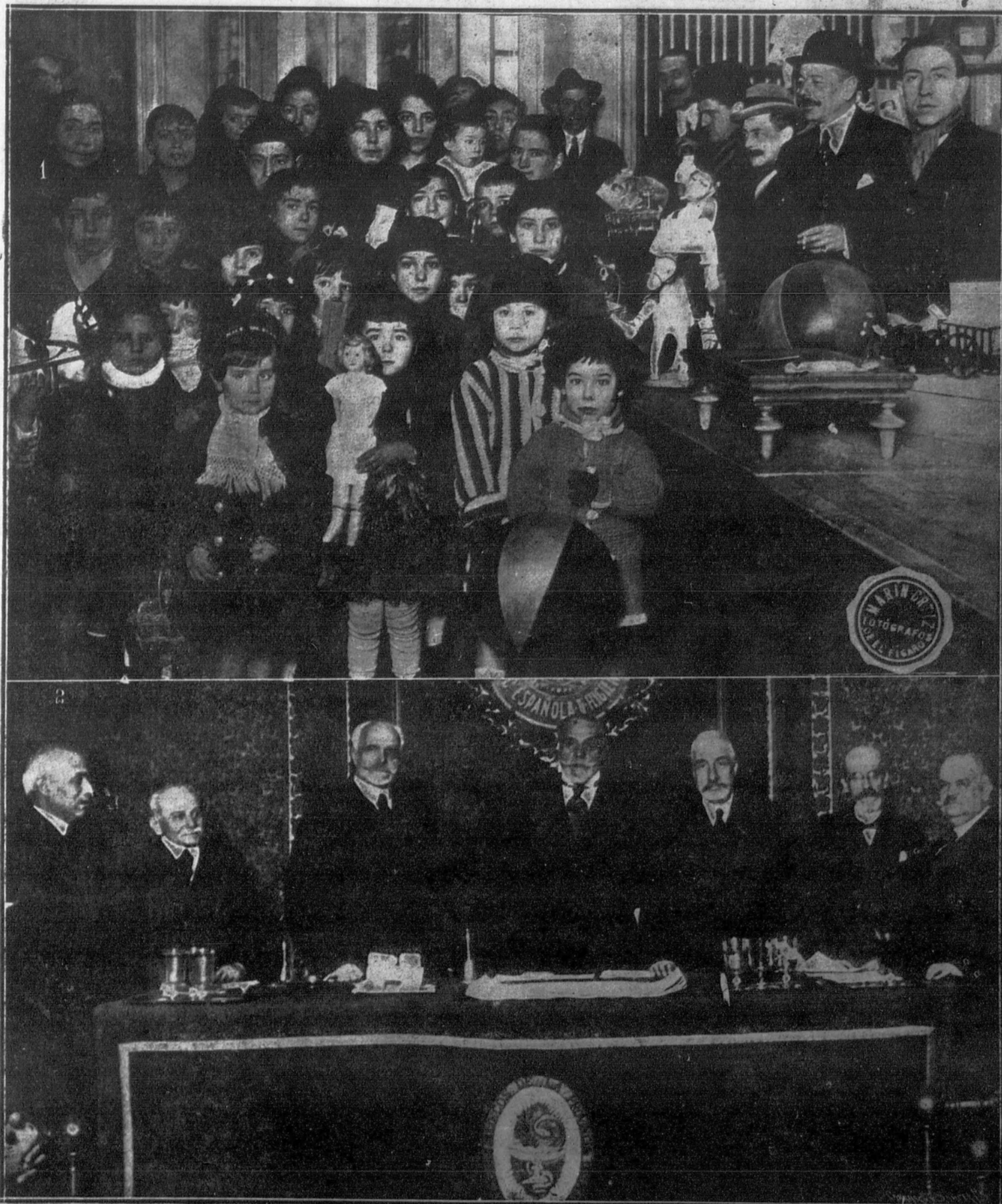
1. La Comisión directiva del Centro de Hijos de Madrid repartiendo juguetes en el teatro del Centro.—2. Sesión inaugural de la Sociedad Española de Higiene, celebrada ayer en el Colegio de Médicos.