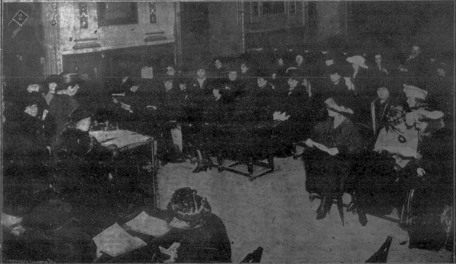
1. El público esperando para comprar tabaco en el kiosco del estanco frente al teatro de Apolo.—2. El Comité español del Congreso de la Alianza internacional para el Sufragio femenino, en la reunión celebrada en el teatro Real.