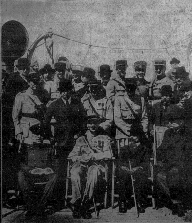
EXPOSICION DE GANADOS EN BUENOS AIRES: 1. El presidente, Irigoyen, inaugura la Exposición; 2. Desfile de los animales premiados.—LAS MISIONES DE AVIACION EN LA AMERICA DEL SUR: 3. El teniente Locatelli, de la Misión italiana, en el momento de partir de Buenos Aires para Rio de Janeiro; 4. Los miembros de la Misión militar francesa fotografiados a bordo del vapor «Belle Isle», a su llegada a Buenos Aires.