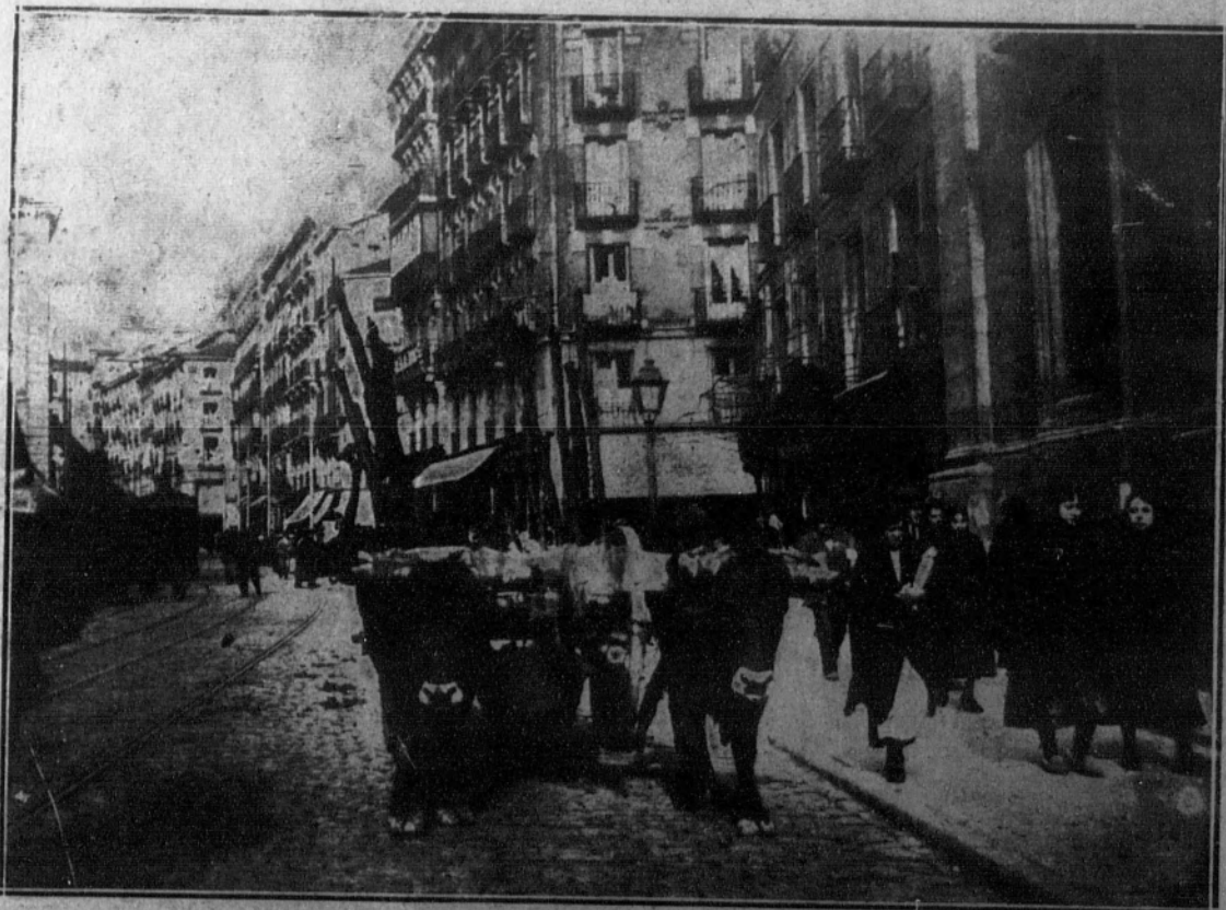
La carreta de bueyes, fea, sucia, pesada, estropea el pavimento y le quita a Madrid todo aspecto de gran ciudad moderna.