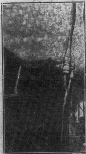
La nueva hélice Levasseur, fácilmente reparable.