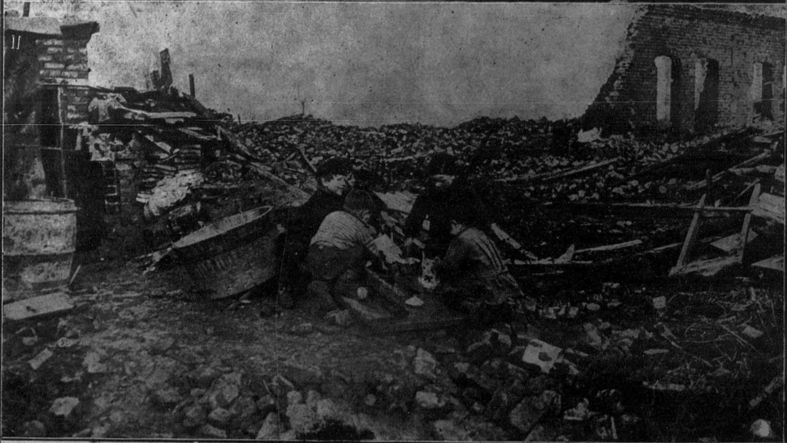
1. En las ruinas de La Bassée: En nuestra fotografía aparece una señora de la Cruz Roja, la cual se dedica a curar a los niños heridos por los proyectiles que no han hecho explosión, habiendo curado hasta 250 niños por mes. 2. Niños jugando en las ruinas de La Bassée.