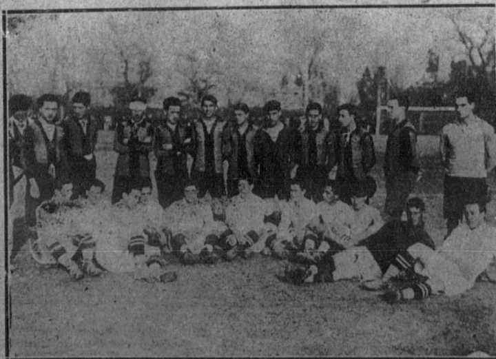
Los equipos Racing, de Madrid, y Sevilla F. C., que han jugado dos interesantes partidos resultando vencedor el primero.