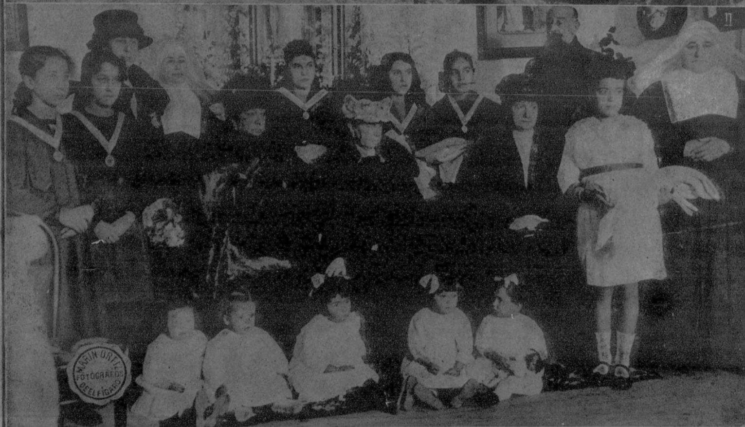
1. Su Majestad el Rey en la Escuela de San Fernando, durante su visita al Nacimiento artístico erigido con objeto de obtener socorros para los niños austriacos.—2. Su Majestad la Reina doña María Cristina en el Asilo de lavanderas, donde repartió ropas a los niños.