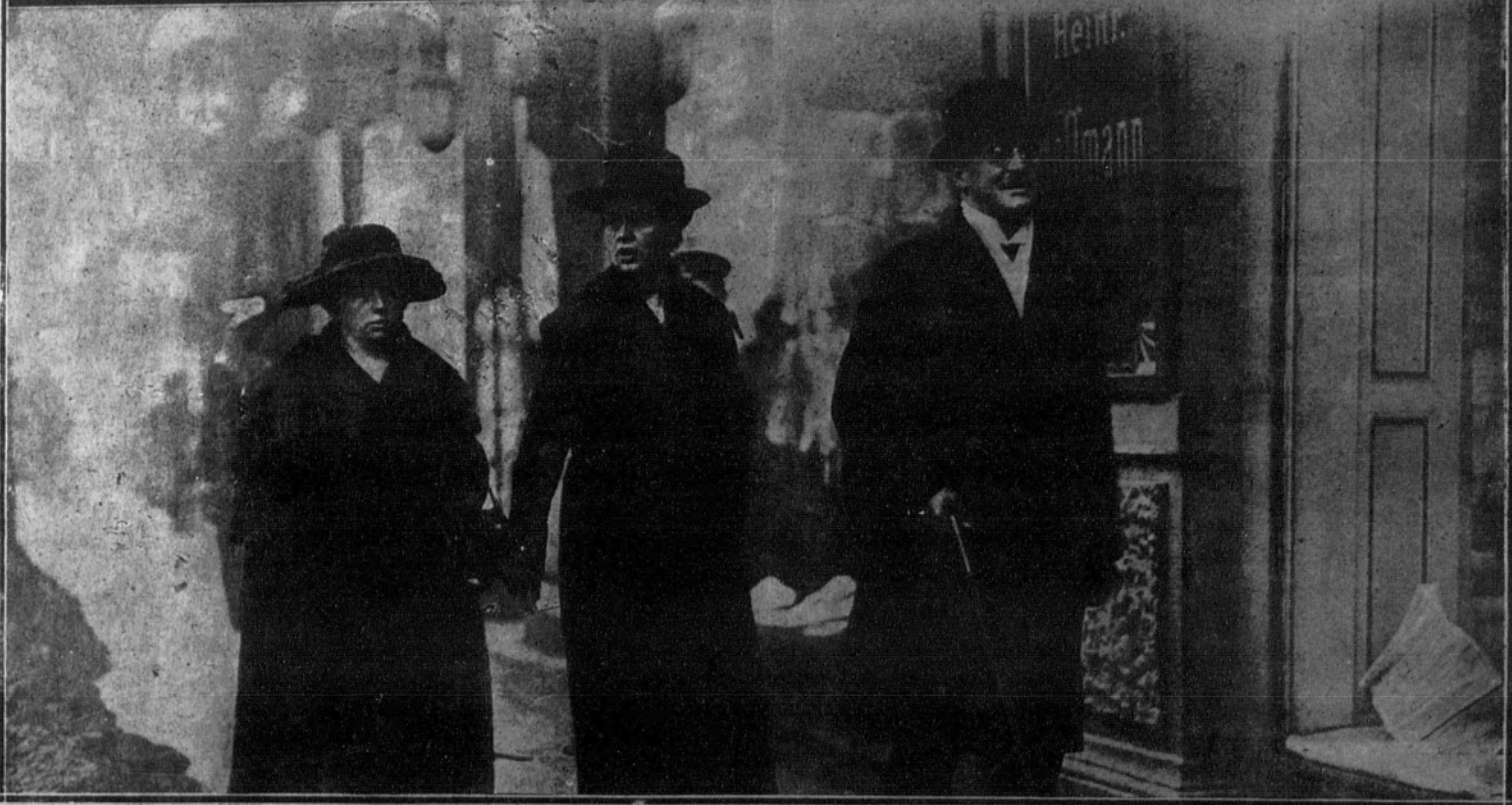
1. Monseñor Pocelli, Nuncio de Su Santidad, que acaba de celebrar importantes conferencias con el Gobierno de Berlín, sobre las relaciones entre la Iglesia Católica y la República alemana.—2. Monumento al famoso dramaturgo alemán Frenz Wedekind, que se ha inaugurado en el cementerio del bosque de Munich.—3. Las señoras de Hebert y Bauer, esposas de los presidentes de la República y del Gobierno alemán, dirigiéndose a visitar el Hospital de inválidos de la guerra.