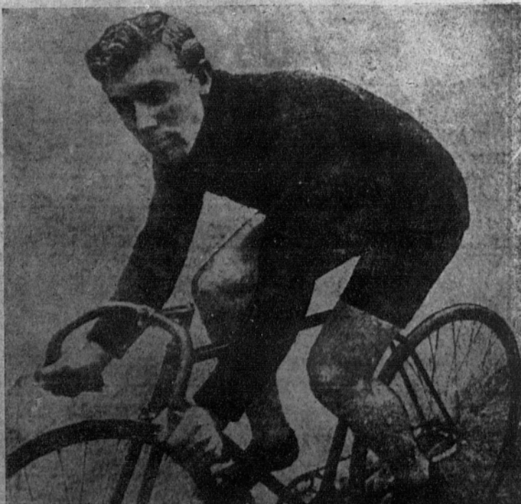
El americano Goulet, una de las primeras figuras en las grandes pruebas que actualmente se corren en París.