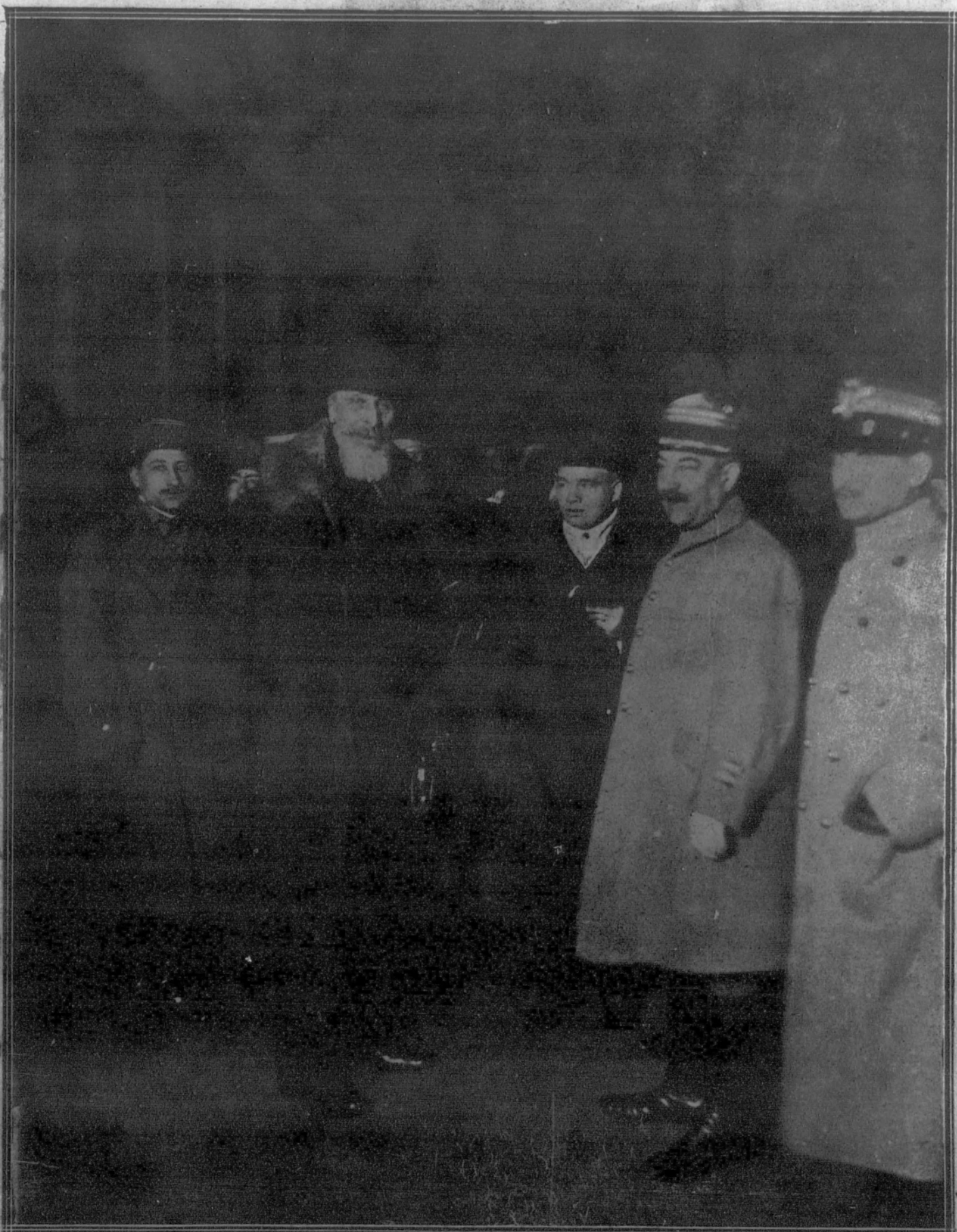
El conde Aponyi a su llegada a la estación del Este, con los miembros de la Delegación húngara encargados de recibir las condiciones de la paz.