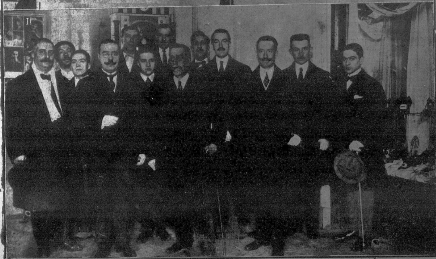
1. La presidencia del Comité español del sufragio femenino, en la reunión celebrada ayer en el salón de actos del Conservatorio.—2. Teatro Romea: Concurrentes a la conferencia que dió ayer el ex ministro Sr. Silió.