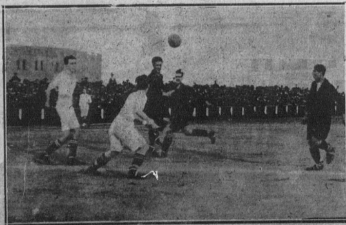
Aspecto del campo y vista de una fase interesante del encuentro.

Un tanto por equipo fué el resultado del partido.