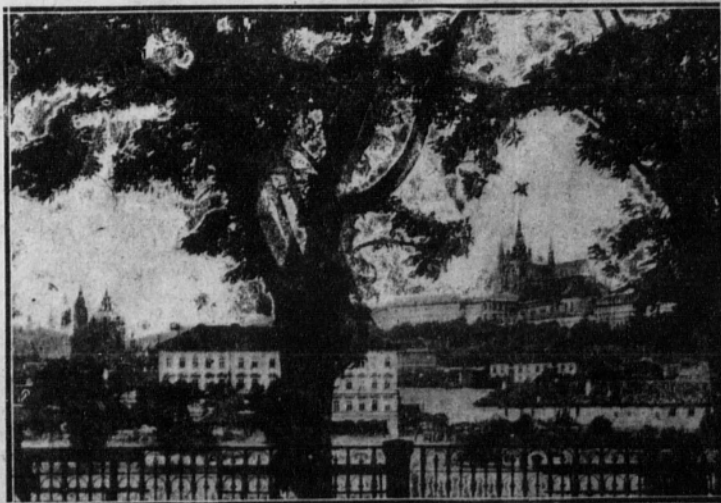
«Hradcany», el antiguo castillo de Praga, actualmente residencia presidencial.

ciadamente, la Conferencia de la paz ha terminado sus trabajos mucho más tarde de lo que nosotros esperábamos. No podíamos determinar los derechos de las minorías en tanto que no hubiésemos aceptado el Tratado de paz con Austria y Hungría. En lo que a Austria y Alemania se refiere, el Tratado está ya concluido y perfecto; solamente con Hungría nos queda algo por arreglar. Desde luego, puedo asegurarle que, pese a lo que ciertos propagandistas chauvinistas digan y sosten-