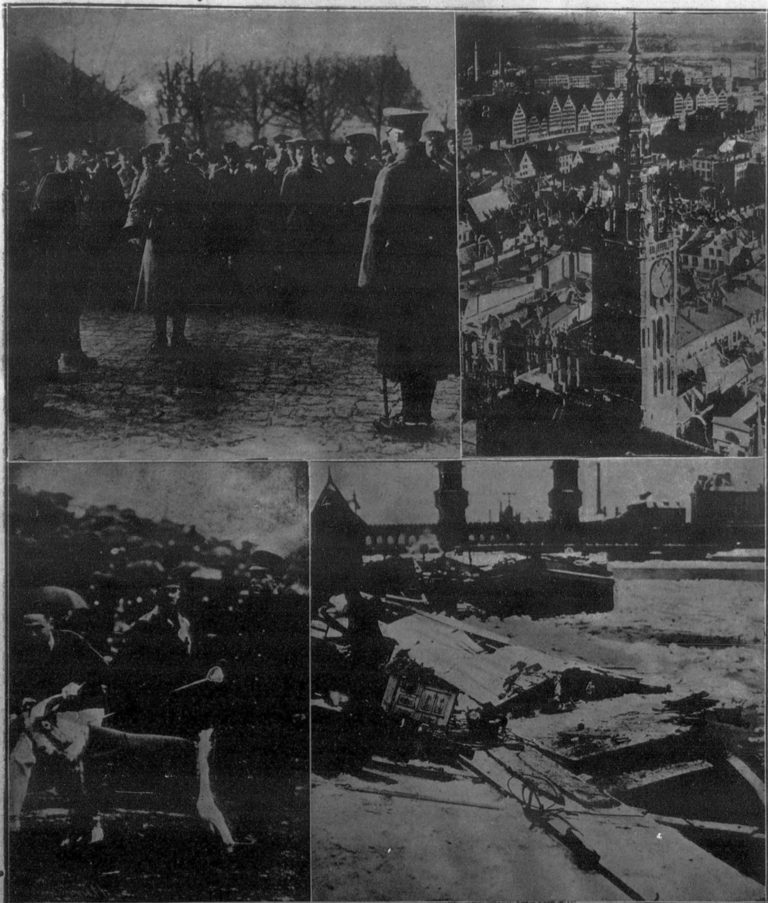
1. BERLIN: El jefe de Seguridad interroga a un revolucionario que acaban de arrestar.—2. La nueva ciudad libre de Dantzig. En nuestra fotografía aparece en primer término la iglesia de la Virgen.—3. ESTADOS UNIDOS: Después de un «match» de «base-ball» entre el Ejército y la Marina. Los marinos y su mascota.—4. El invierno en Alemania: Los peligros del hielo flotante. Un balandro que ha sido averiado por un bloque de hielo.