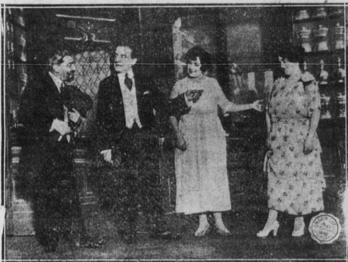
Una escena de "El drama de la botica"