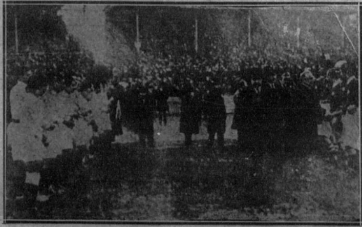
M. Deschanel, presidente de la Cámara francesa, saludando a los «equipiers» que formaban los dos equipos.