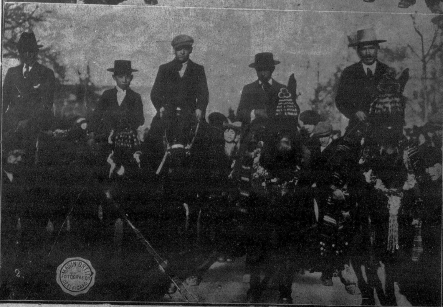
1. Comisión de la Acción Ciudadana al salir de ver a Su Majestad para protestar de los sucesos de Zaragoza y demostrar su adhesión a la Monarquía.—2. Típicos finetes de la romería de San Antón, celebrada ayer.