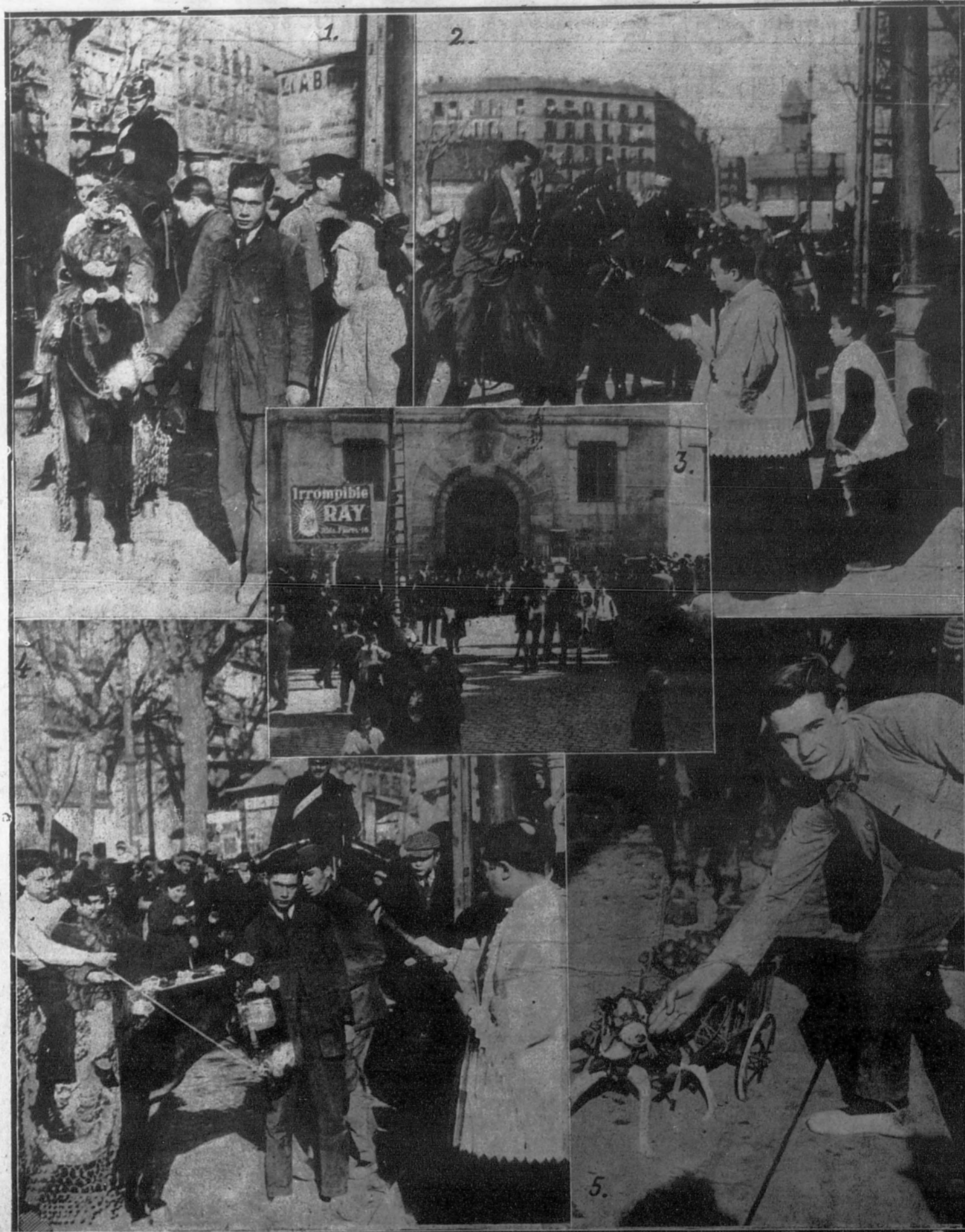
La fiesta de San Antón se celebra todos los años en Barcelona con gran animación. Nuestras fotografías representan detalles pintorescos de la fiesta, y en el centro, la iglesia de San Antonio Abad, donde se instala el altar para la bendición de las caballerías.