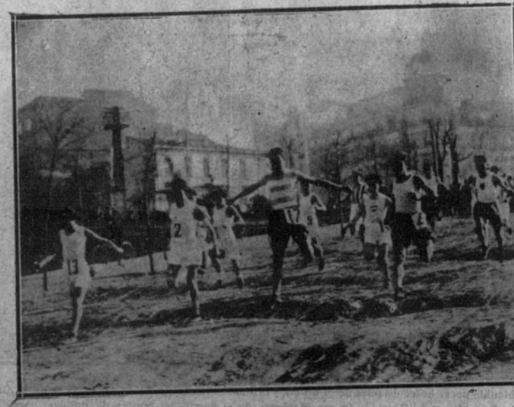
Los corredores en el Parque del Oeste.