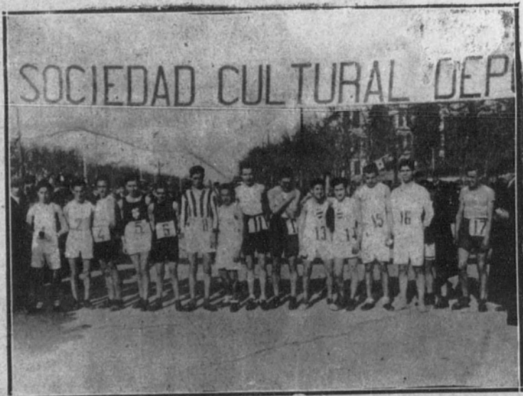
Corredores que tomaron parte.