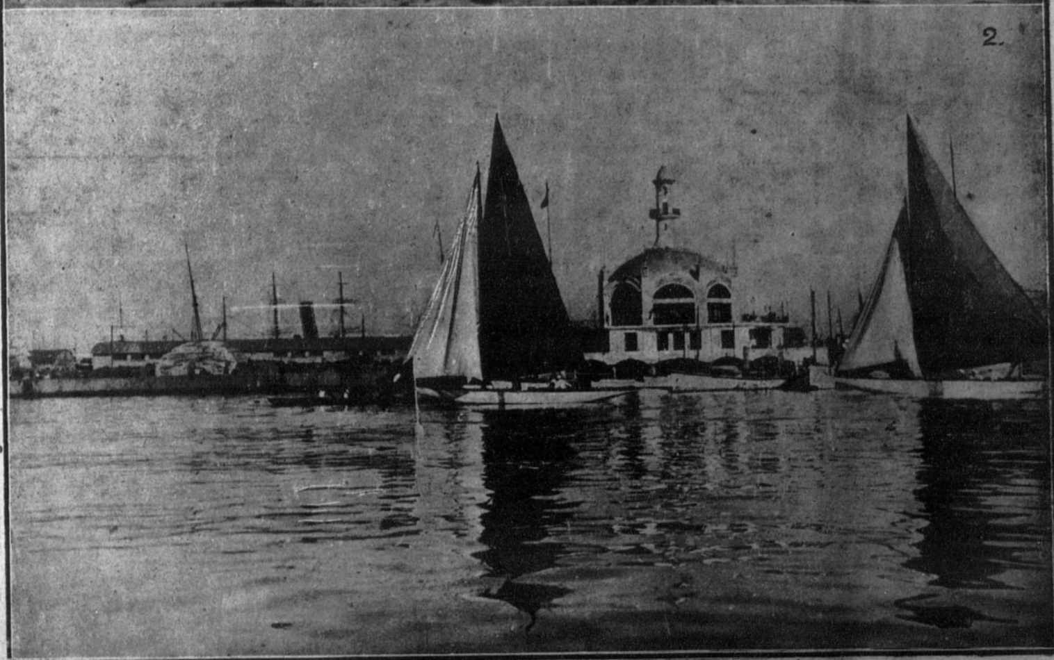
1. Barcelona comerá carne congelada. El vapor inglés «Rubiera» ha llegado al puerto con un cargamento de 800 toneladas, el primero destinado a la ciudad condal.—2. El balandro «Guinea K. 8», vencedor en la regata organizada por el Real Club Marítimo.