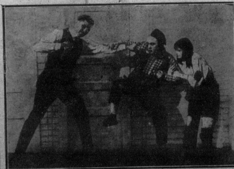
Dempsey, el campeón mundial de boxeo, actuando como actor de «cine» en una película.

Recientemente se ha reunido la Junta de su Real Club de Regatas y acordado la fecha de su celebración, que será el 11 de julio.