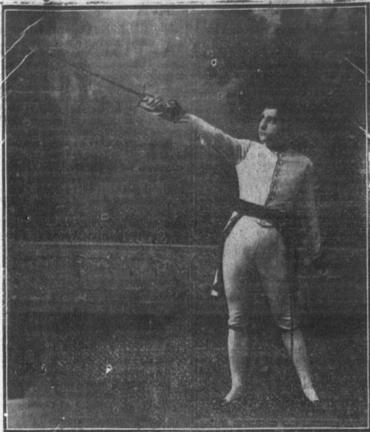
Fernando Díaz de Mendoza y Guerrero en «El Aguilucho»