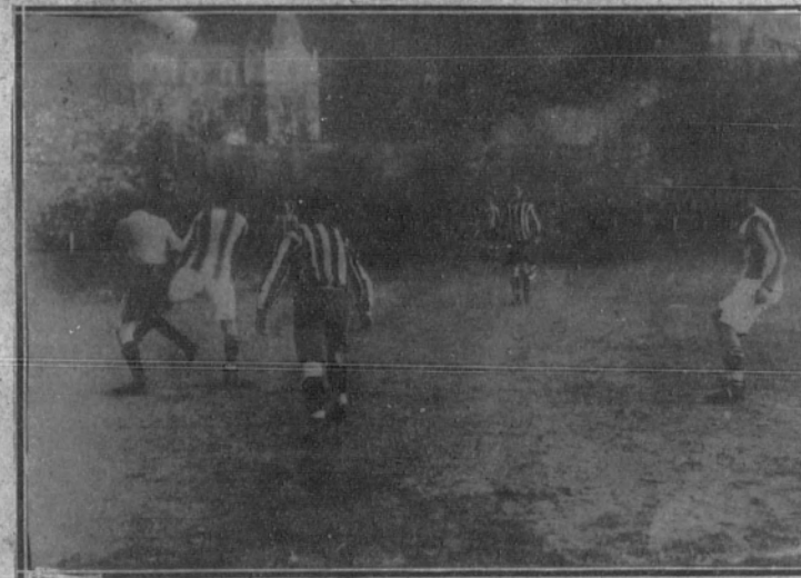
Dos fases del partido recientemente jugado entre el Athletic, de Bilbao, y la Real Sociedad, de San Sebastián.