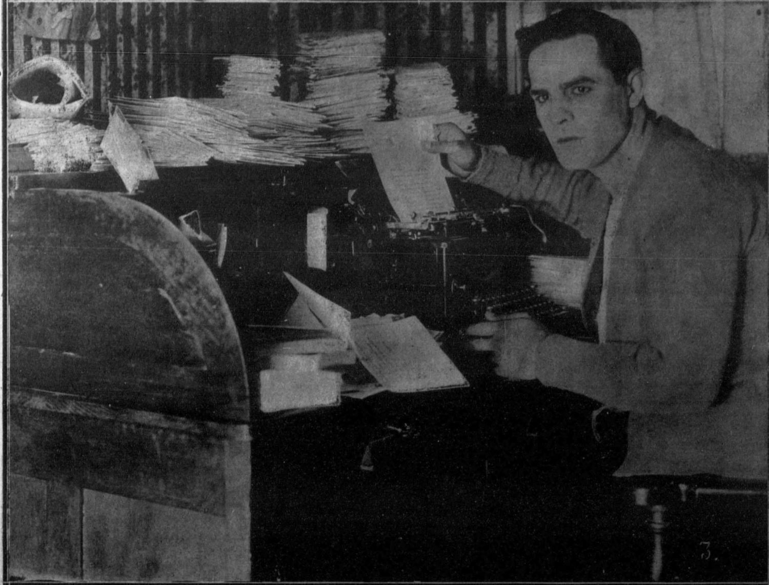
1. Lord Curzon, primer representante diplomático de la Gran Bretaña, después de la guerra, en Berlín.—2. La reeducación de los mutilados en Francia: Dos antiguos campesinos, amputados de la pierna izquierda, empleándose en la confección de alfombras.—3. Uno de los primeros actores cinematográficos, Antonio Moreno, el héroe de sensacionales películas, en su cuarto de trabajo. Moreno es madrileño, que emigró a los Estados Unidos hace quince años.