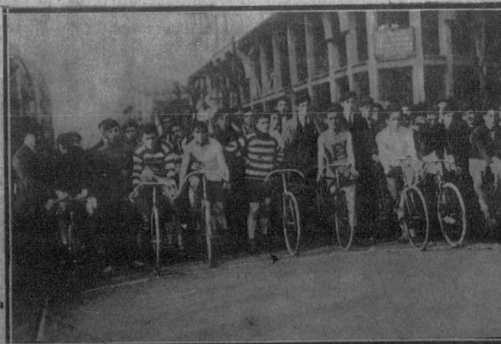
Salida de los corredores que tomaron parte en la carrera celebrada en San Sebastián por la Sociedad Oña.