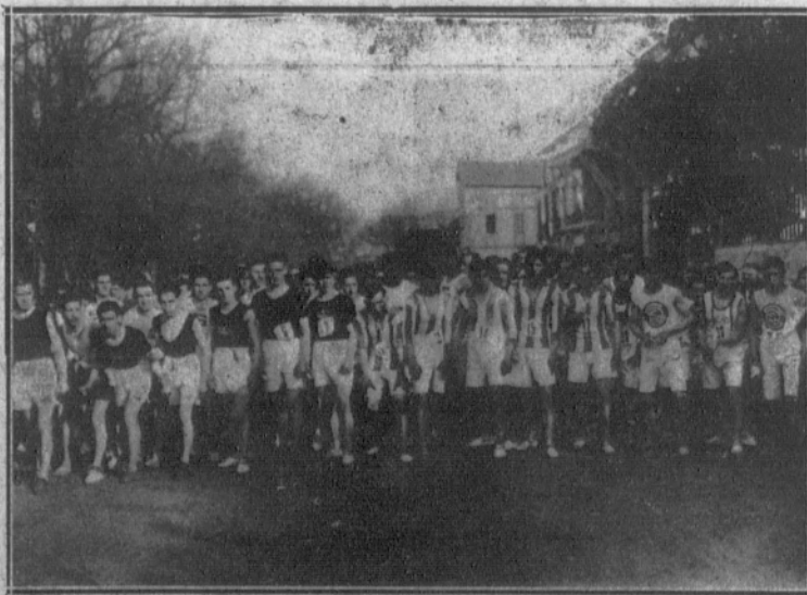
Salida de los corredores en la «cross» organizada por la Real Sociedad de San Sebastián.