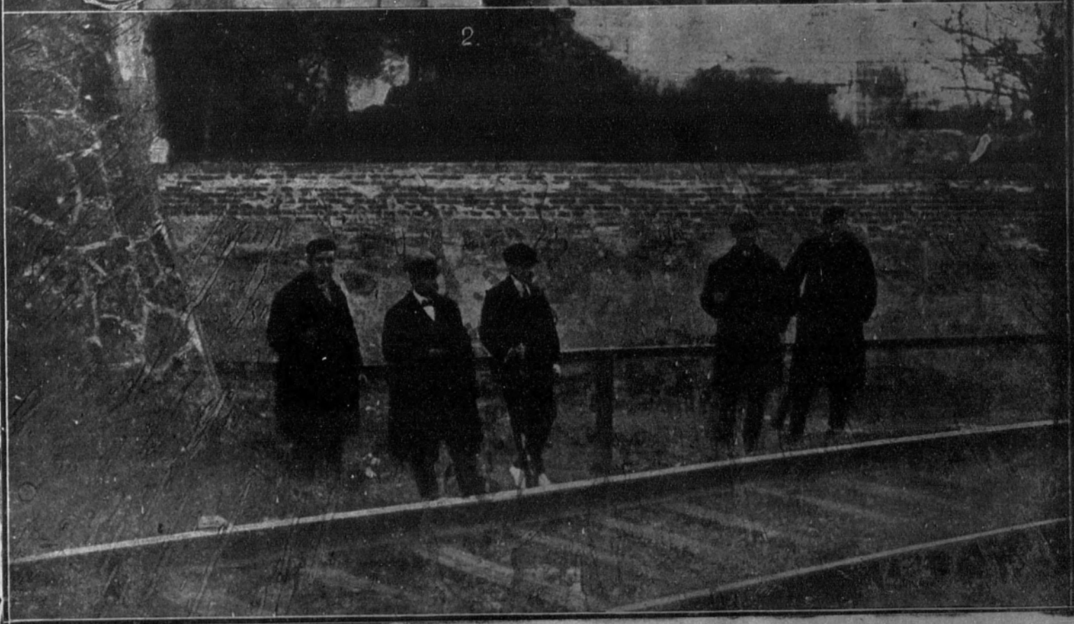
1. MADRID: Su Alteza Real el Infante D. Fernando saliendo de la iglesia del Buen Suceso, después de presidir la función religiosa que el Cuerpo Colegiado de la Noblez de Madrid celebró en honor de su Patrón San Ildefonso.—2. BARCELONA: El Soma en custodiando un puente del ferrocarril de Sarriá.