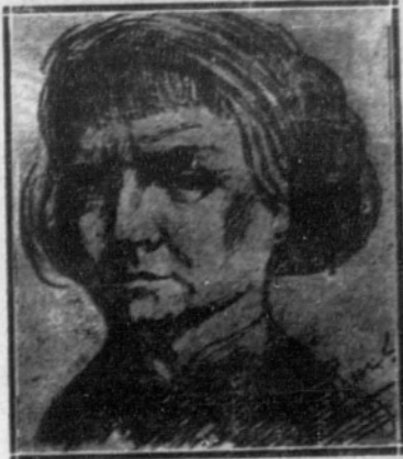
DOÑA CONCEPCION ARENAL

España entera rinde hoy homenaje a aquella ilustre polígrafa que se llamó doña Concepción Arenal. EL FIGARO,