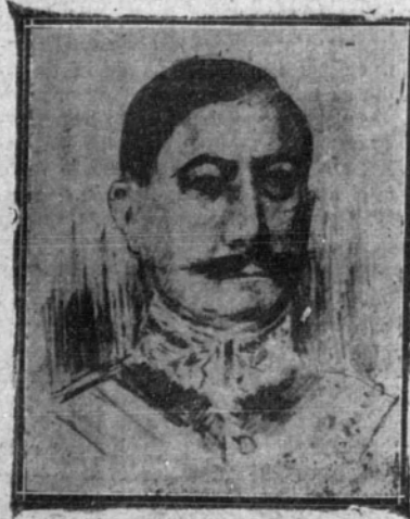
El general Berenguer

No se explica, ciertamente, el propósito de la elevación del obrero a los Consejos directivos de la producción, sin anatematizar un revolucionarismo violento que sólo podría instaurar sus doctrinas sobre un montón de ruinas. Es indudable que la colaboración de quienes represen-