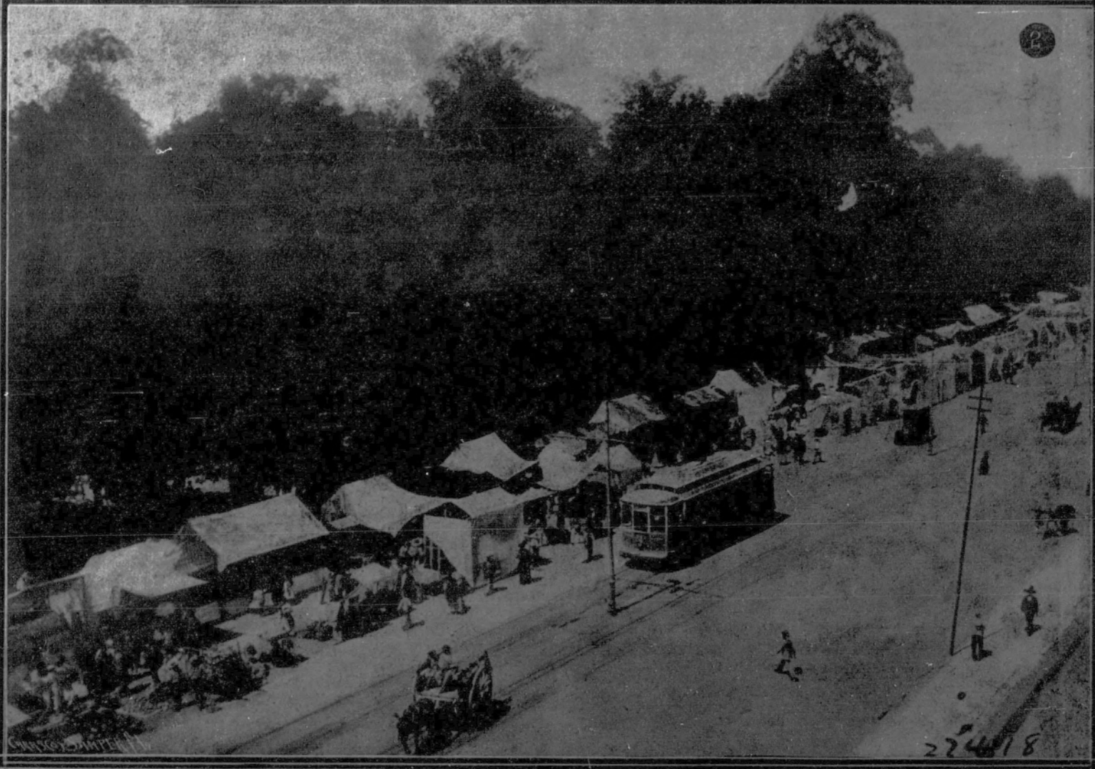
durante las fiestas de Navidad se celebraron en Méjico (City) importantes fiestas y cuestaciones a favor de la Cruz Roja mejicana.—1. Un aspecto de la «kermesse» celebrada en la residencia del general Carranza, presidente de la República.—2. Feria celebrada en una de las avenidas de la capital a beneficio de la Cruz Roja.