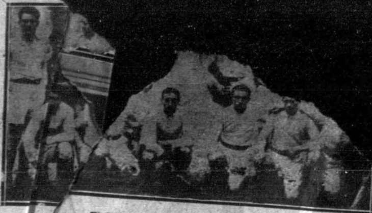
El Racing Club, nuevo campeón de París.

Señor presidente de la Real Unión Deportiva F. C. de Orense.»