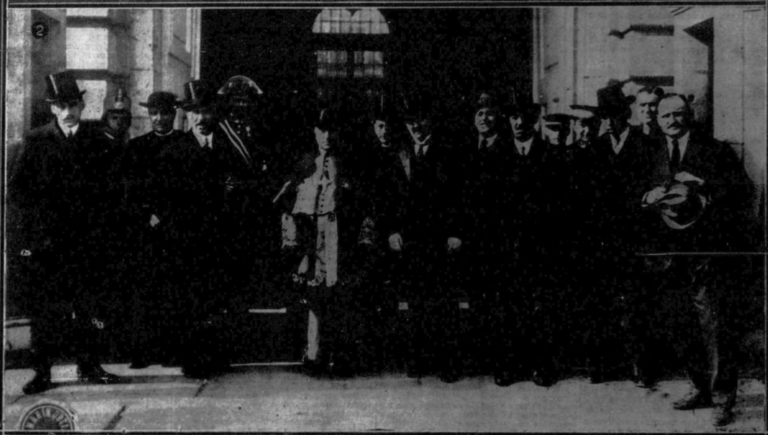
1. El regimiento del Rey desfilando ante el Palacio Real, a su regreso de Leganés.—2. El obispo, gobernador y alcalde de Segovia con representaciones obreras que han entregado al Monarca un mensaje de adhesión.