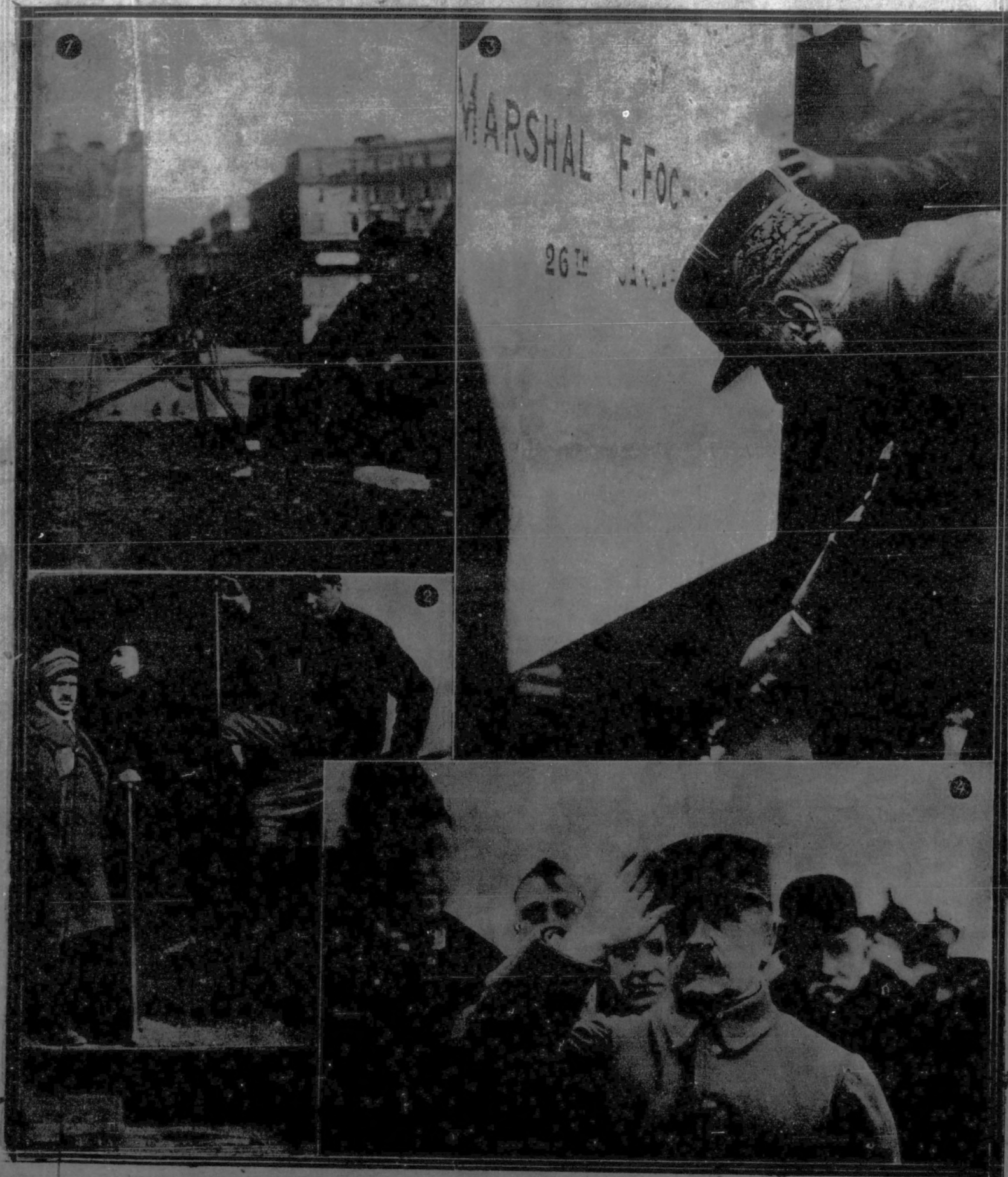
De la última huelga ferroviaria de Italia: 1. Soldado con ametralladora guardando un puente.—2. Locomotora conducida por soldados y guardada por agentes de Policía armados.—El mariscal Foch ha asistido recientemente en Cap Blanc-Nez (cerca de Calais) a una ceremonia en honor de los héroes de la guerra submarina: 1. Colocación de la primera piedra del monumento.—2. El mariscal Foch saluda militarmente al tocar la orquesta los himnos nacionales de Francia e Inglaterra.