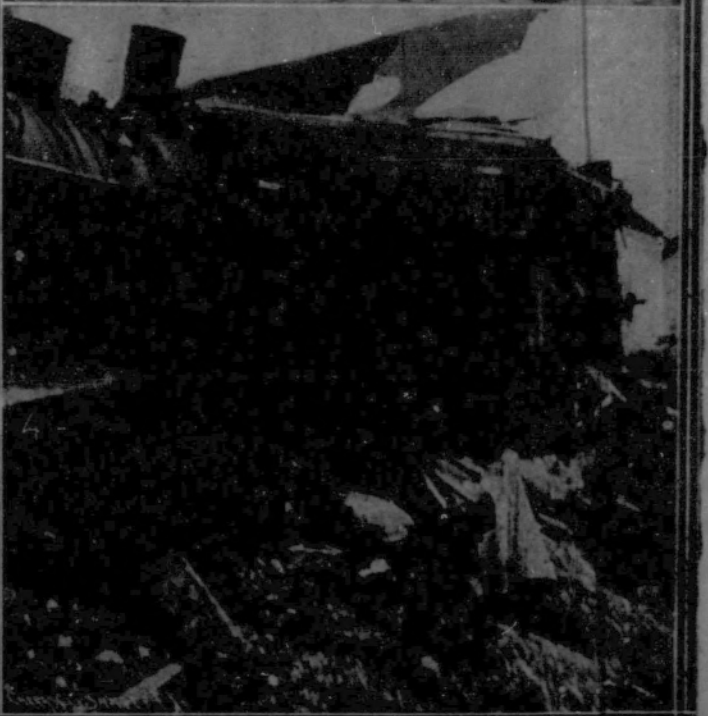
1. La crisis de las viviendas obliga a algunas familias a utilizar como habitación los grandes vagones de transporte.—2, 3 y 4. Un terrible accidente ferroviario: Varios aspectos del estado en que quedaron los trenes después del choque entre un convoy de mercancías y el expreso de Berlín a Königsberg, que costó la vida a más de cincuenta personas.