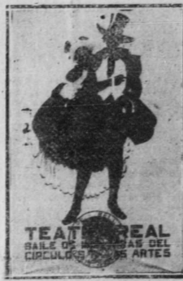
Cartel de Bartolozzi

Ahora, que hay maneras de ver que, por absurdas que parezcan, pueden ser toleradas en no profesionales, y que son inadmisibles en miembros de un Jurado, que, si no son profesionales, están obligados a pensar como si lo fueran. Si tanto