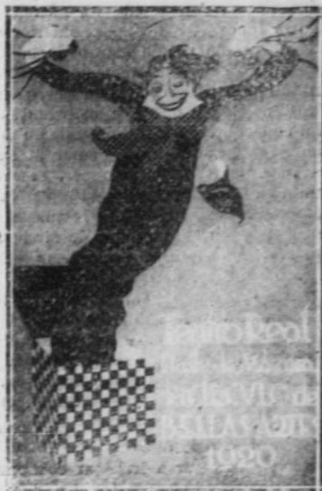
Cartel de Ribas

miedo se tiene a que digan que hay preferencias determinadas por tal o cual artista, y si se quiere, hacer de un fallo de Concurso algo así como una distribución de dulces a chicos pequeños, estaría mejor decidir de una vez el dar los premios por turno, y sin examinar siquiera las obras. Y ahora, independientemente de todo, no alcanzamos a comprender la decisión de poner la obra de Penagos fuera de concurso, después de haberlas ya