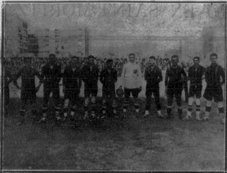
Los jugadores catalanes vencedores en los partidos contra la selección vasca.