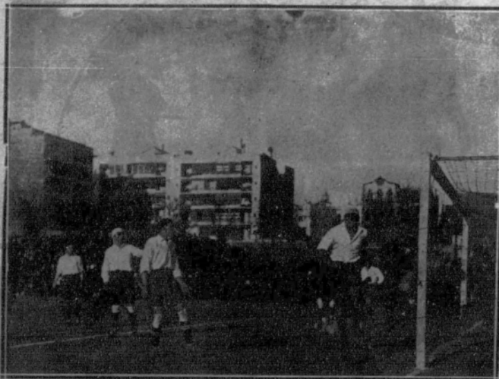
Una fase del primer partido Viscaya-Cataluña, celebrado en Barcelona.

A partir de este momento, y no obstante seguir el Sevilla con el equipo incompleto, se desanimaron los realistas grandemente, hasta que, dominados en los últimos momentos, dió el «referee» la final del partido.