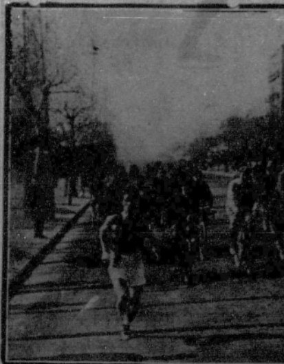
Calvet a su paso por la Diagonal, llegando el primero.