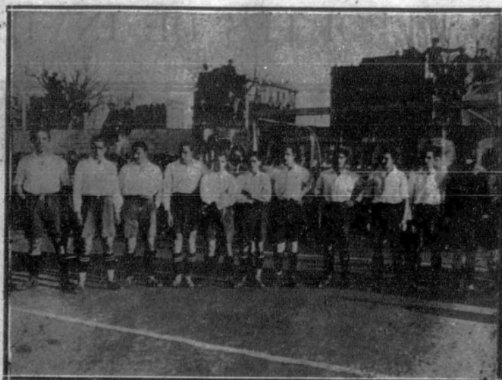
«Equipiera» que contendieron en los encuentros contra la selección catalana.