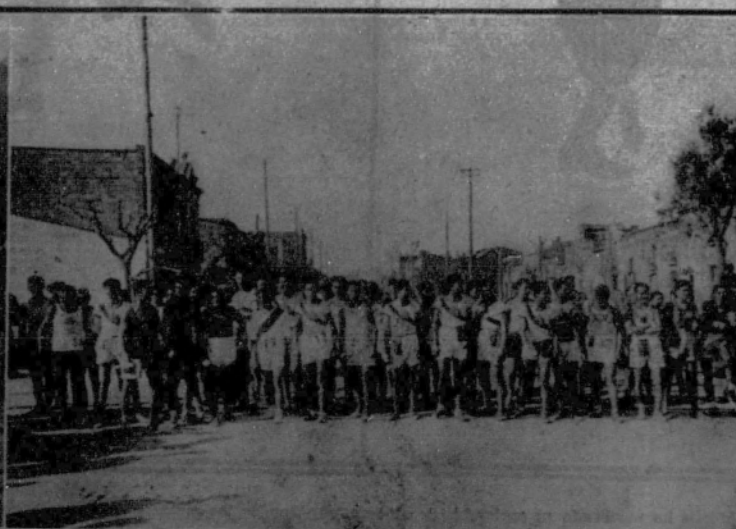
Los corredores que tomaron parte en la carrera «Jean Bovis», que se ha celebrado sobre un trayecto de 10 kilómetros.