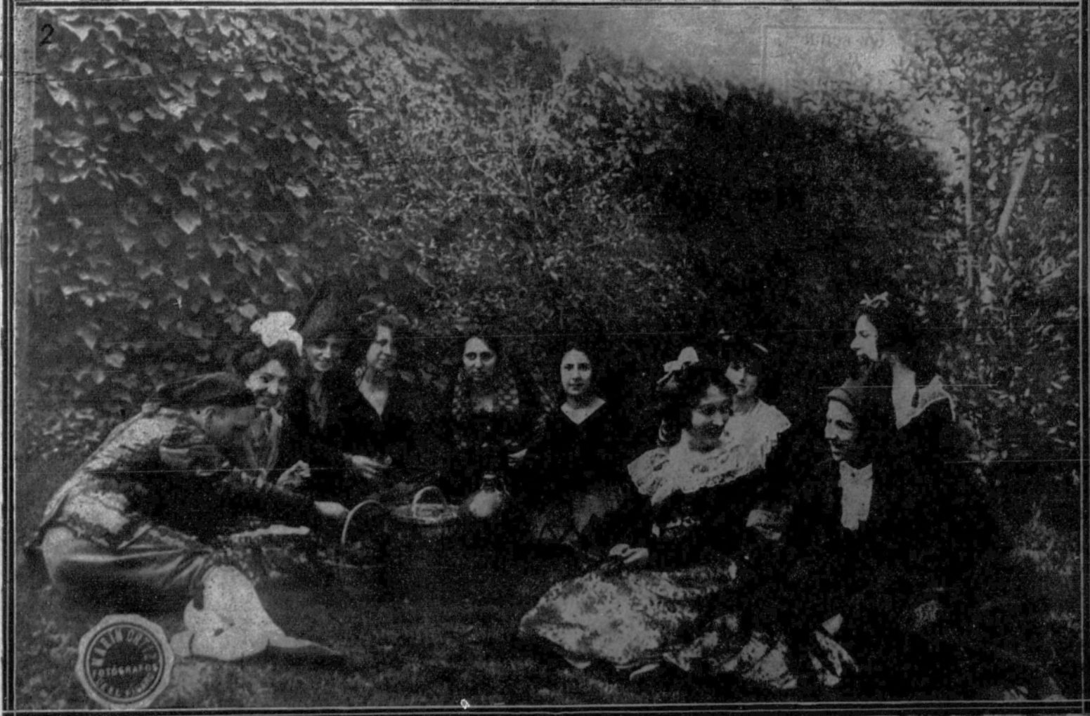
1. El general Tourné saliendo de Palacio, después de conferenciar con Su Majestad el Rey.—2. Uno de los cuadros («La merienda») del baile goyesco del teatro Real, reconstituido ayer en el estudio de Moreno Carbonero.