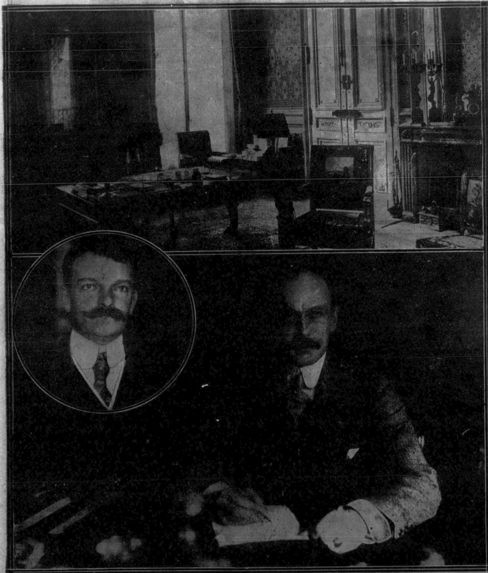
1. Despacho del presidente de la República, en el Palacio del Elíseo, que desde hoy ocupa M. Paul Deschanel.—2. Último retrato de M. Saint Aulaire, nuevo embajador de Francia en Madrid.—En el medallón, M. Raoul Peret, sucesor de Deschanel en la Presidencia de la Cámara francesa.