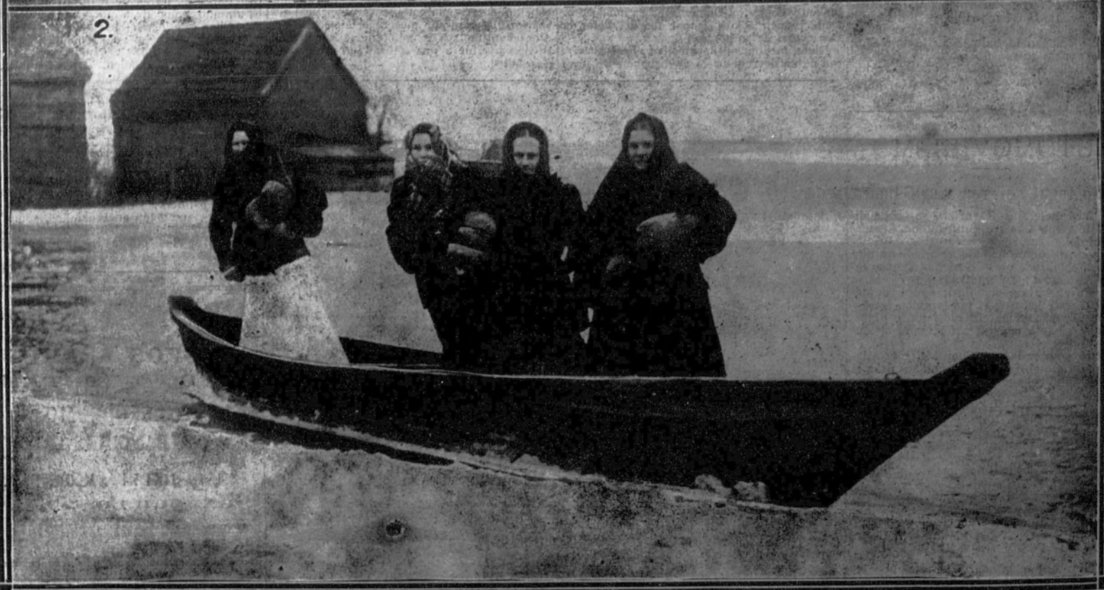
1. Hielos flotantes amontonados contra los pilares del puente de Landberg.—2. Mujeres del pueblo atravesando un río helado para ir a la compra de provisiones.