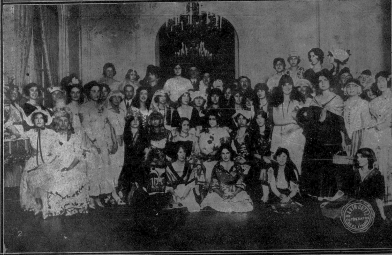
1. El nuevo ministro de Fomento, Sr. Ortúño, saliendo de Palacio con el presidente del Consejo, después de jurar el cargo.—2. Señoritas que asistieron ayer tarde al baile de máscaras dado en el palacio del duque de Toya.