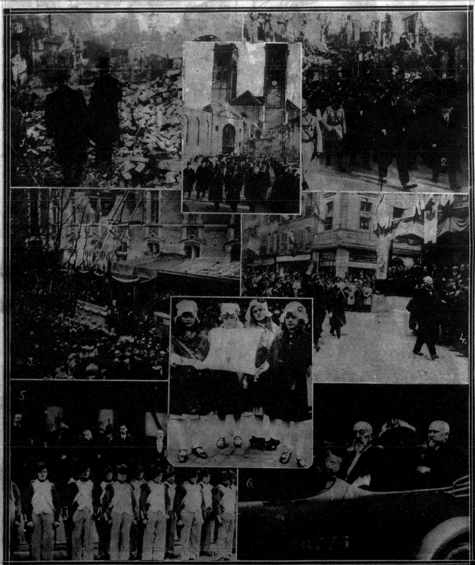
Antes de abandonar la Presidencia de la República, M. Poincaré hizo una visita oficial al departamento del Mosa para condecorar a las ciudades mártires de Verdun y Thionville.—1. M. Poincaré entre las ruinas de Verdun.—2. M. Poincaré, acompañado del ministro M. Maginot, dirigiéndose al lugar de la ceremonia oficial.—3. La tribuna de las autoridades durante el acto de la condecoración de Verdun.—4. THIONVILLE: La Guardia cívica luxemburguesa desfila ante la tribuna ocupada por M. Poincaré y la Gran Duquesa de Luxemburgo.—5. La Gran Duquesa de Luxemburgo, M. Poincaré y M. Maginot en la tribuna oficial.—6. La Gran Duquesa de Luxemburgo y M. Poincaré en su automóvil, después de la ceremonia de la condecoración de Thionville. En el centro, la catedral arruinada de Verdun y un grupo de niñas de Thionville sosteniendo el almohadón con la cruz de la Legión de Honor.