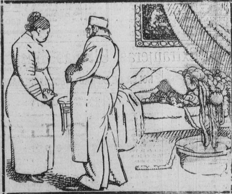
(Dibujos de «Apa».)