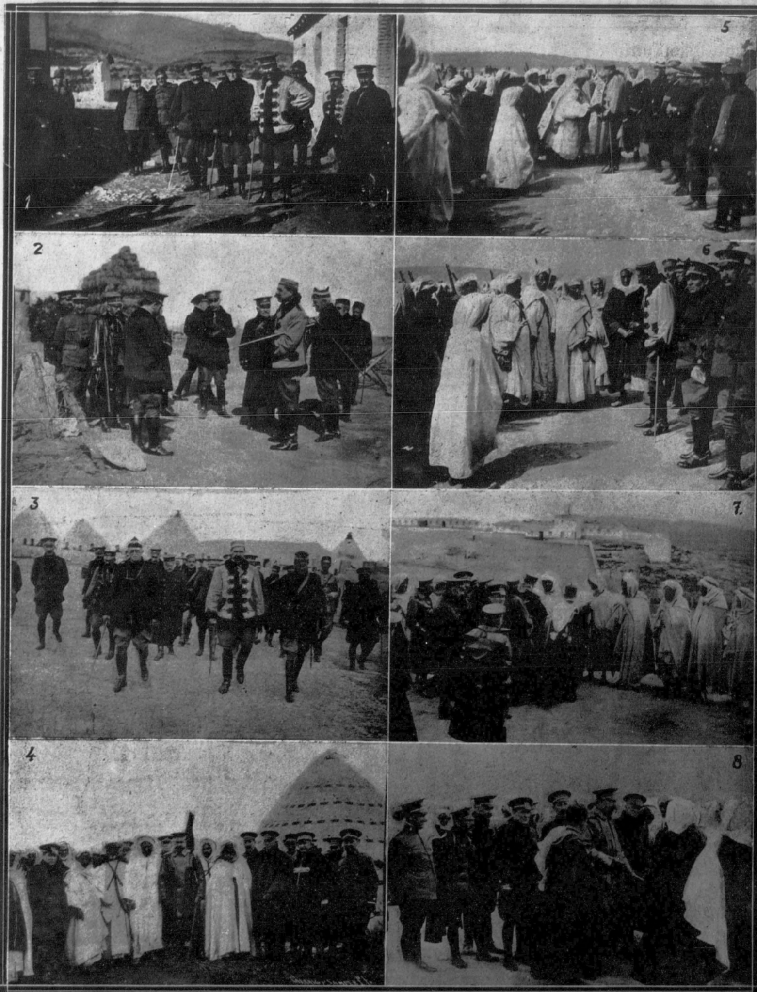
El general Silvestre, acompañado de sus ayudantes, ha visitado recientemente las posiciones que habrán de utilizarse en las futuras operaciones.—1. Los generales Silvestre, Monteverde y coronel Sánchez Monje, visitando la posición de Segai.—2. El general Silvestre saliendo de visitar la posición de Tizingar.—3. Los generales Silvestre y Monteverde, después de visitar la posición del Dragón, próxima al Monte Mauro, donde se han de efectuar operaciones.—4. El general Silvestre con el caid Ben-Chelas y otros prestigiosos moros que le ofrecieron un té bajo una tienda de campaña en el camino del Monte Arruit.—5. Los jefes de la cabila de Beni-Said prestando su misión al general Silvestre.—6. El general Silvestre dirigiendo la palabra a los jefes de la cabila de Beni-Said.—7 y 8. Los jefes de la cabila de Ulad-Setut saludando al general Silvestre.