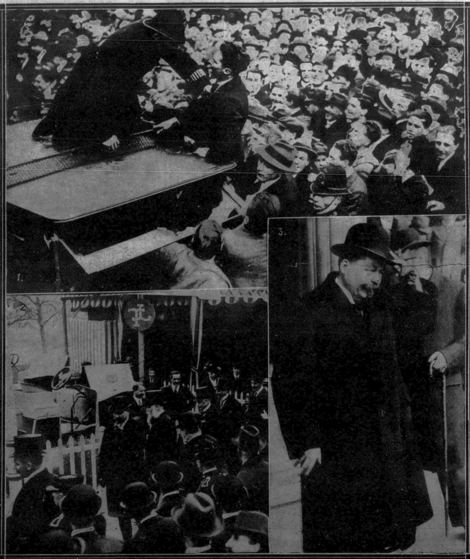
1. Una escena de la manifestación de entusiasmo con que fué recibido el jefe del partido liberal, Mr. Asquith, al regresar a Londres después de su triunfo en Paisley.—2. Monsieur Deschanel inaugura la Exposición de aparatos de motocultura en París.—3. El presidente del Imperio alemán, Hebert, fotografiado recientemente en las calles de Berlín.