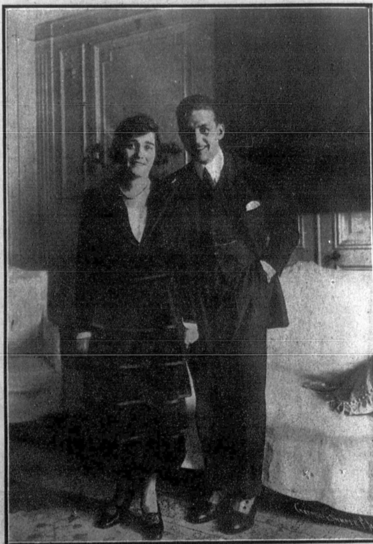
Carpentier y su esposa, cuyo matrimonio se celebró el 8 de marzo en París.

Quinto. Sportivo Tolosano: 1-12-24-29-35: 101 puntos. Sexto. C. D. Luchana: 11-16-31-41-42: 141 puntos. Séptimo. C. D. Sartako: 19-26-34-37-38: 154 puntos.