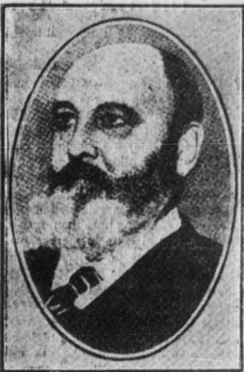
El insigne ingeniero español Sr. Torres Quevedo.

La Academia de la Lengua Española considera que la vacante que ha dejado Galdós no puede cubrirla ningún escritor contemporáneo. En cambio, le parece indicado D. Leonardo de Torres Quevedo para tal nombramiento. Puede