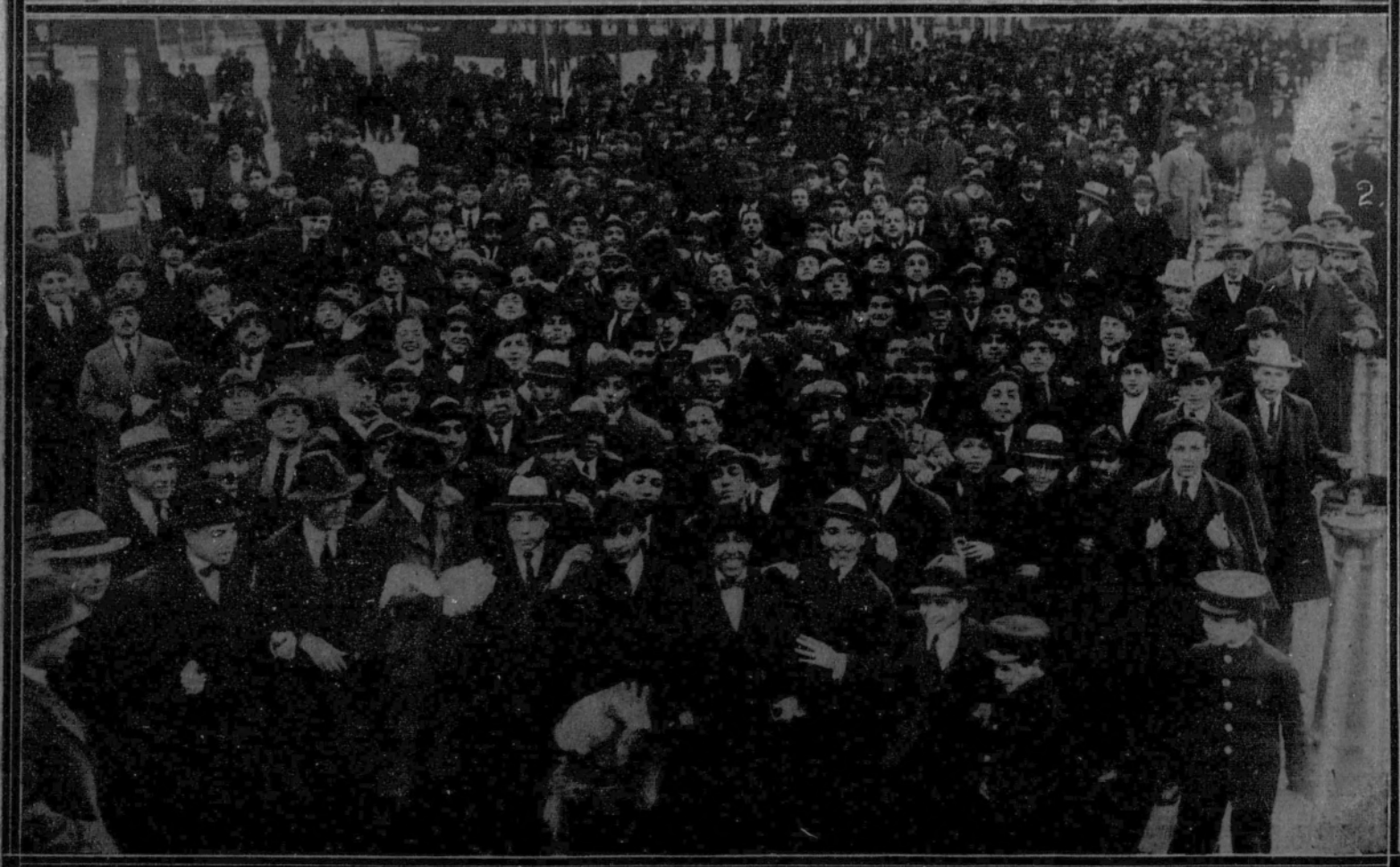
1. El Jurado viendo los proyectos presentados al concurso para la construcción del nuevo edificio del Círculo de Bellas Artes.—2. La manifestación estudiantil para protestar contra las oposiciones de la cátedra de Patología médica.