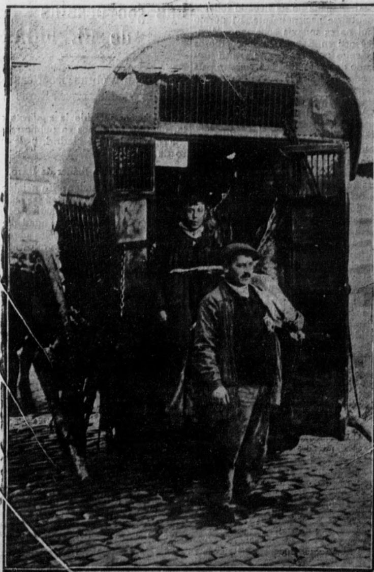
Las carnes descansan sobre las ropas, cubiertas de grasa y sangre, en un olvido absoluto de la higiene.

La llegada del carro de la carne se anuncia al transeúnte, no solamente por el enorme ruido que producen sus enor-