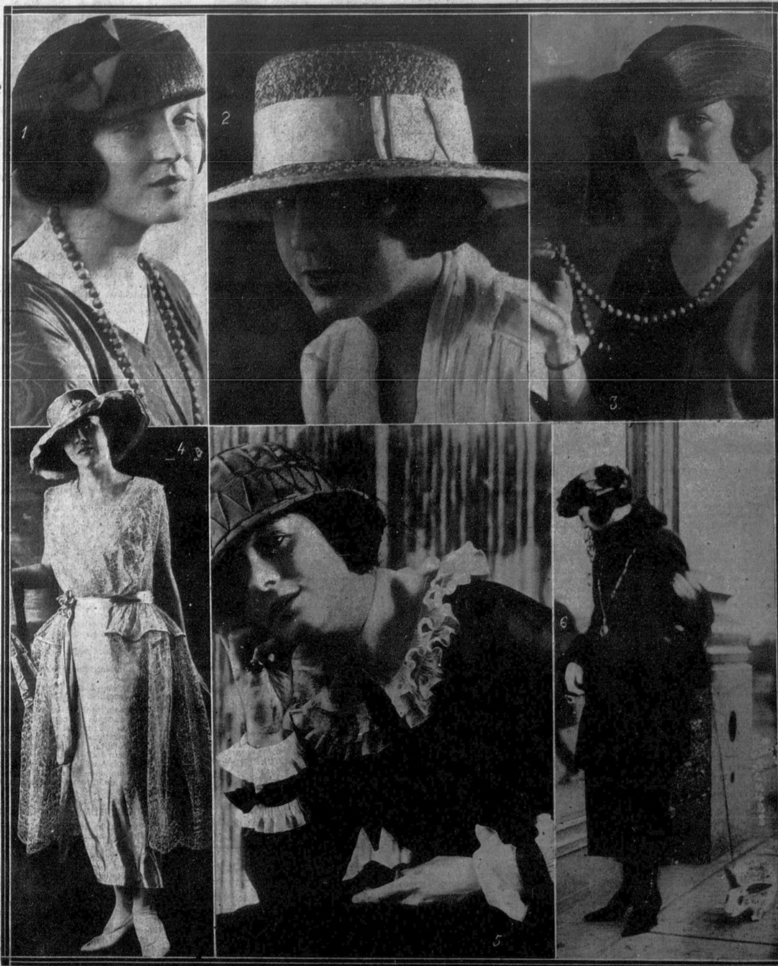
1, 2 y 3. Modelos de sombreros de paja.—4. Sombrero y vestido de encaje.—5. Blusa de raso negro con cuello y puños de batista blanca.—6. La moda excéntrica: algunas elegantes de Chicago han sustituido los perros falderos por conejos de India.