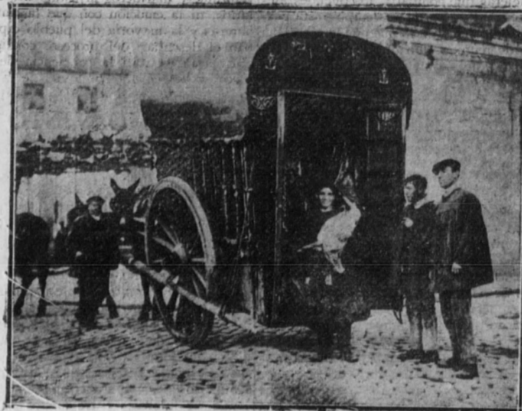
Es un vehículo sucio y mal oliente, impropio de una ciudad europea que tenga bien organizados los servicios públicos.

Este carro de la carne que se usa en Madrid es, más que conductor de un artículo alimenticio de tan imprescindible necesidad, vehículo de suciedad, en el que encuentran los microbios fácil y cordial acogida para desarrollarse a voluntad. No hay nada que pueda compararse a estos carros en falta de limpieza. En ellos se hacinan las carnes contra las pingosas paredes, colgadas a la ligera en unos ganchos mohosos, golpeadas y zarandeadas sin piedad por el traqueteo de la marcha. Las más de las veces, cuando hay exceso de carga, cuelgan de las puertas abiertas grandes cuartos de vaca o corderos enteros, que van recibiendo durante el trayecto todas las basuras que hay en las calles y todos los golpes y encontronazos con los demás carros.