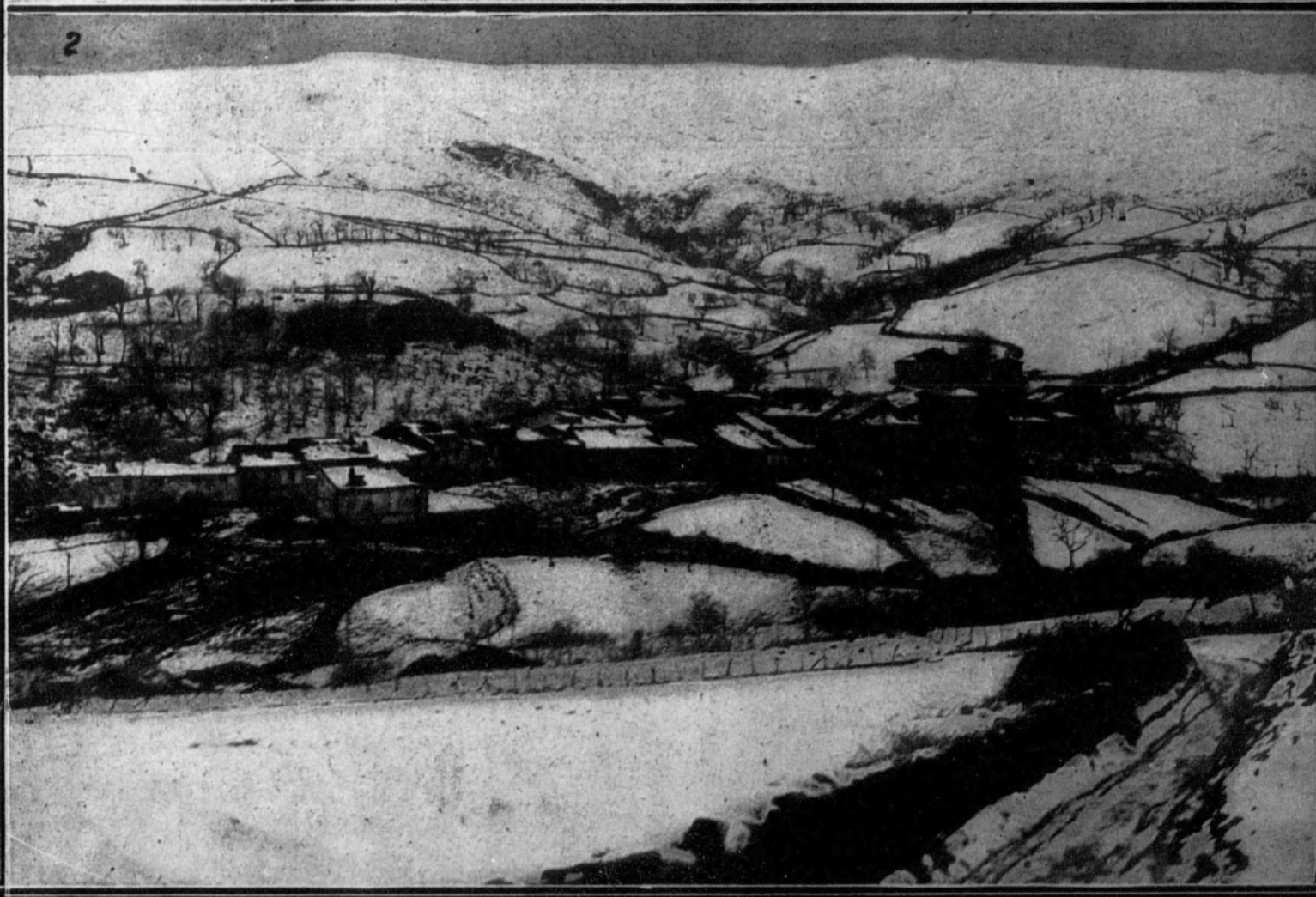
1. El ganado lanar descendiendo del puerto al valle en busca de pastos.—2. Aspecto que ofrece el pueblo de Boriño, después de la nevada.