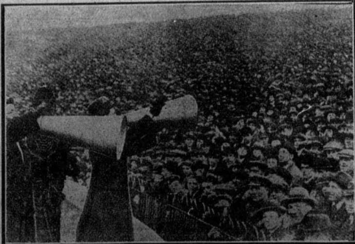
El público, compuesto por más de 50.000 espectadores, escuchando la composición de los equipos, antes de un partido.