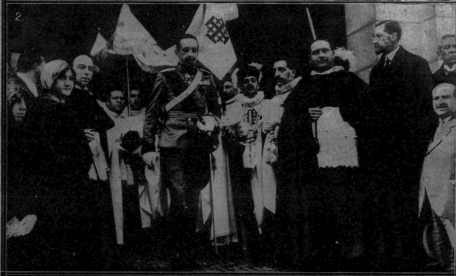
1. Los caballeros del Santo Sepulcro con el estandarte de Caballería, después del acto de su bendición.—2. Su Majestad el Rey al salir de la bendición del estandarte de Caballería de la Orden del Santo Sepulcro.