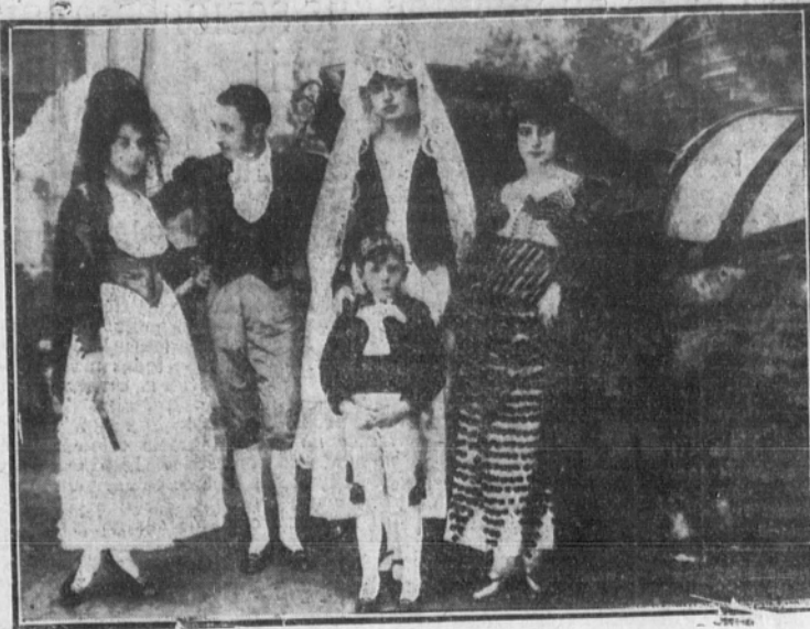
Señoritas y jóvenes de la buena sociedad que representaron el cuadro de «La Calesa», en la fiesta aristocrática celebrada anoche a beneficio de la Cruz Roja.

SS. MM. y AA. asisten a la función de la Cruz Roja