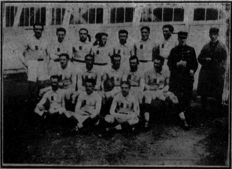
1. Equipo militar inglés.—2. M. Deschanel, presidente de la República, felicitando a los «equipers» franceses.—3. Una fase del «match» de «rugby» jugado entre estas dos selecciones militares.—4. Equipo de la representación francesa, que obtuvo una brillante victoria.