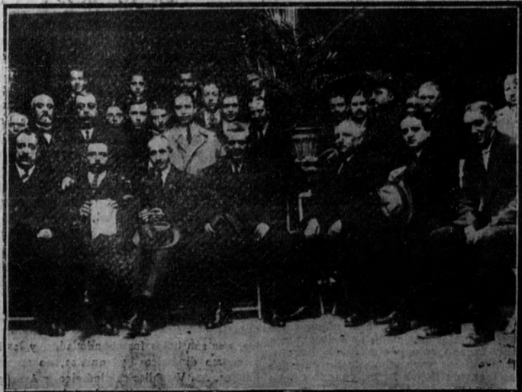
Asamblea de hermanos de V. O. T. de San Francisco, celebrada el domingo por la mañana.