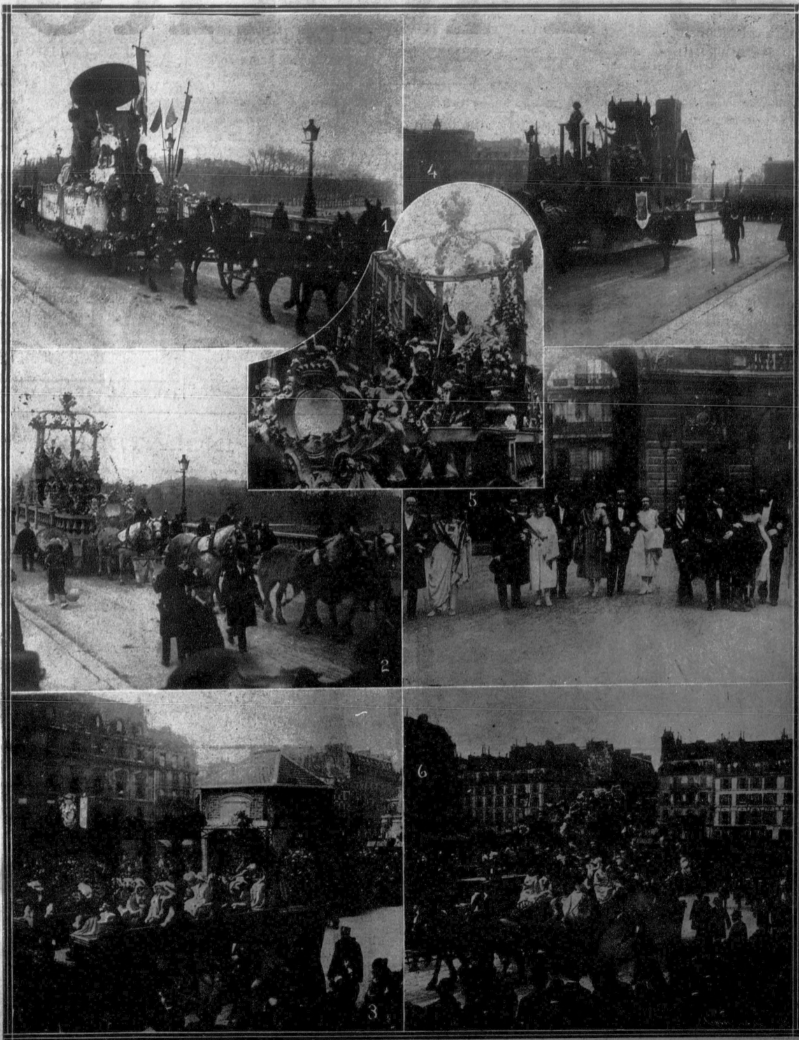
Por primera vez después de la guerra se ha verificado en París la tradicional fiesta de la «Mi-Careme».—1. La carroza de la alimentación.—2. La carroza de la reina de las reinas. 3. La carroza de la reina de Metz.—4. La carroza del viejo París de los estudiantes, pasando por el puente de la Concordia.—5. Las reinas recibidas en el Palacio del Eliseo, residencia del presidente de la República.—6. La carroza de la reina de las modistas de Italia.—7. La reina de las reinas paseando en su carroza triunfal.