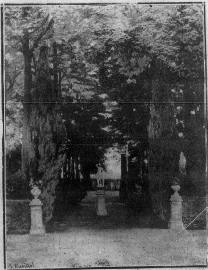
Jardín de Aranjuez.