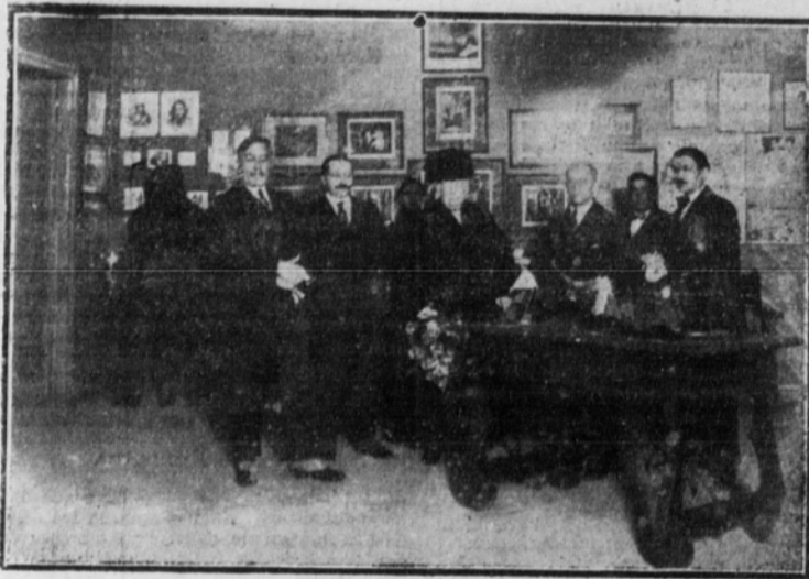
Su Alteza Real la Infanta Isabel durante la visita que hizo ayer tarde a la Exposición de hurr. ristas.