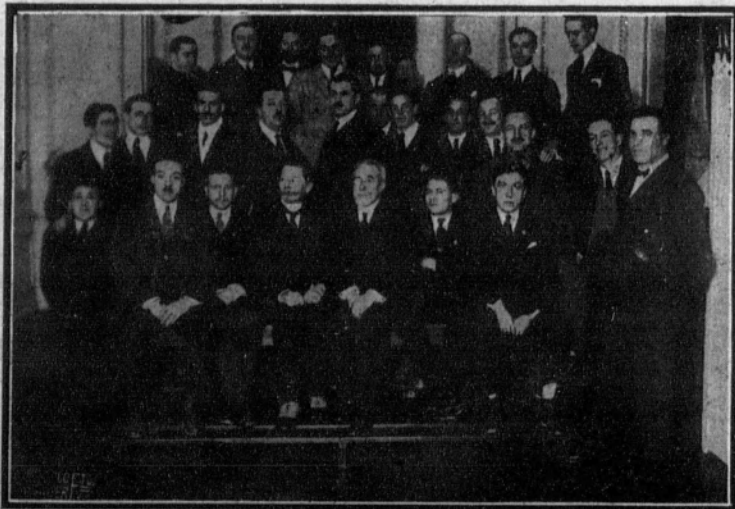
Concurrentes a «champagne» de honor ofrecido a los corredores franceses que participaron en la prueba.