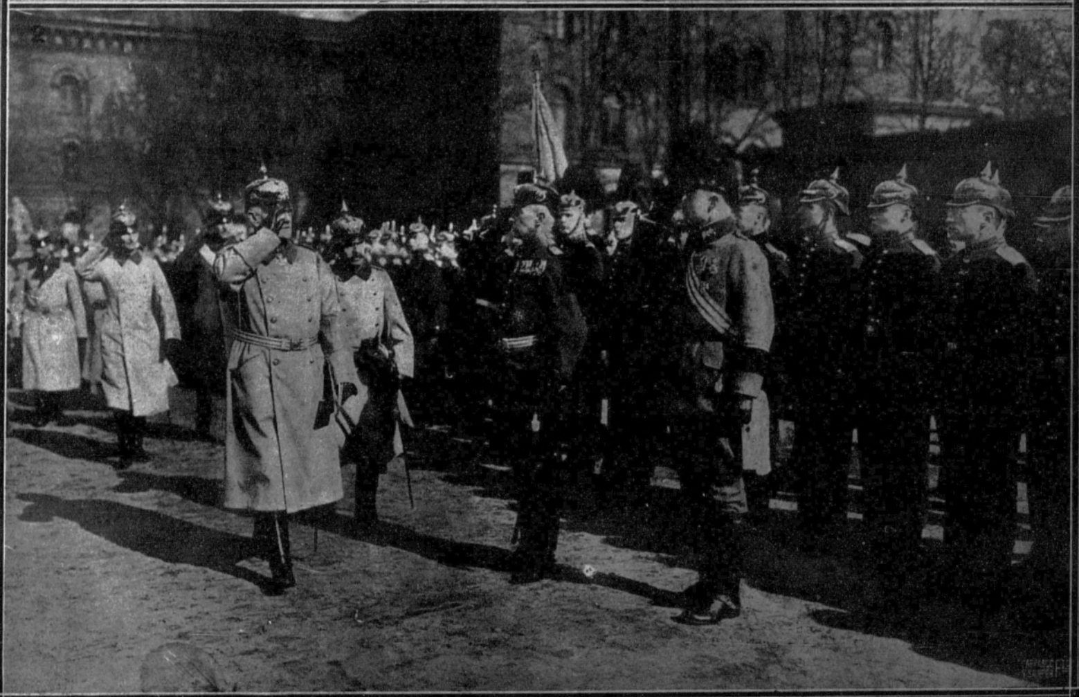
El general Ludendorff, de regreso a Alemania, pasó revista recientemente a los alumnos de la Escuela de Cadetes de Berlín, donde hizo sus estudios militares.—1 y 2. Dos momentos de la ceremonia.