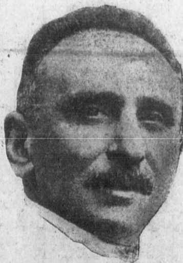
D. Melquiades Alvarez.

Para ningún observador de las cosas políticas puede pasar inadvertido en estos momentos un hecho en cierto modo extraordinario. En el espacio de unas pocas semanas el ambiente de expectación formado en espera de la próxima crisis y de su desenlace ha sufrido un cambio total. Los profetas han vuelto la