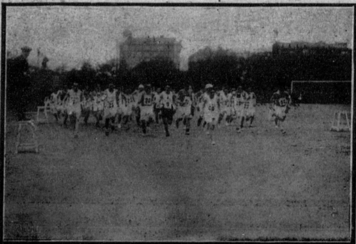
Salida de los corredores.