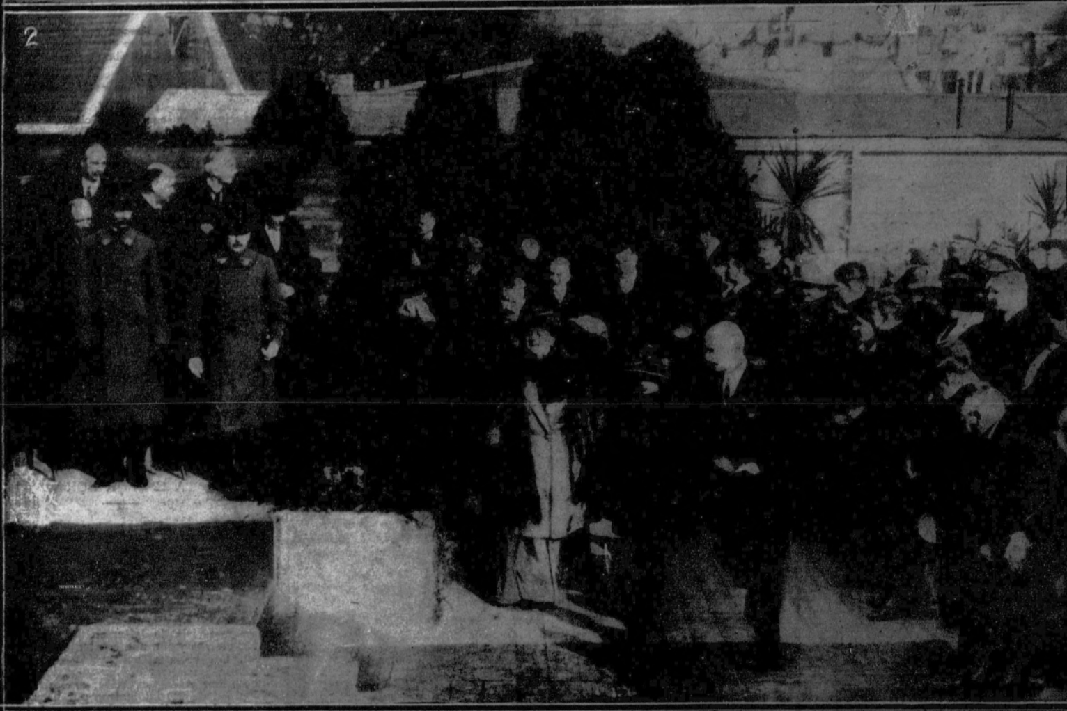
1. El equipo de Oxford conduciendo a la playa la canoa para las regatas. — 2. La Reina Guillermina de Holanda y la Princesa Juliana a su llegada a Utrecht para colocar la primera piedra de un edificio destinado a Exposiciones.