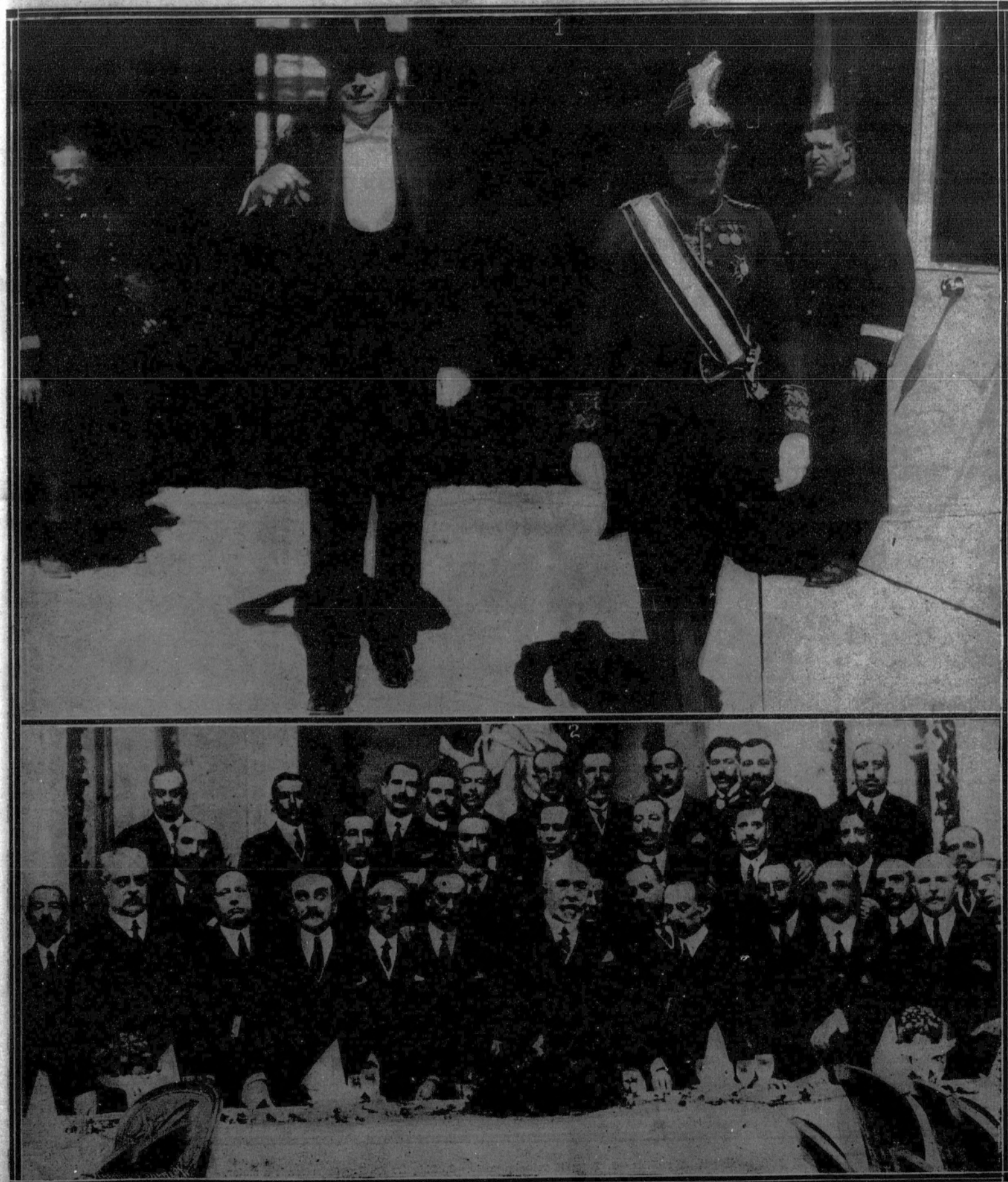
1. El nuevo ministro de Polonia, Sr. Ladislao Skorsynski, saliendo de Palacio, después de presentar sus cartas credenciales a Su Majestad el Rey.—2. Banquete con que sus amigos obsequiaron al Sr. Cierva en el Hotel Ritz, con motivo de su intervención parlamentaria en la discusión de las tarifas ferroviarias.