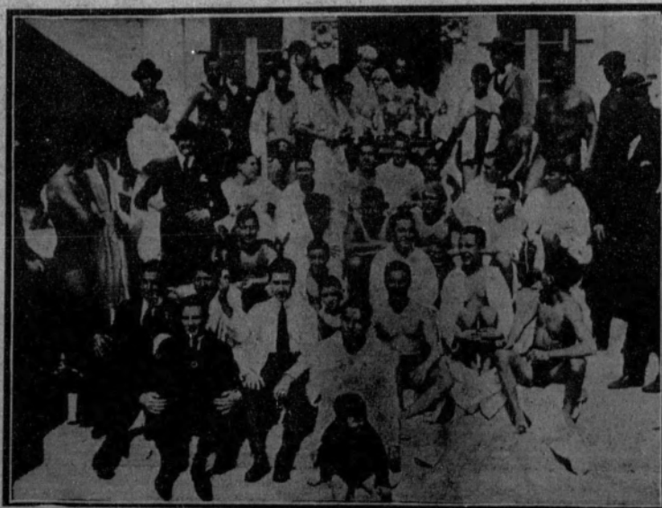
Reparto de premios en el Club de Natación, de Barcelona, a los socios vencedores en las pruebas de la temporada.