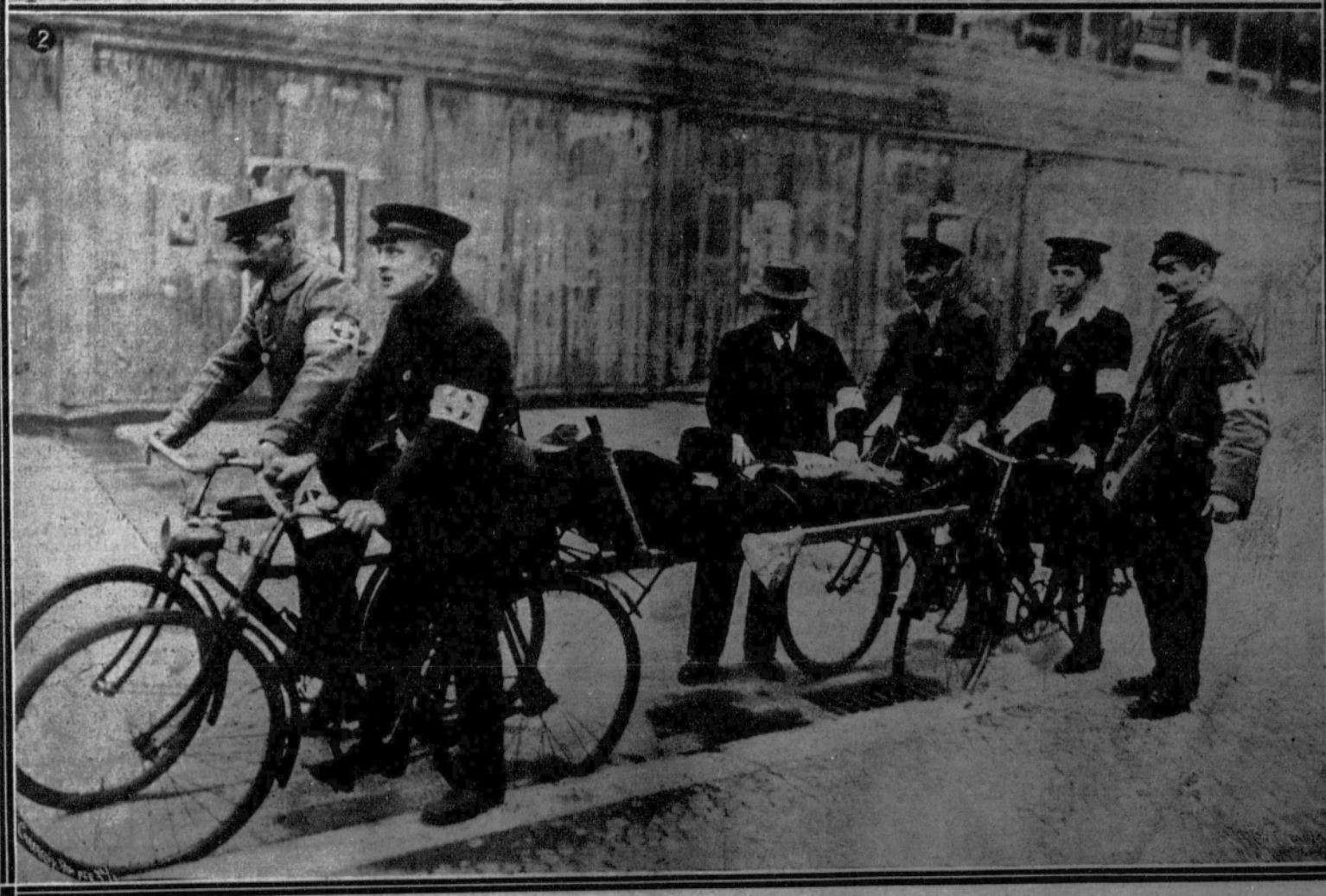
1. Mujeres de la Cruz Roja curando a un herido.—2. Enfermeros que han convertido en camilla sus bicicletas.