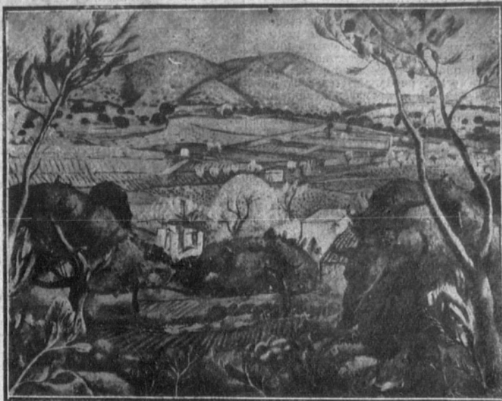
Paisaje de Sitges, cuadro de Joaquín Sunyer.