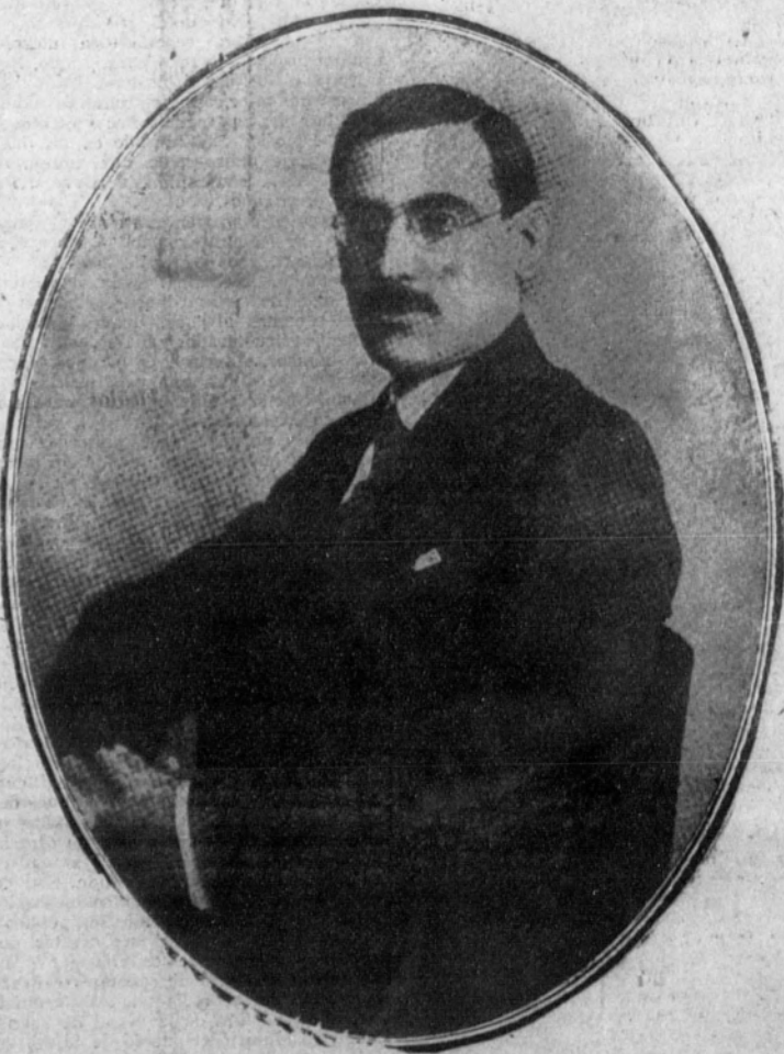
A. Rovira y Virgili.

fector, todos los momentos alternativos, conjuntivos y disyuntivos de la vida de este núcleo vital que es Cataluña. Intentar el conocimiento de lo que es, significa y representa el movimiento catalán prescindiendo de la lectura de los libros de este escritor, equivale a