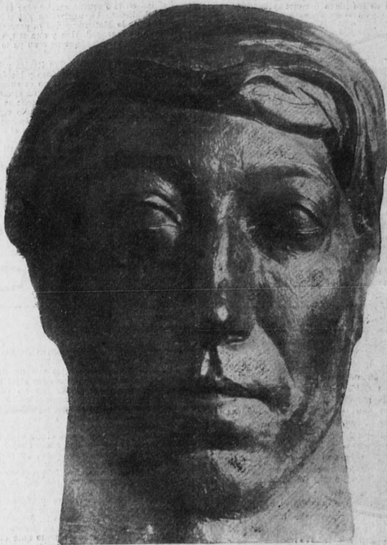
Retrato de Joaquín Sunyer, por Manuel Hugué.

Va ganando terreno en la valorización de la obra del catalanísimo pintor Sunyer el problema verdadero y genuino de todo esfuerzo artístico, que es el de su substancia, el de la aquilatación del matiz que dicha obra aporta a la revelación variada del ritmo único y grande de la creación. Los complejos problemas de la técnica singular han debido dejar paso, por razón de la bondad inicial de la obra y de la sincera personalidad del artista, a motivaciones más esenciales. Por esto, en 1911, un genial incompetente, Juan Maragall, con su genérico utilaje estético, pudo exprimir todo el jugo del famoso cuadro «Pastoral». Por esta misma razón, en 1912, un agudísimo profesional de la crítica, José María Junoy, captó de manera más esterilizada, más clara y estrictamente, pero con idéntico vaho de humanidad, aquel jugo que exprimió Maragall.