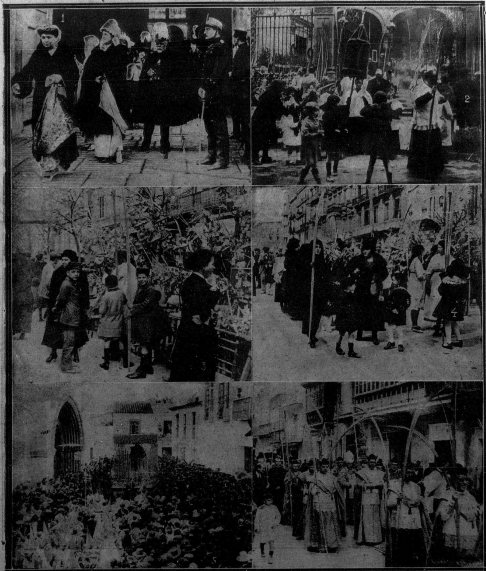
1. MADRID: Grandes de España al salir de Palacio, después de asistir a la capilla pública.—2. La procesión del Domingo de Ramos saliendo de la iglesia de San Cés. 3 y 4. BARCELONA: La feria de las flores en la Rambla.—5. SEVILLA: Nuestra Señora de la Hiniesta sacada procesionalmente de la parroquia de San Julián.—6. La tradicional procesión de las Palmas por los alrededores de la catedral.