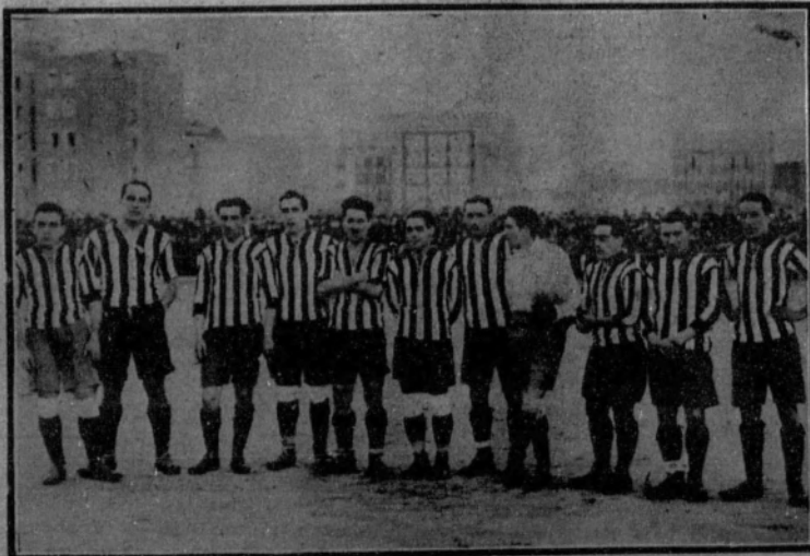
El equipo del Athletic Club, de Bilbao, que empató con el Madrid.

De ser esto cierto, y aunque el accidente sufrido por los dos lesionados puede influir mucho, hay todavía fundamento para esperar que el Irún se presente en Barcelona grandemente reforzado.