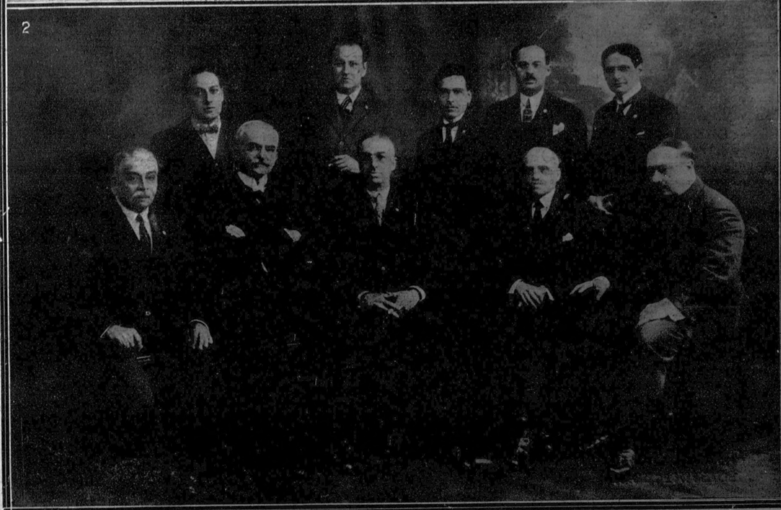
En Ginebra acaba de celebrar su primera reunión, después de la guerra, el Comité Internacional de la Cruz Roja.—1. M. Gustave Ador, presidente del Comité Internacional y ex presidente de la Confederación Helvética.—2. Grupo de los delegados españoles, portugueses y sudamericanos.