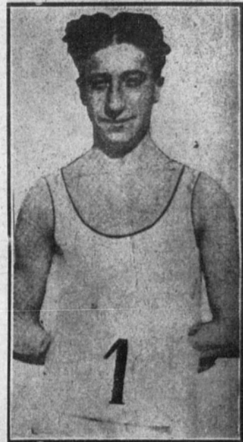
Julio Domínguez, el nuevo campeón de España para 1920, que ha alcanzado el último domingo en Bilbao una de las mayores victorias deportivas.