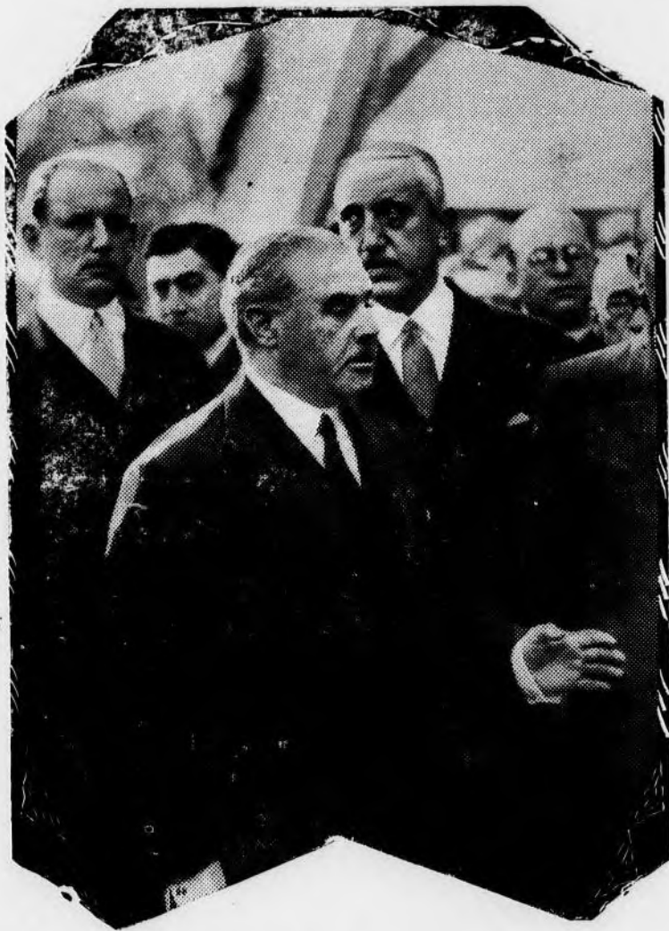
El conde de Guadalhorce pronunciando el discurso inaugural en nombre del consorcio español que forma la C. H. A. D. O. P. Y. F.

labor de auténtica reconstrucción nacional realizada al frente del ministerio de Fomento.