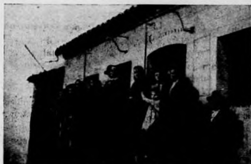
Otro ejemplo de Gabriel y Galán en su improvisación poética.