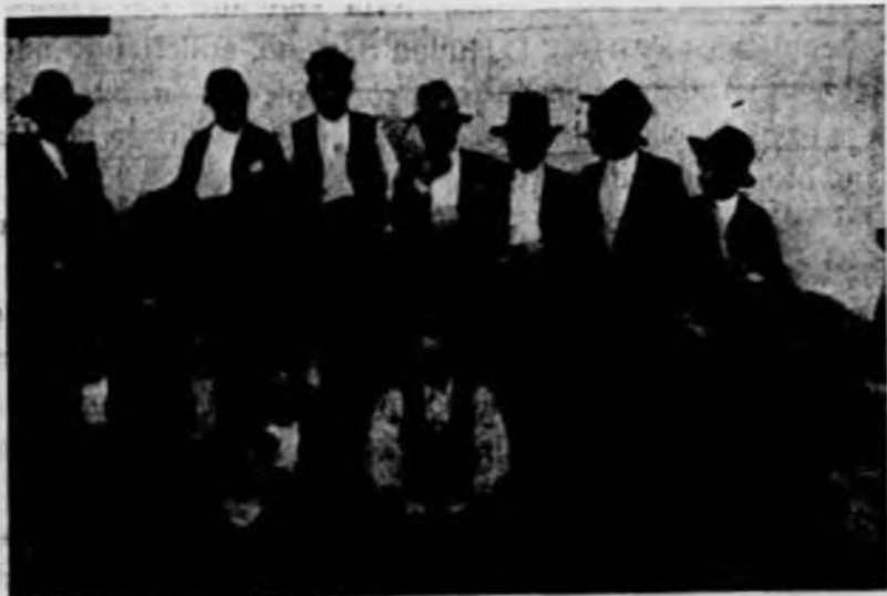
La simpática «batería» musical de Cerezo.