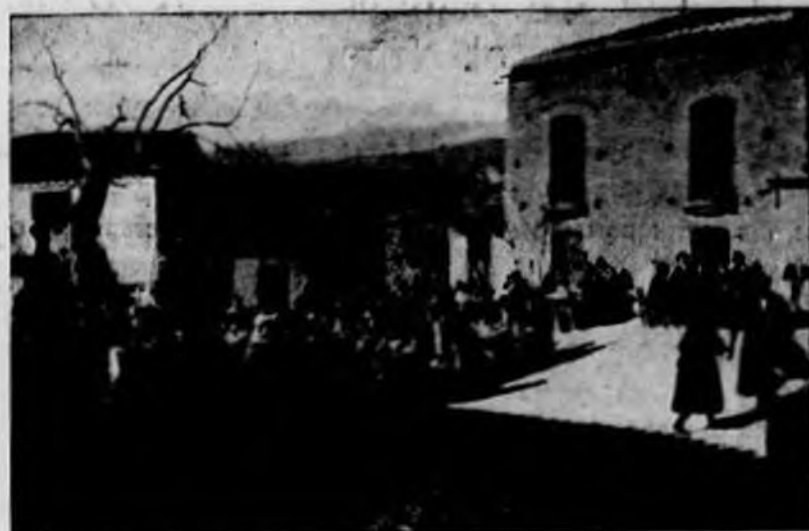
El yantar de un pueblo honrado

Hace una historia retrospectiva de la política en general y