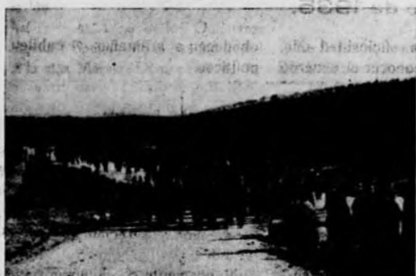
La columna en marcha.