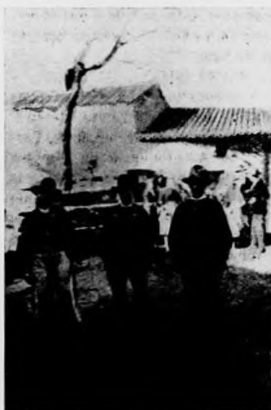
El sacristán y dos amigos Poetas los tres.

Este pueblo (extraordinario entre los contados que se pueden citar) y que procede con un orden y cálculo poco común, se dispone a yantar. Cada cual viene provisto a la plaza de algo. Quien con una mesita; quien con las sillas necesarias y otros con el mantel, cubiertos y copas; y en breves instantes la plaza del pueblo