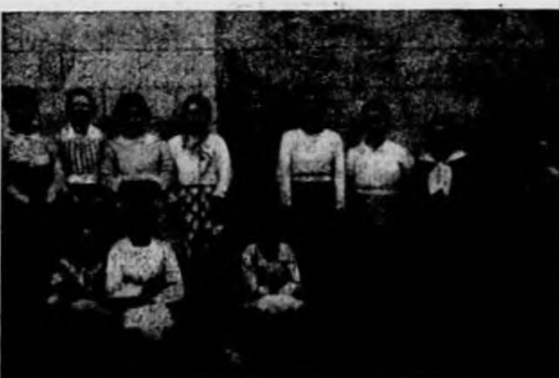
El coro de voces que dirige el sacristán.