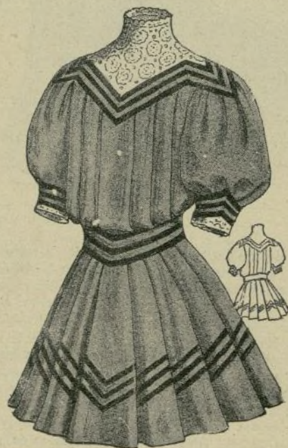
16.—Vestido sencillo para niña