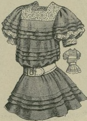
11.—Vestido de niña

En muchas ocasiones las gasas, hábilmente combinadas por Paquín, contribuyeron más poderosamente al éxito de una comedia, en las escenas parisienses, que el talento del autor.