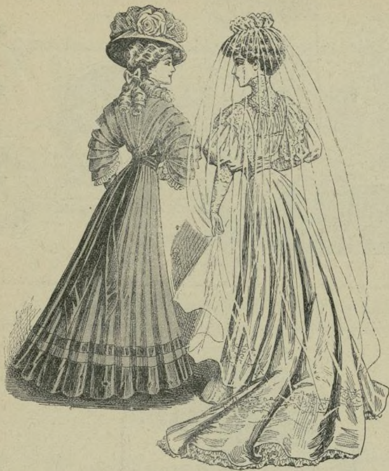
3 y 4.—Trajes de doncella de honor y de boda del fig. iluminado