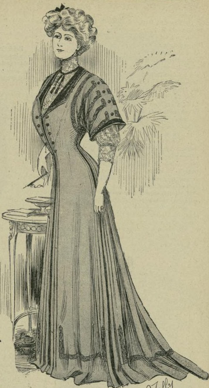
1 —Traje de recepción

Sólo conserva de su pasado esplendor su sugestiva belleza de morena sentimental.