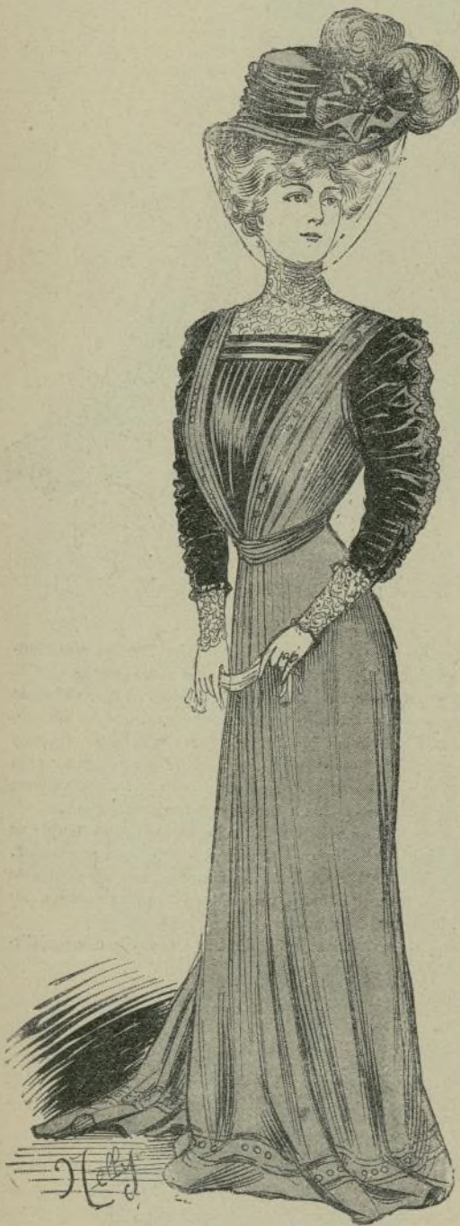
9.—Traje de visita

II. Vestido elegante para niña, de velo de seda de color crema, de hechura recta, plegado á pliegues de lencería, con