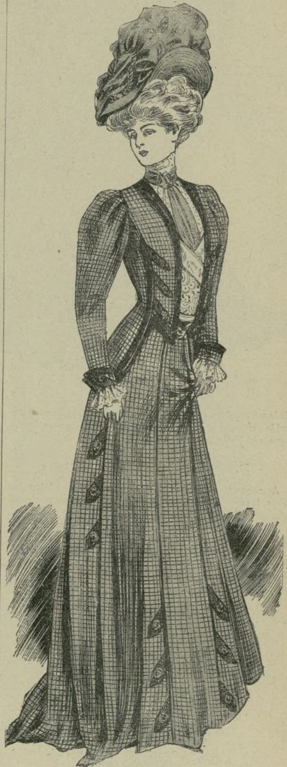
10.—Vestido de entretiempo

También tomaron parte en la Exposición las mujeres de Bélgica, China, España, Francia, Hungría, Japón, Méjico, Portugal, Rumanía, Rusia, Sicilia, Siam, Turquía y Estados Unidos de América, descollando entre los artículos recibidos de estas naciones, las obras de arte y las labores presentadas por nuestras compatriotas.