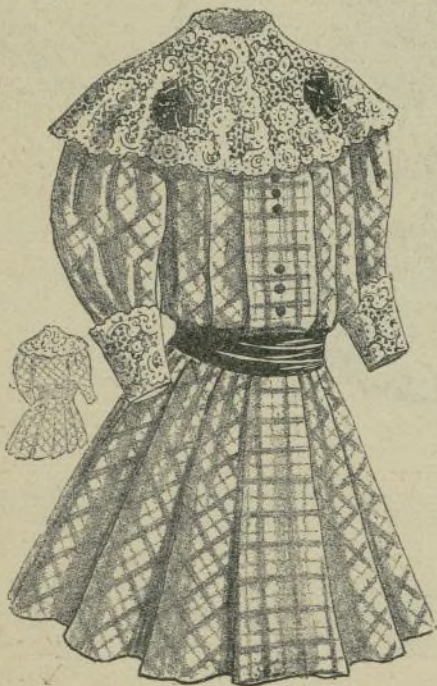
6.—Vestido de niña

2. HOJA DE DIBUJOS NÚM. 630. — Diversos y variados dibujos. — Véanse las explicaciones en la misma hoja.