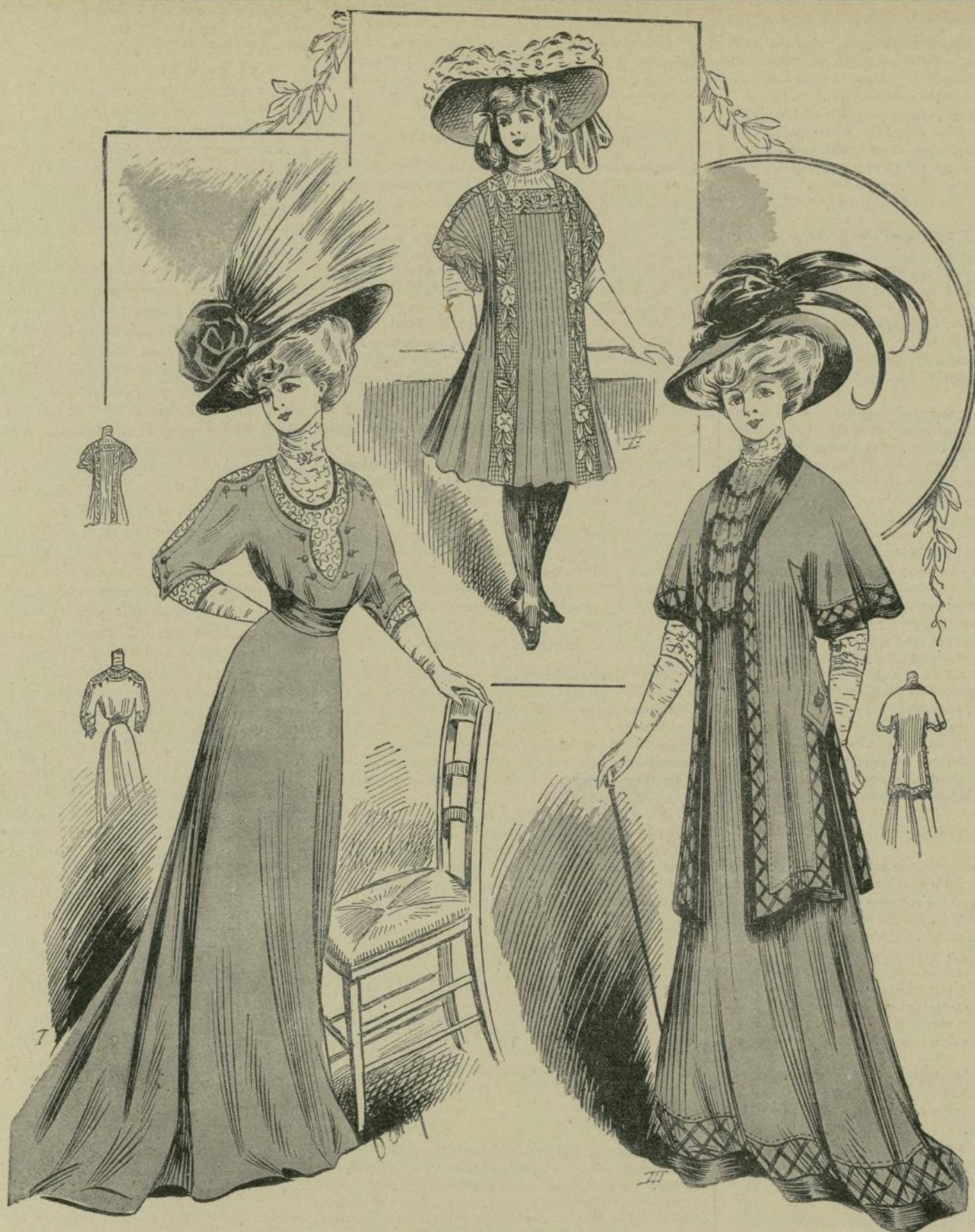
17. — Trajes de paseo

ta aristócrata se queda sin un penique por predicar la buena nueva, el intransigente Bebel ha llegado á tener en Alemania palacios y muchos miles de francos, y Jaurés no anda sino en magnífico automóvil y posee magníficos cuadros y tapices.