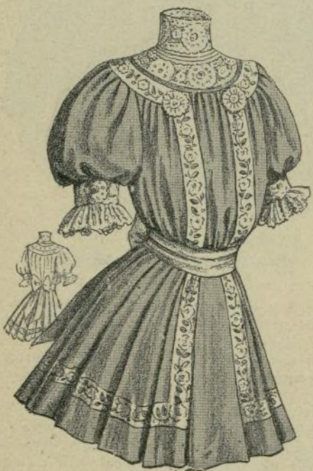
14.—Vestido elegante para niña

No deja de ser curioso que mientras esta furibunda socialis-