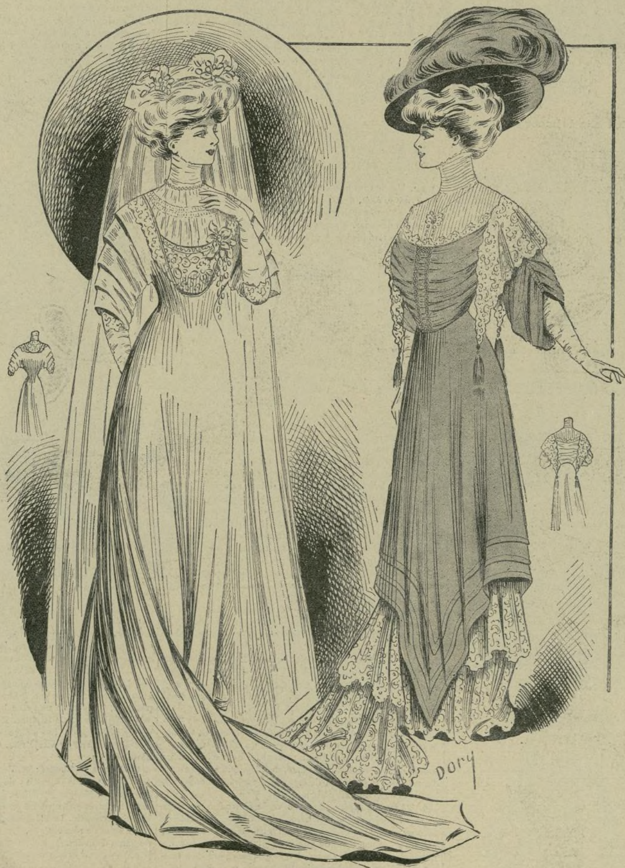
1 y 2. — Trajes de boda y de ceremonia

REGALO A LOS SEÑORES ABONADOS A LA BIBLIOTECA UNIVERSAL ILUSTRADA