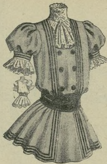
5.—Vestido de niña

Los grabados 3 y 4, intercalados en el texto, representan estos trajes vistos por detrás.