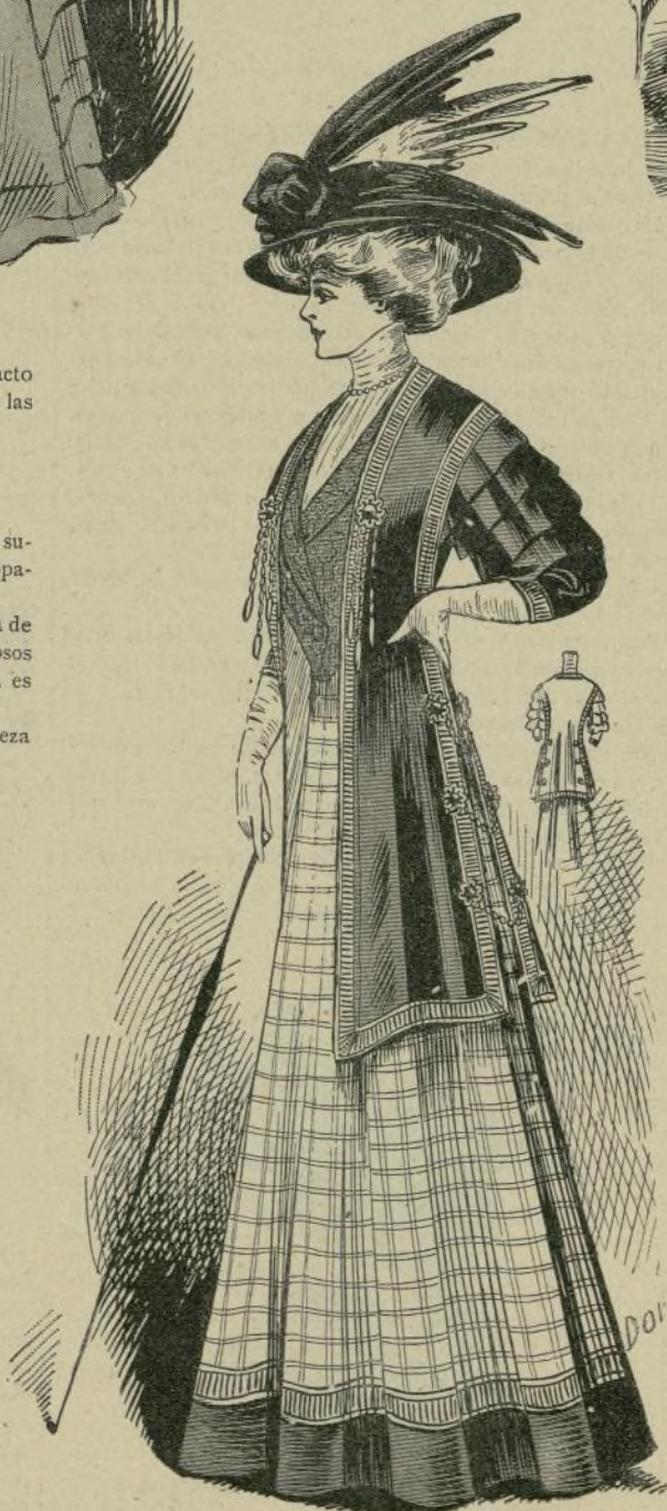
15.—Traje de mañana