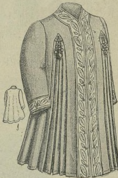
5.—Abrigo de niña

12. TRAJE de paño arrasado de color azul. La falda está abierta en el lado derecho sobre una quilla de encaje de color crudo. Cuerpo abierto, abrochado á un lado, con cuello y cinturón de terciopelo. Mangas adornadas de pliegues respuntea-