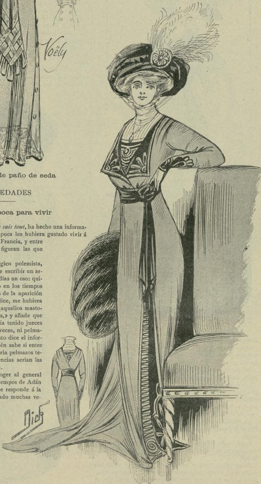
8.—Vestido de paño

Representar un personaje ante un aparato que registrase los gestos y las palabras para luego reproducirlos en veinte escenarios a la vez, pensar una obra, y que una máquina la alma-