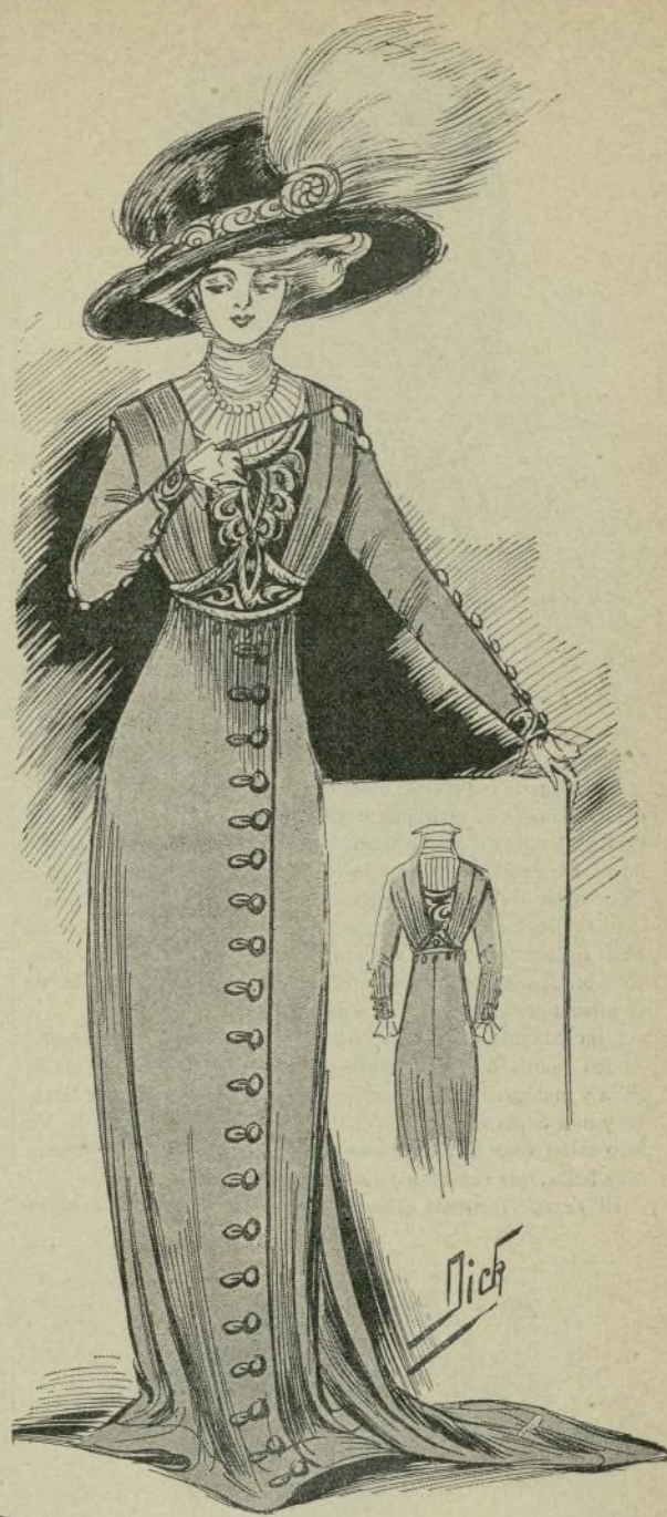
9.—Vestido de paño

cenase en seguida, resolver ecuaciones que inscribirían a la vez muchos hilos eléctricos en cien encerados, tales son las aspiraciones respectivas de Coquelín «ainé,» J. H. Rosny y Poincaré.