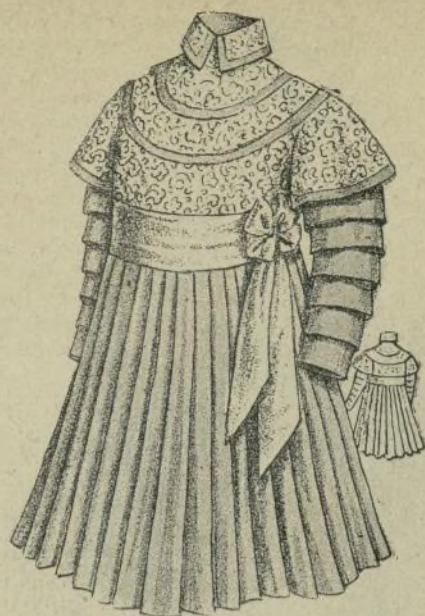
13.—Vestido de lana para niña

En esa misma fecha se habían construído 5.740 kilómetros de líneas de tranvías y ferrocarriles eléctricos: 4.690 en Francia, 2.848 en Inglaterra, 680 en Italia, 657 en Suiza, 476 en España, 417 en Austria, 140 en Rusia, 120 en Suecia, 59 en Servia, 32 en Holanda, 30 en Portugal y 29 en Rumania.