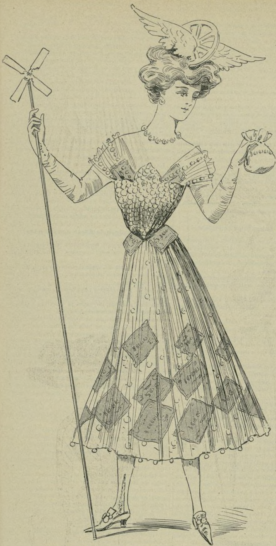
15.—La Fortuna (disfraz para señorita)