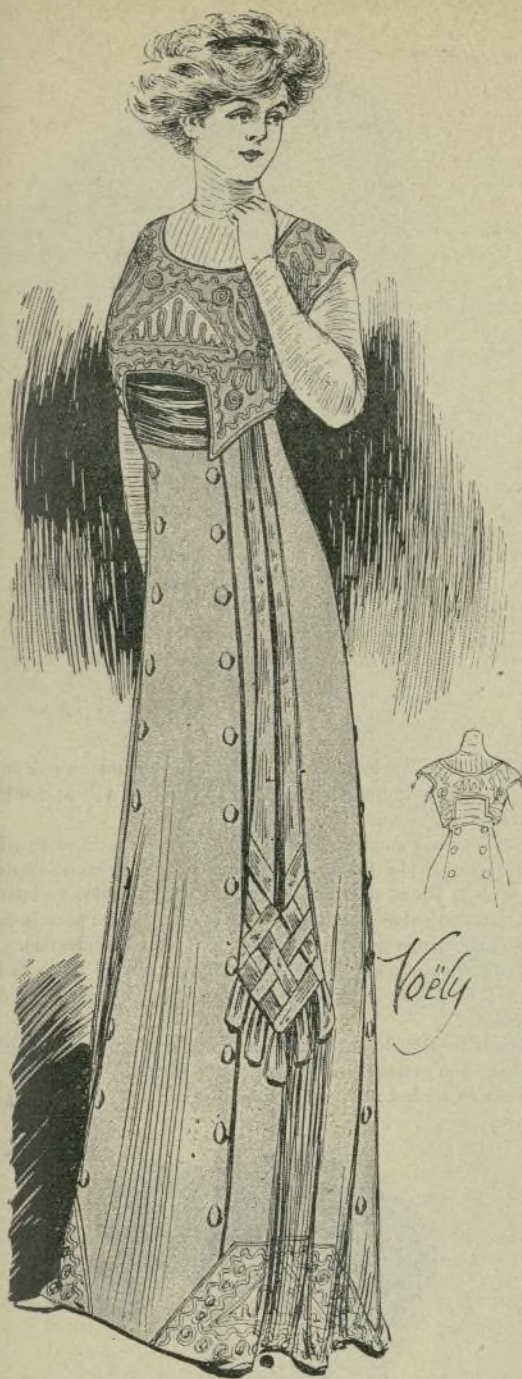
7.—Vestido de paño de seda