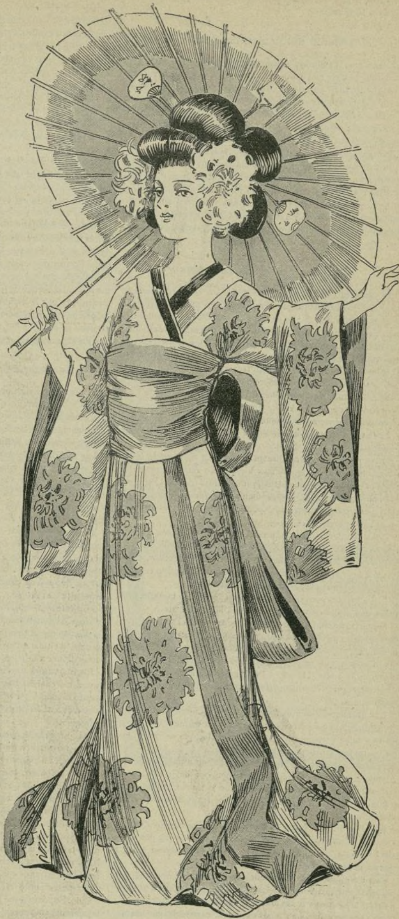
16.—Madama Crisantema (disfraz para señorita)

ción los hombres pelearon como mujeres y éstas como hombres. Sabido es que el valor de las espartanas rayó en lo sublime.