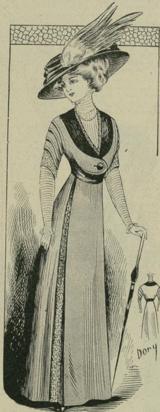
12.—Traje de paño

Tenemos á la vista una copiosa estadística de los ferrocarriles construídos en las diferentes naciones de Europa, Asia,