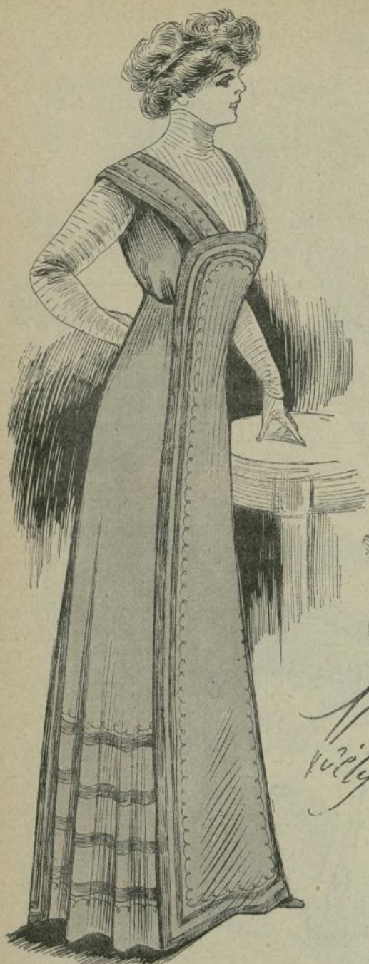
4.—Vestido de paño