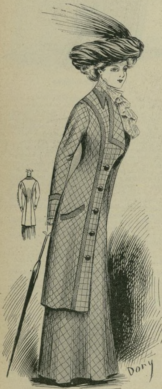
11.—Traje de estilo de sastrer

El fumoir recuerda el estilo de Enrique II, y en él aparece