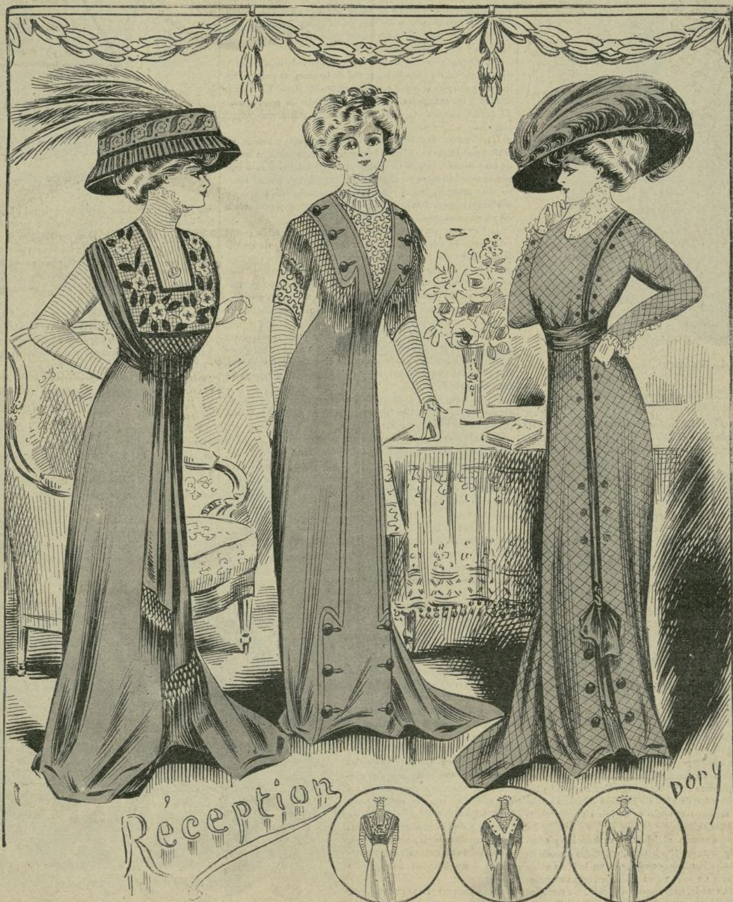
1 á 3.—Trajes de recepción

REGALO A LOS SEÑORES ABONADOS A LA BIBLIOTECA UNIVERSAL ILUSTRADA