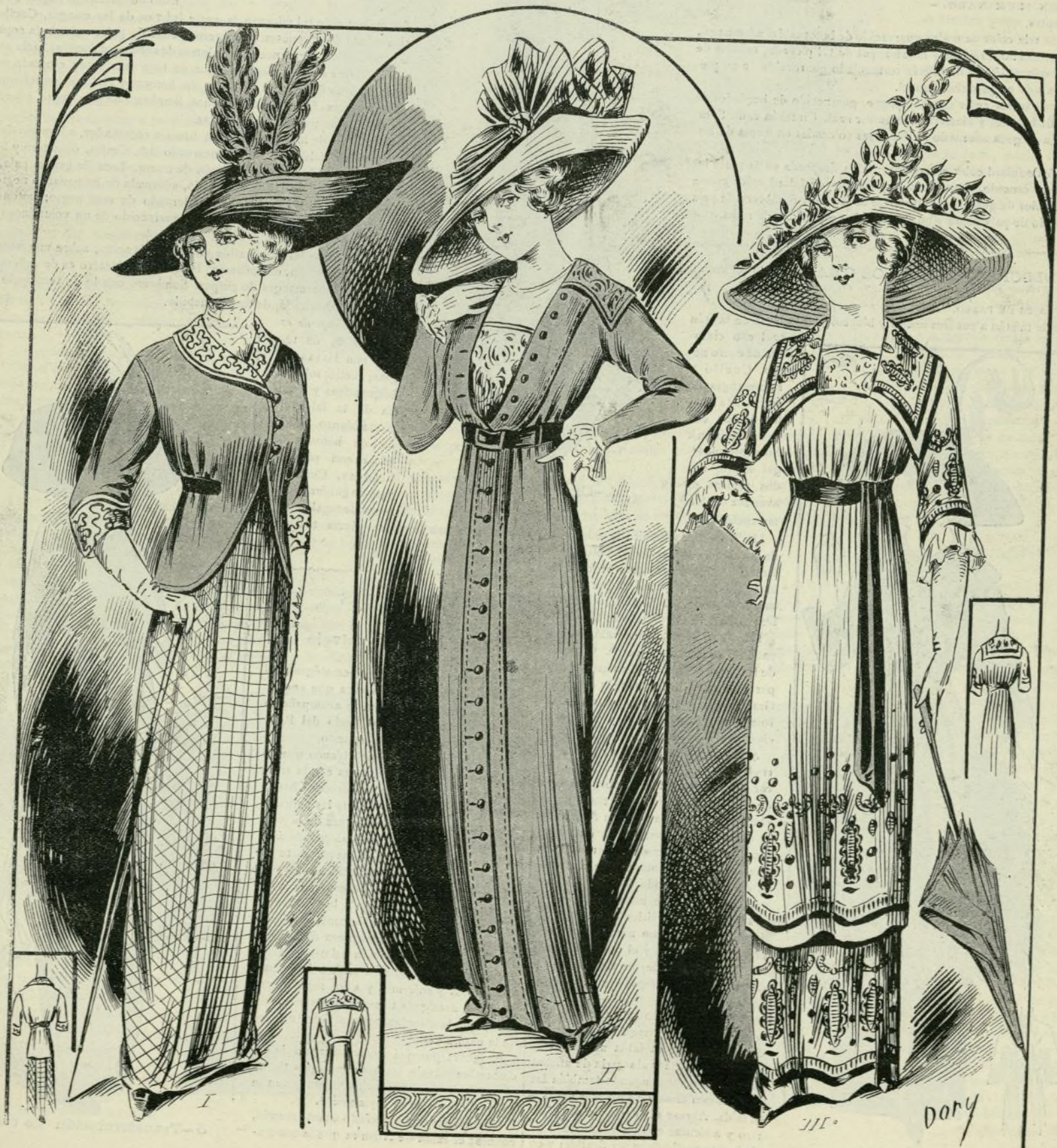
1 a 3.—Trajes de paseo

REGALO Á LOS SEÑORES ABONADOS Á LA BIBLIOTECA UNIVERSAL ILUSTRADA