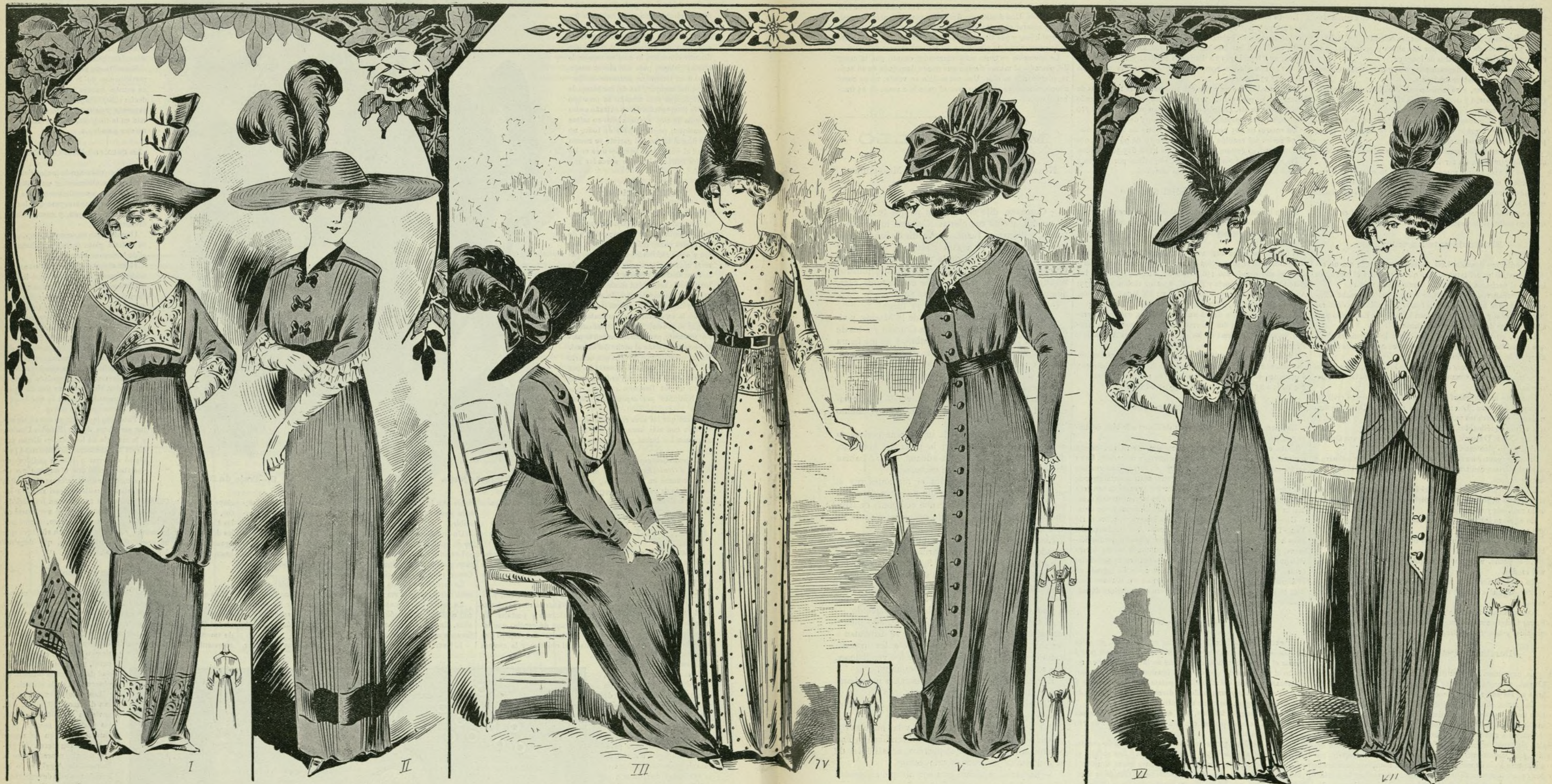
II A 17.—TRAJES PARA REUNIONES DE SPORT