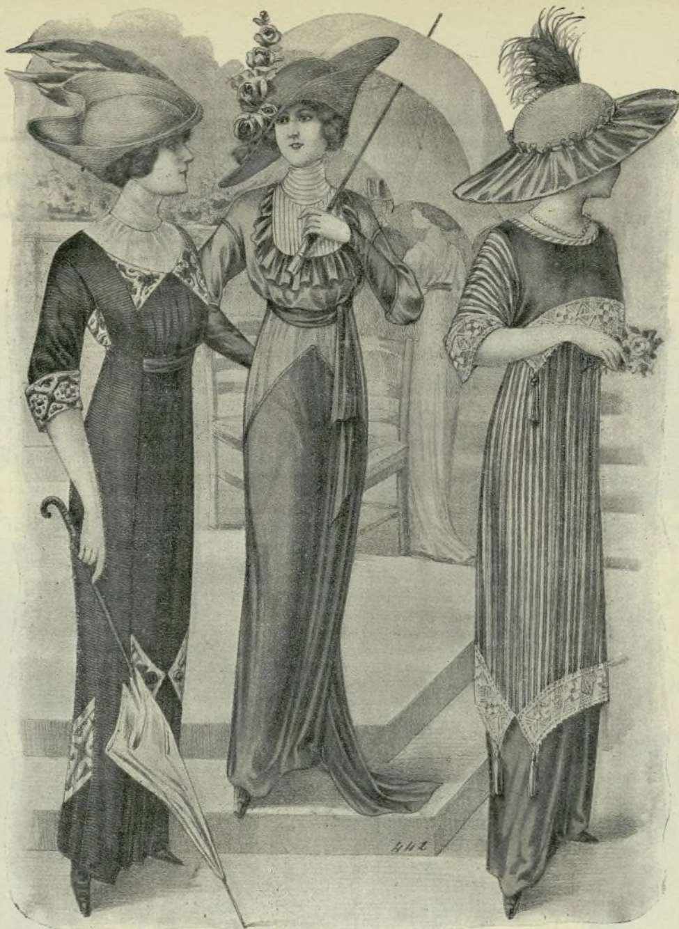
7.—Traje de jerga

Un niño de nueve años ha presentado un apunte, de memoria, de dos elegantes señoritas, como ya quisieran hacerlas muchos que se llaman dibujantes, y entre los expositores ilustres figura el condesito Miguel de Torby, hijo del gran duque Miguel de Ru-