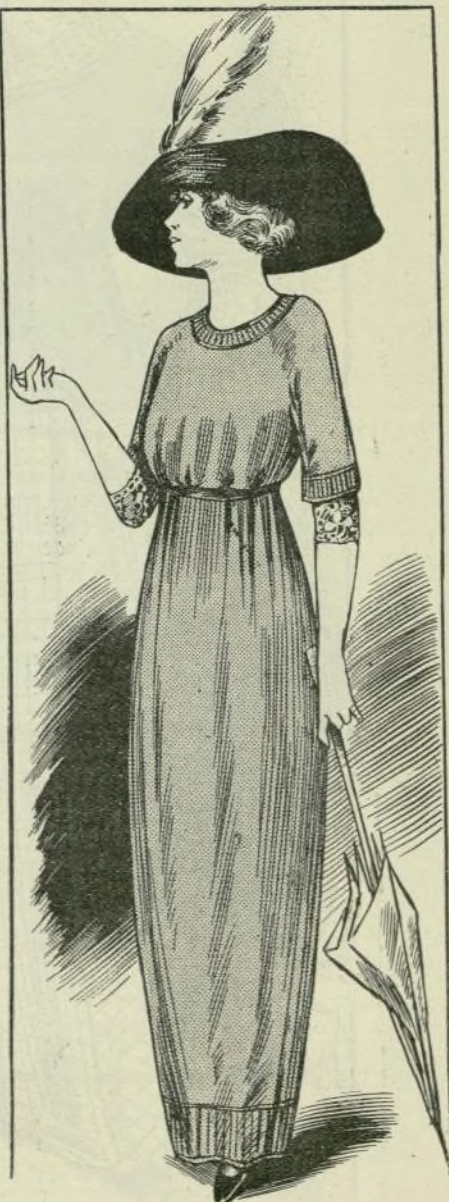
5.-Transformación de trajes