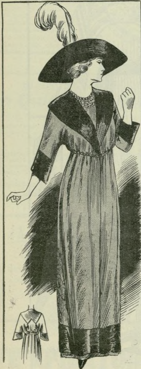
6.-Transformación de trajes

VII. Traje de estilo sastre, de tela azul con listas negras; cuello, solapas, bocamangas y presilla de la falda de piqué blanco. Adorno de botones de nácar con presillas blancas. Cuello y peto de guipur. Sombrero de tagal negro, adornado de una hermosa pluma también negra.