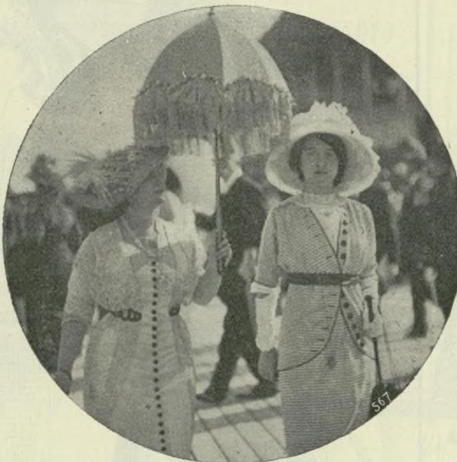
5.—Trajes de playa

III. Traje de muselina de lana con canesú de raso orlado de bellotitas blancas. Una aplicación bordada en colores va prendida en la falda, drapeándola. Bordados adecuados adornan las mangas y los hombros. Corbata y cinturón de raso.