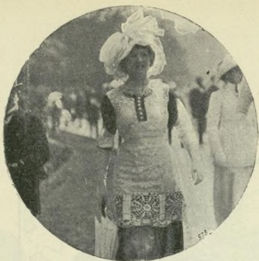
8.—Traje para balnearios

I. Traje de raso flexible de color azul mirto drapeado en forma de paniers, sobre la falda interior plegada de crespón de China color de marfil. Tirantes y bocamangas de guipur, orladas de terciopelo azul. Peto y cuellecito de tul. Sombrero de terciopelo guarnecido de plumas negras.