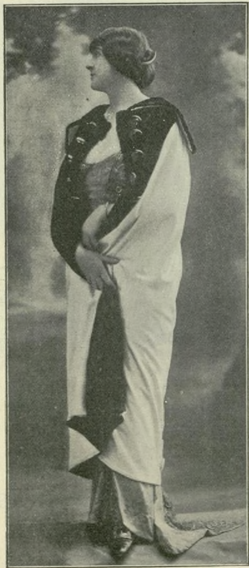
9.—Abrigo de paño blanco

VI. Traje de tafetán a cuadros color de malva y negro. Ber-