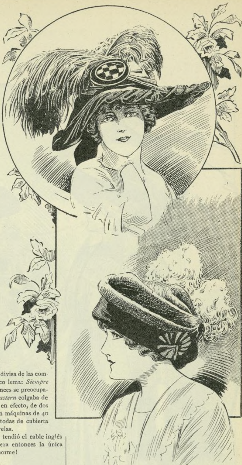
10.—Modelos de sombreros otoñales

Claudio Monteverde amplió la idea de sus predecesores en su ópera Orfeo y Euridice , estrenada en la corte de Mantua en 1604, y este genio eminentemente creador llevó a cabo la evolución iniciada veinticuatro años antes, hallando en él emoleo frecuente de la disonancia natural el verdadero lenguaje de la pasión.