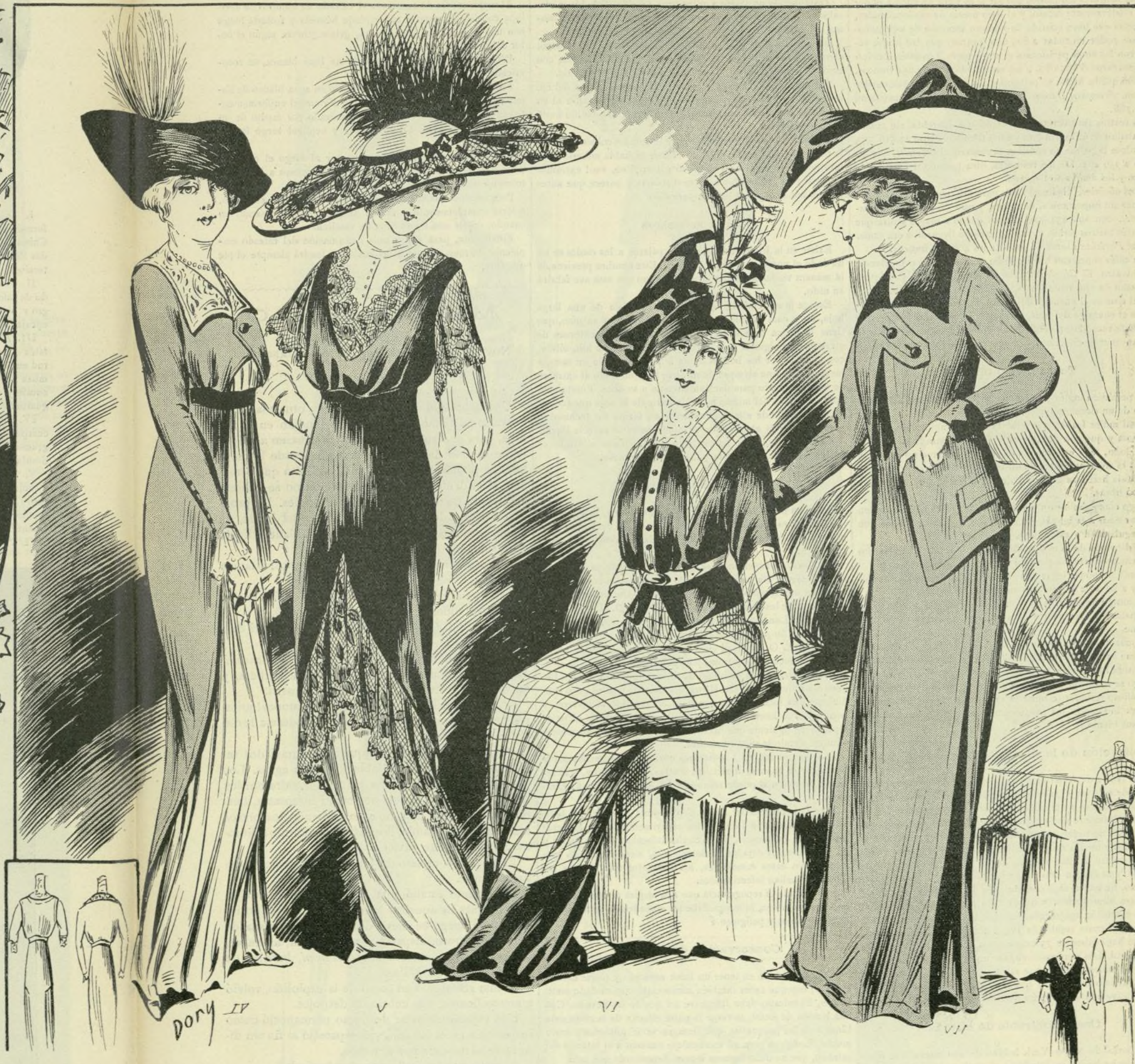
12 A 18.— PANORAMA DE TRAJES VARIADOS