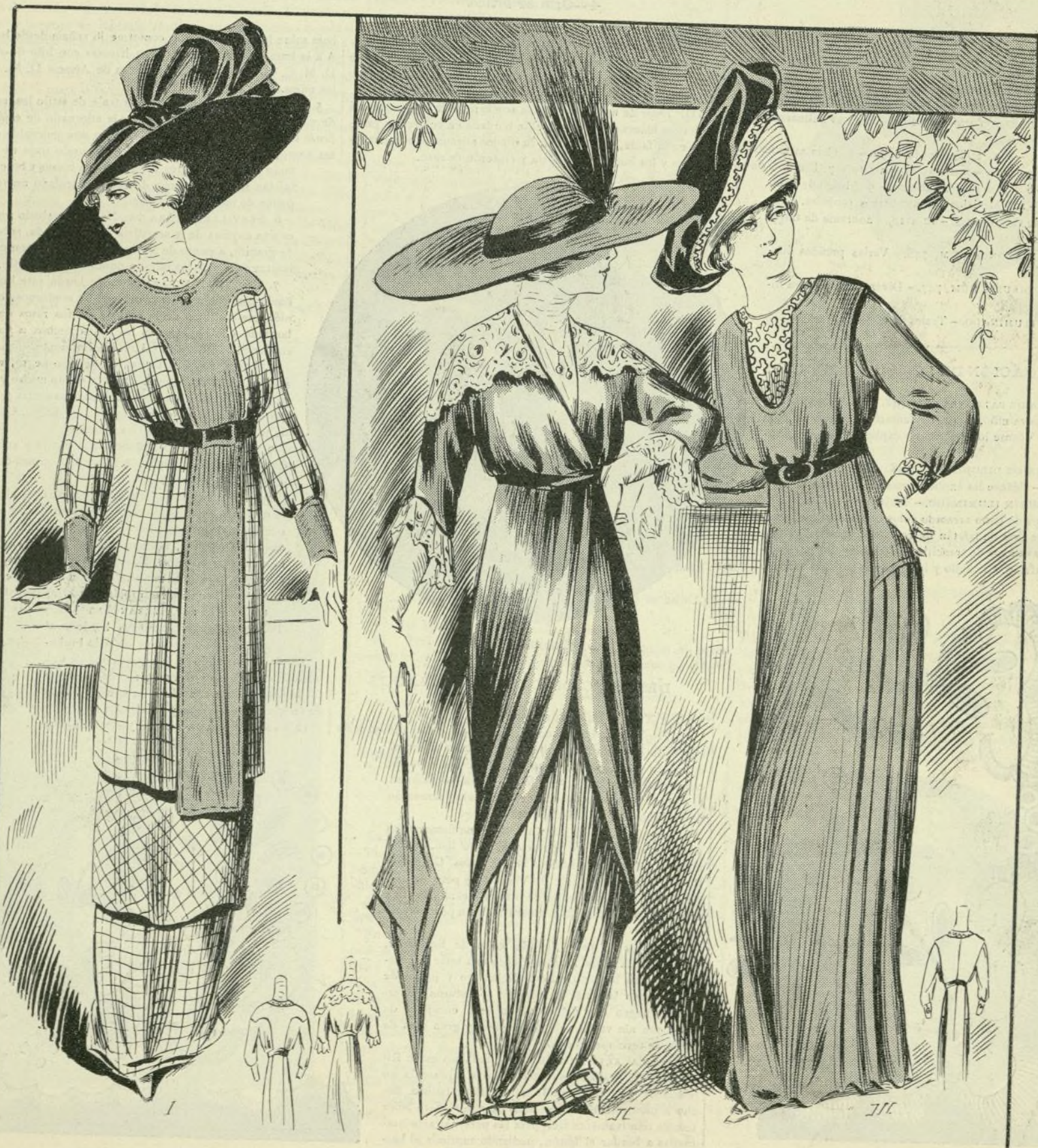
1 a 3.-Trajes de calle

REGALO Á LOS SEÑORES ABONADOS Á LA BIBLIOTECA UNIVERSAL ILUSTRADA