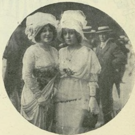
11.—Trajes de veraneantes

Félix Duquesnel, en uno de los últimos números de Le Theatre , entona casi un himno a las glorias crematísticas del teatro parisiense. ¿Que el teatro agoniza, que muere, que le mata el cine? ¡Quién piensa en eso! La elocuencia de las cifras da una réplica victoriosa. El teatro, dice Duquesnel, no sólo no muere, sino que se porta a las mil maravillas. Ello se desprende de la estadística de los ingresos realizados en 1911, durante el cual fué algo floja la producción dramática. A pesar de