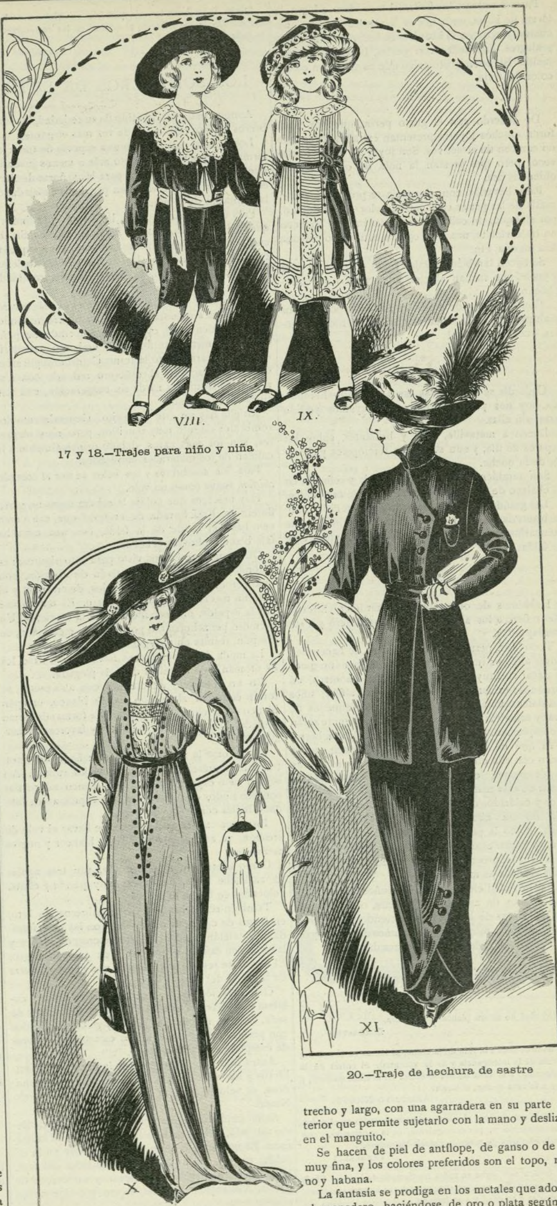
17 y 18.—Trajes para niño y niña

La moda exige que este año el monedero sea ex-