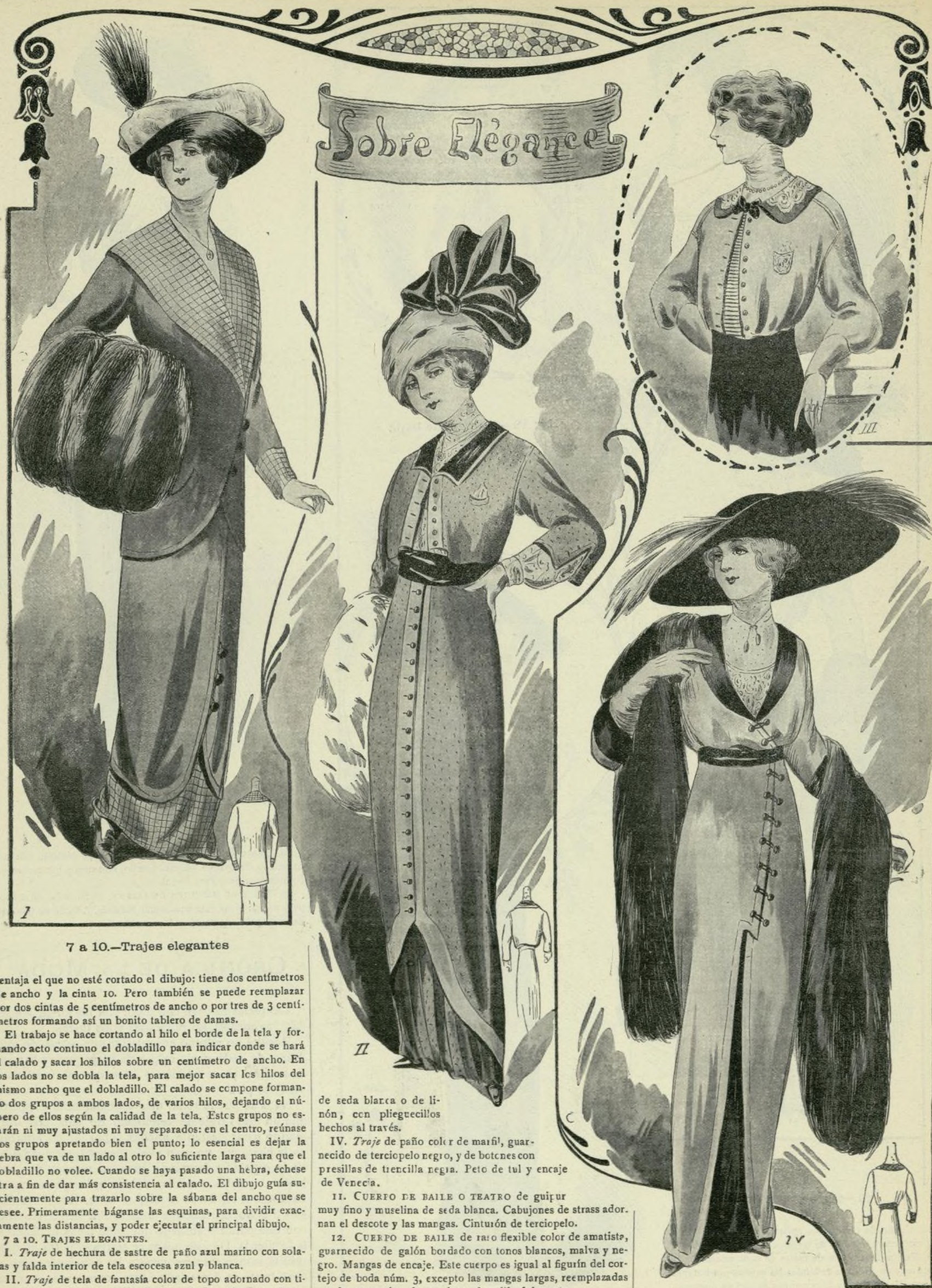
7 a 10.—Trajes elegantes

ventaja el que no esté cortado el dibujo: tiene dos centímetros de ancho y la cinta 10. Pero también se puede reemplazar por dos cintas de 5 centímetros de ancho o por tres de 3 centímetros formando así un bonito tablero de damas.