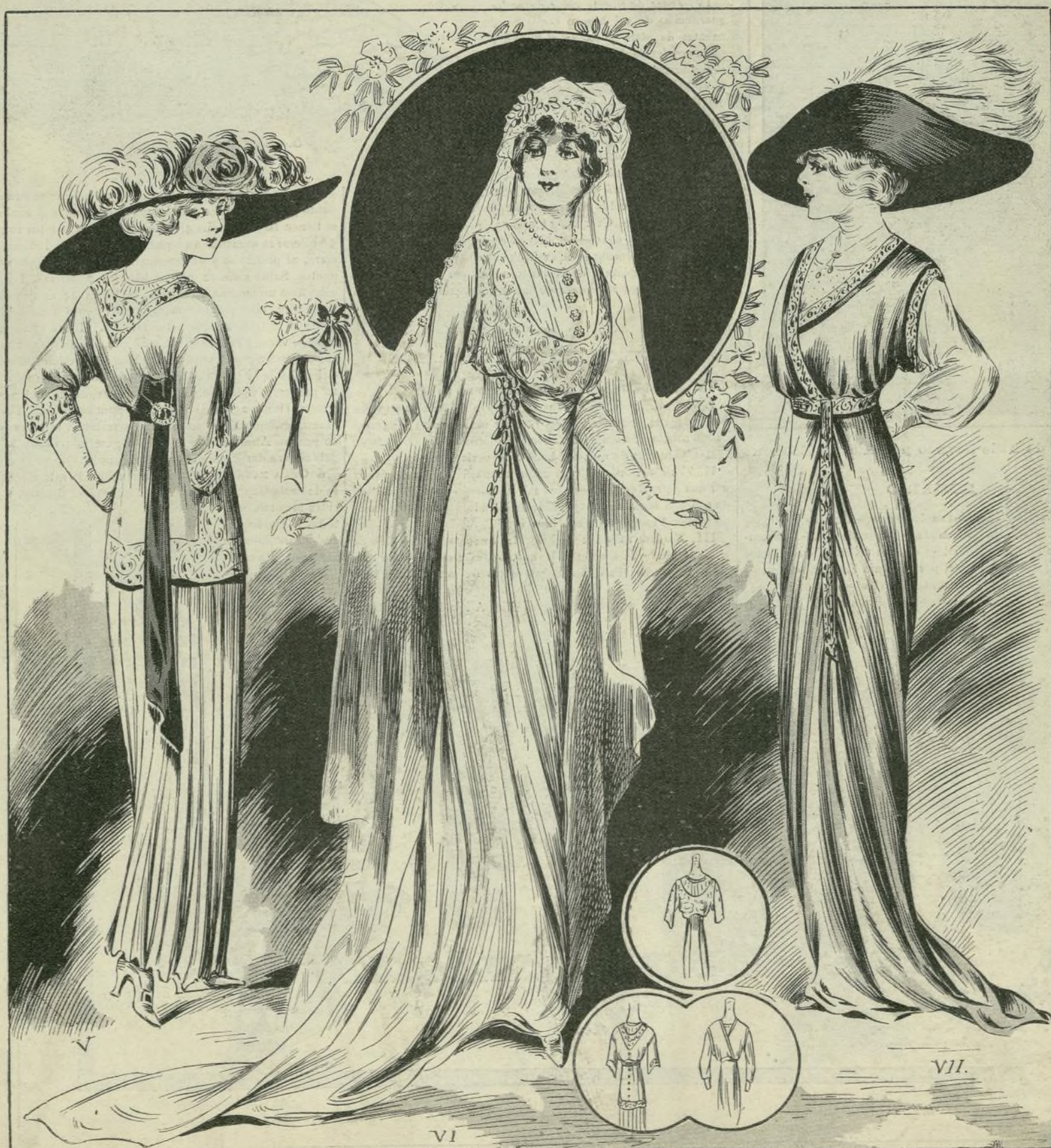
1 a 3.—Trajes de novia y de cortejo de boda

REGALO Á LOS SEÑORES ABONADOS Á LA BIBLIOTECA UNIVERSAL ILUSTRADA