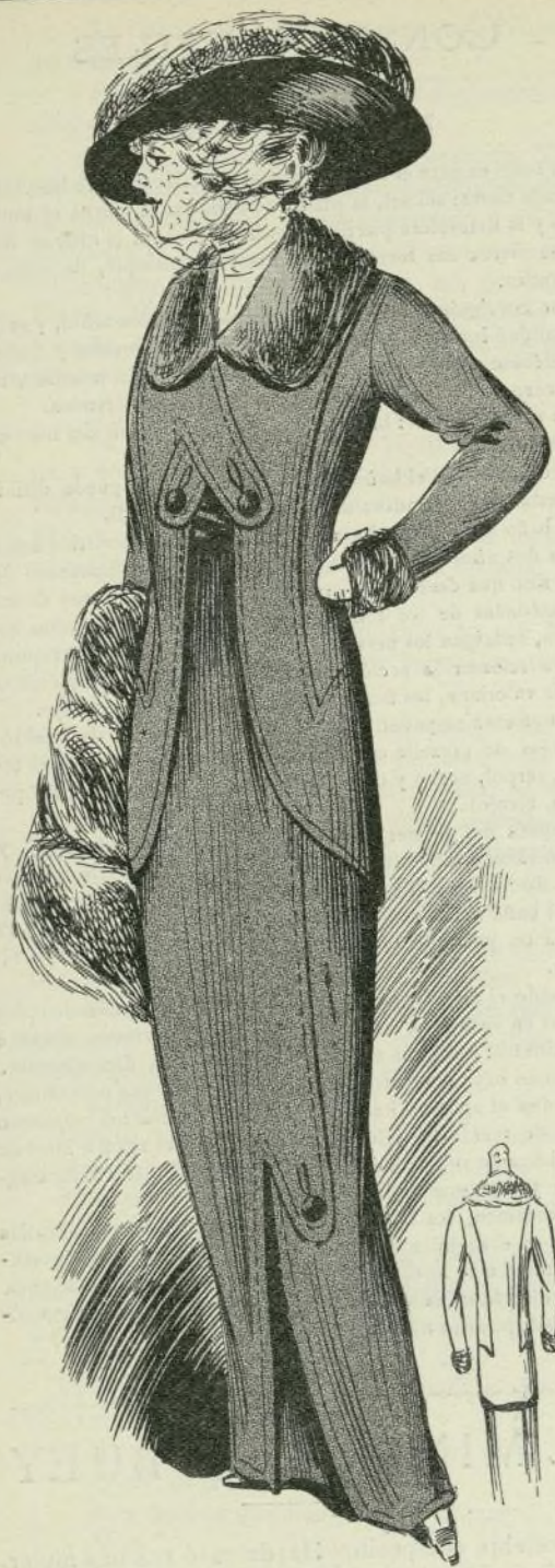
16.—Traje de hechura de sastre

detrás. Esto es una regla general para todas las telas listadas.