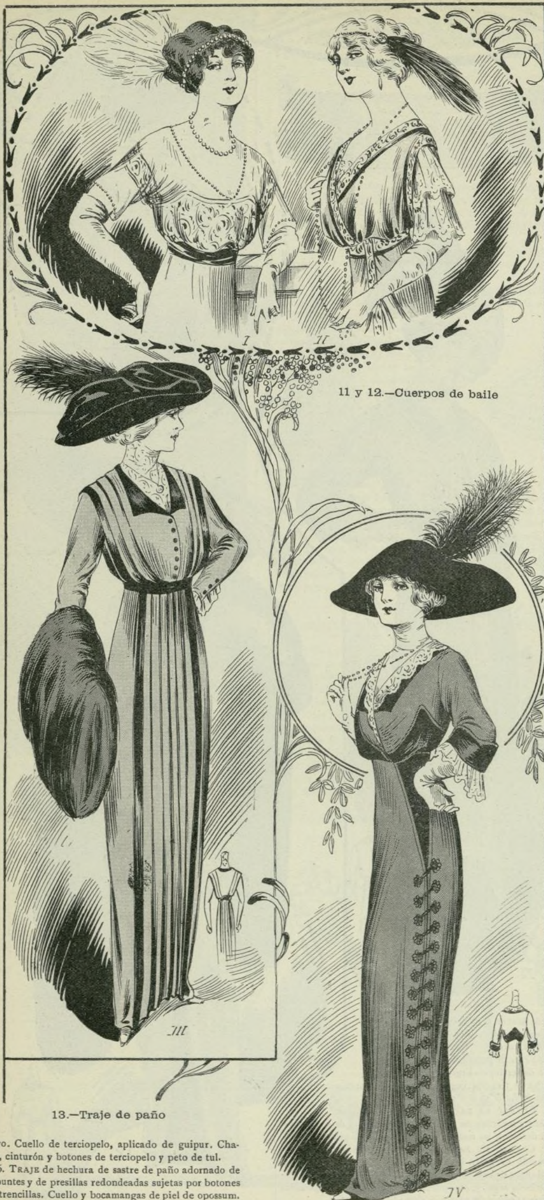
11 y 12.—Cuerpos de baile