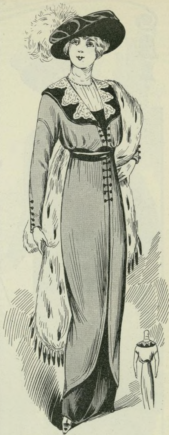
15.—Traje de cachemira

19. TRAJE de cachemira de seda color de violeta, con un delantero de grueso guipur. Cuello, cinturón y botoncitos de terciopelo negro. Peto de tul.