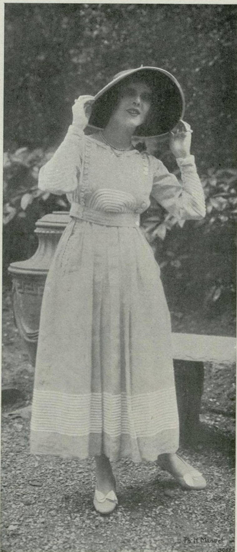
Bonita creación de la Casa Peggy

He visto uno de esos trajes en gabardina vellorí; de la placa de la chaqueta caen pliegues continuados por los de la falda; un cinturón de la misma tela los sujeta a la cintura. Dos bolsillos acentúan el carácter de este traje, que sienta muy bien a las mujeres jóvenes.