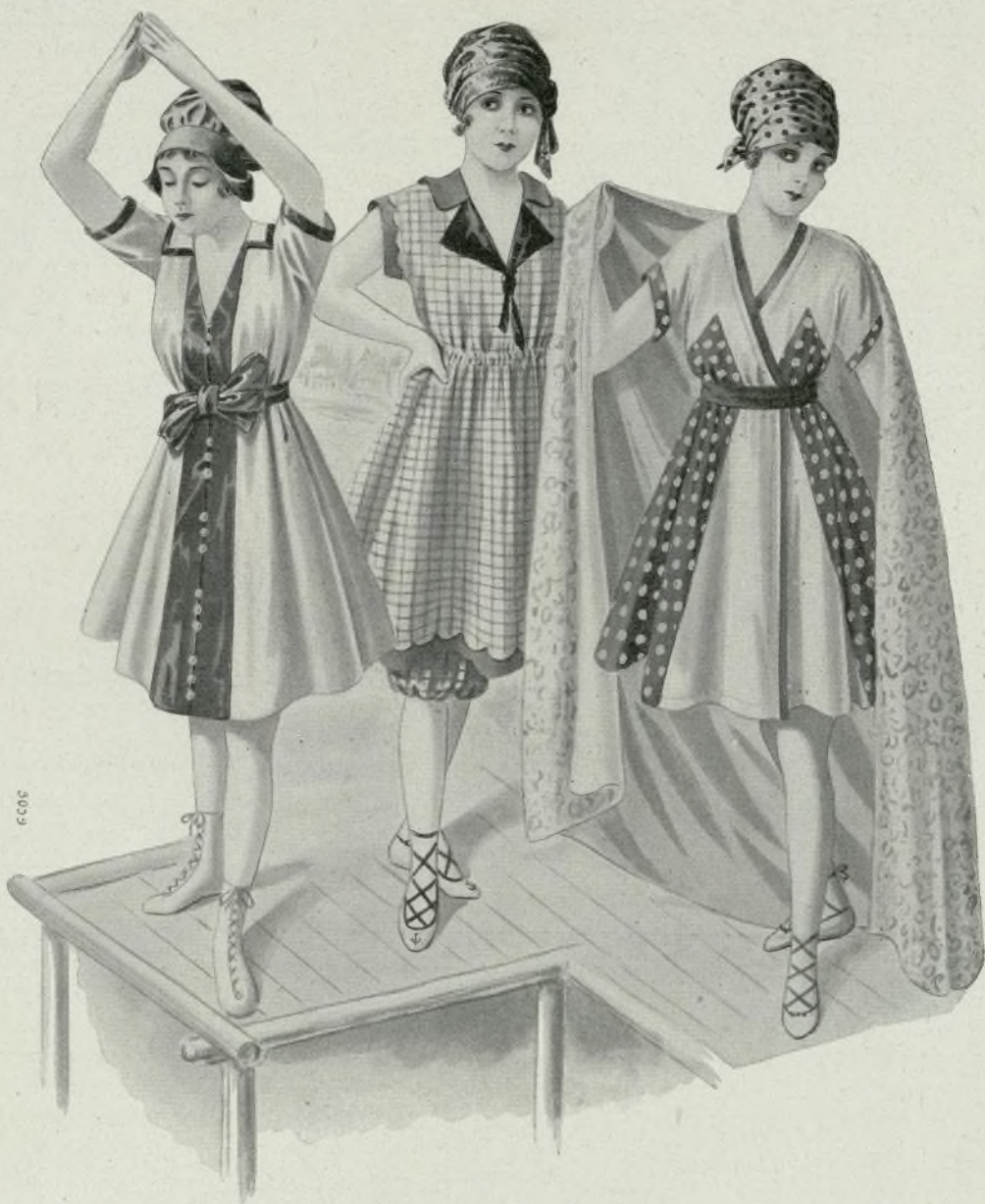
TRAJES DE BAÑO

Durante los calores de la próxima estación, serán indudablemente muchas las lectoras de esta Revista que tendrán el gusto de vera- near en alguna playa y la ocasión de poder tomar baños de mar. En su obsequio nos hemos complacido en idear varios modelos de tra- jes sencillos, elegantes, caprichosos y de fácil confección, para todas edades y estados.