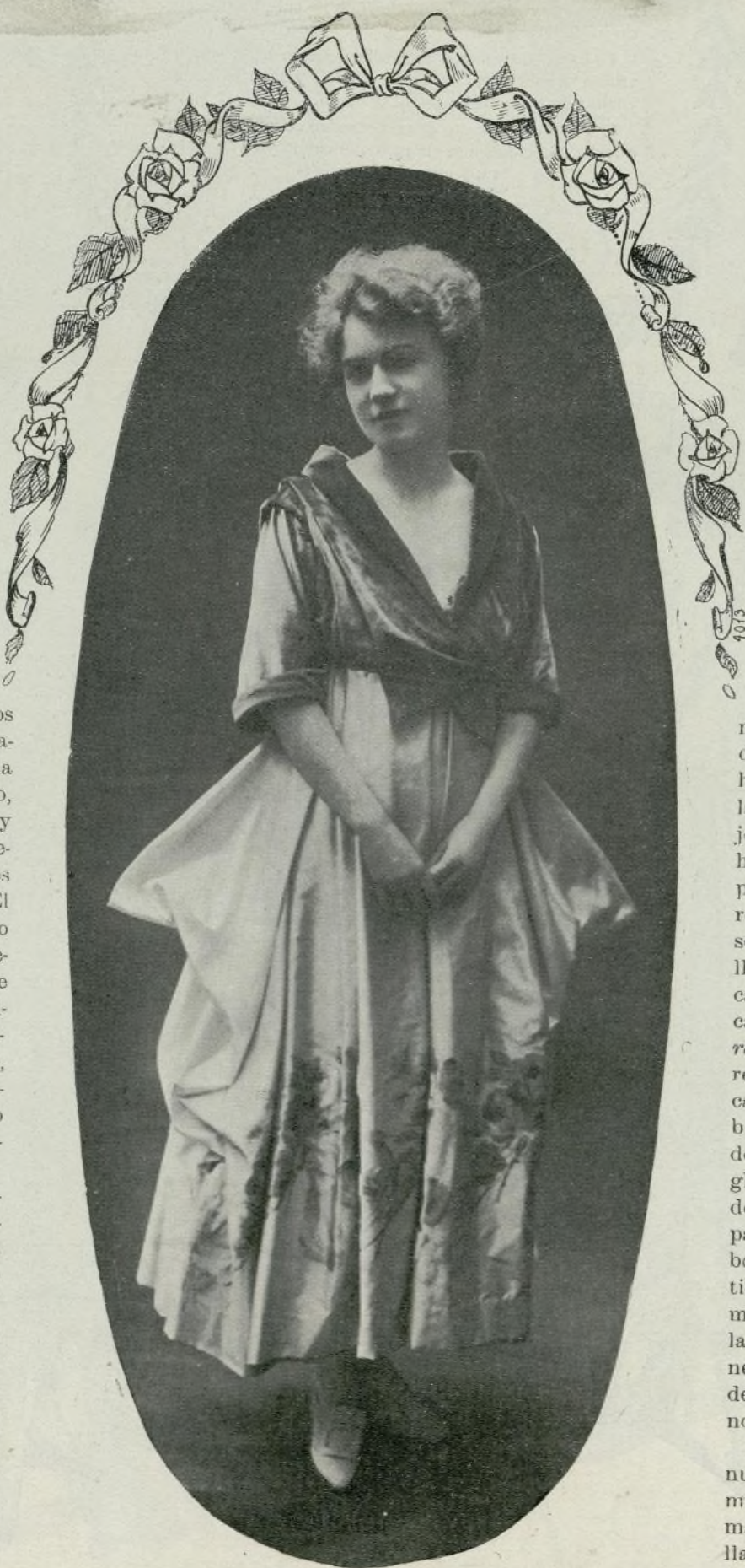
Bonito traje de faya estampada llevado por una de las parisienses más elegantes

Actualmente triunfa el traje-camisa, generalmente guarnecido de finísimos bordados. A esta clase pertenece el modelo a que se ha dado el nombre de Beatriz , sin duda porque evoca la figura de la mujer amada y cantada por Dante. Es de una sola línea recta, pero la tela, un crespón de seda espesa marrón, se plisa debajo de las caderas en menudos pliegues, sobre los cuales hay a cada lado un tejo bordado de oro. Otro bordado de oro acentúa la placa de un hombro al otro, y forma como una hebilla en la cintura. Un rico abrigo de pieles