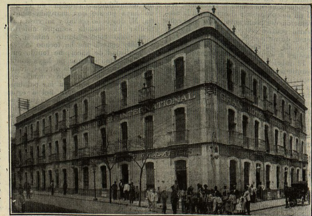
GRAN HOTEL INTERNACIONAL