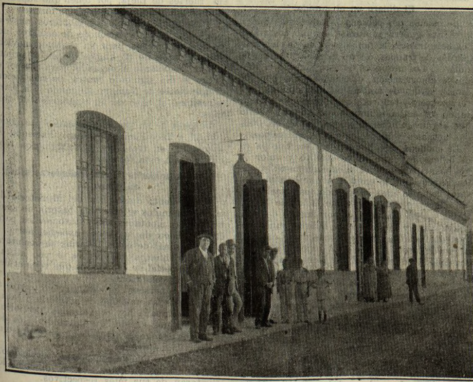
GRAN SALON DE LA CONCHA