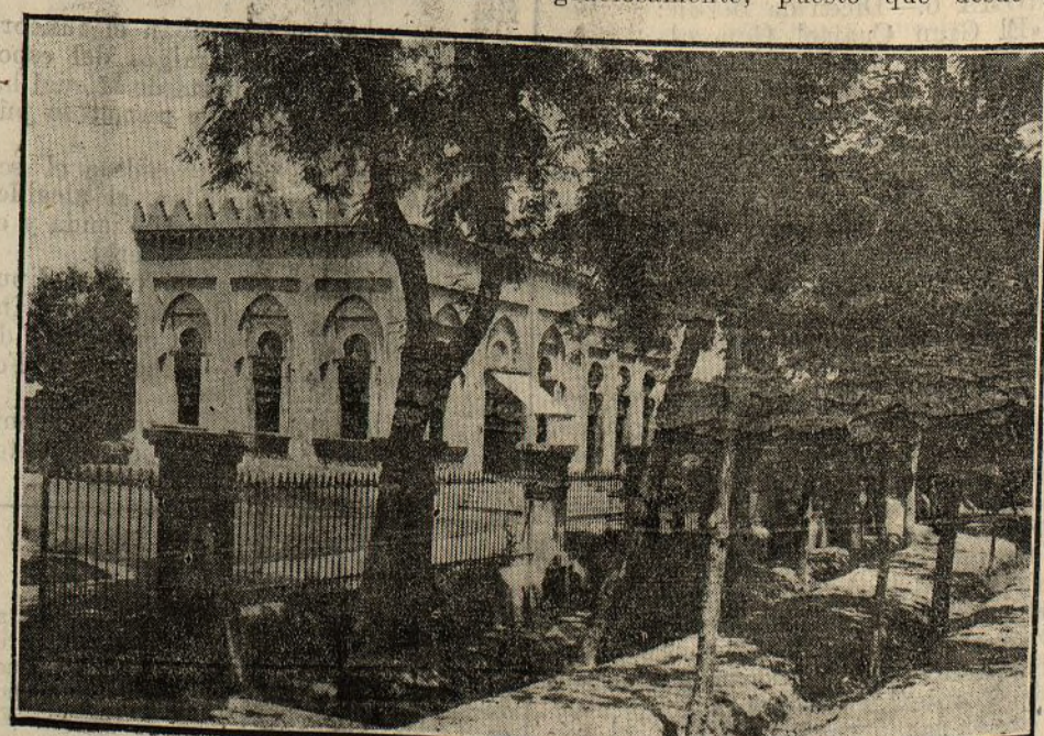
LAS DELICIAS - CASA DE MÁQUINAS