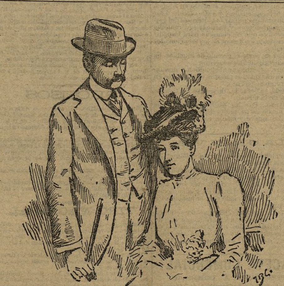
LA PRINCESA ESTEFANÍA Y SU ESPOSO EL CONDE DE LONDAGY

La mayor parte de los acaparadores hasta el día para emplearlos en semejante industria proceden de los soldados muertos en la guerra del Transvaal.